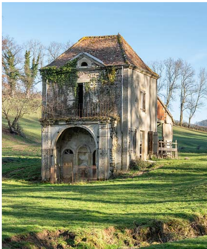
Pavillon de la source, vue de trois quarts.

71, Saint-Christophe-en-Brionnais route départementale n°174, lieudit : Les Bains