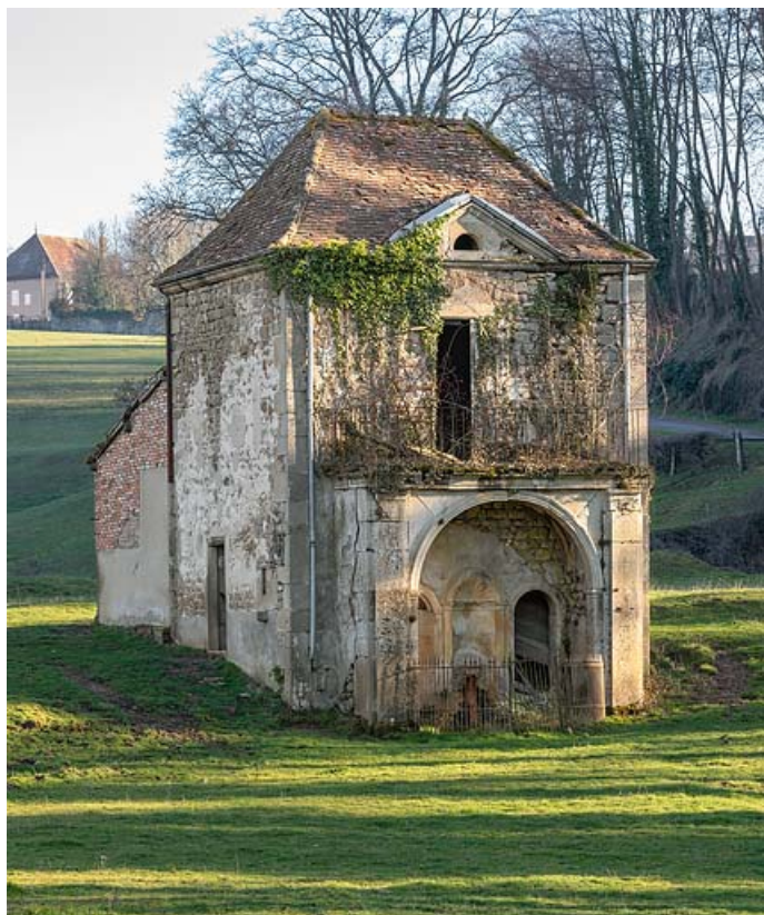
Pavillon de la source, vue de trois quarts.

71, Saint-Christophe-en-Brionnais route départementale n°174, lieudit : Les Bains