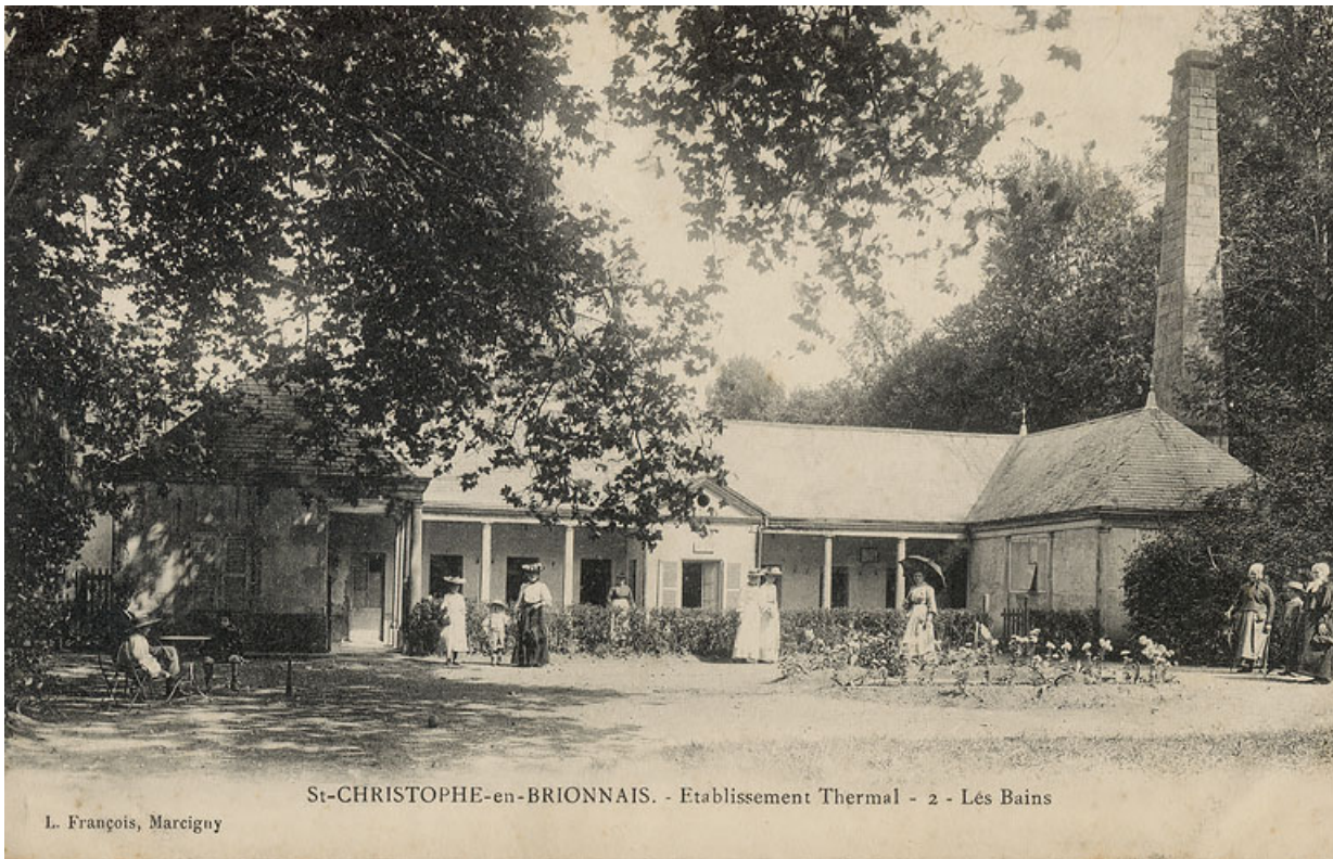
Vue des bains au début du 20e siècle.

71, Saint-Christophe-en-Brionnais route départementale n°174, lieudit : Les Bains