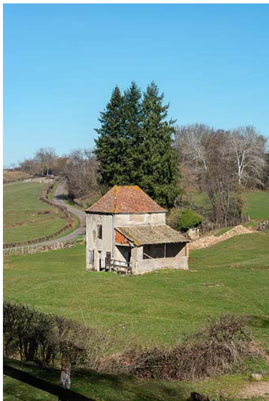
Vue générale du site, prise depuis la route (vue de l'arrière du pavillon de la source).

71, Saint-Christophe-en-Brionnais route départementale n°174, lieudit : Les Bains