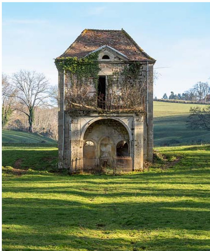
Pavillon de la source, vue de face.

71, Saint-Christophe-en-Brionnais route départementale n°174, lieudit : Les Bains