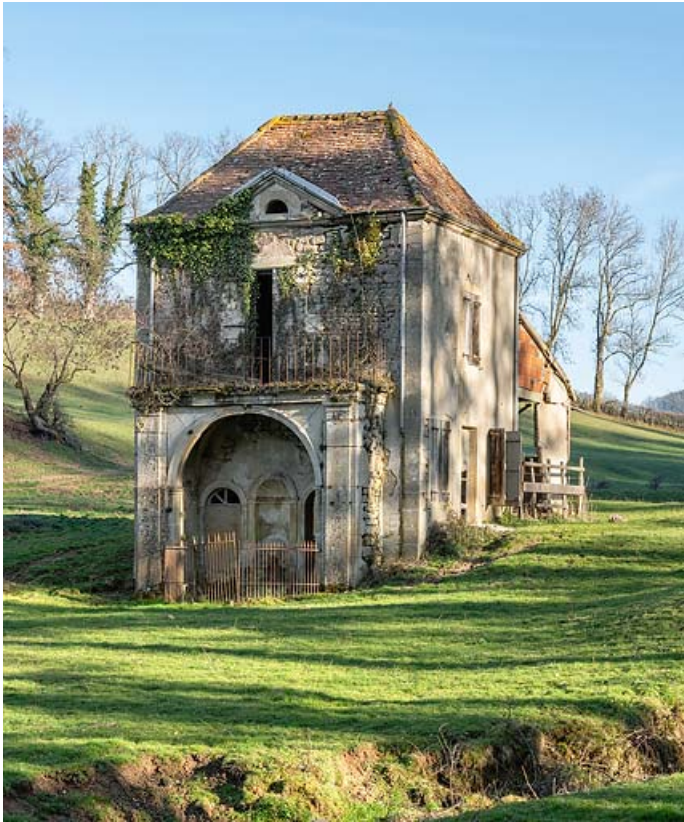
Pavillon de la source, vue de trois quarts.

71, Saint-Christophe-en-Brionnais route départementale n°174, lieudit : Les Bains