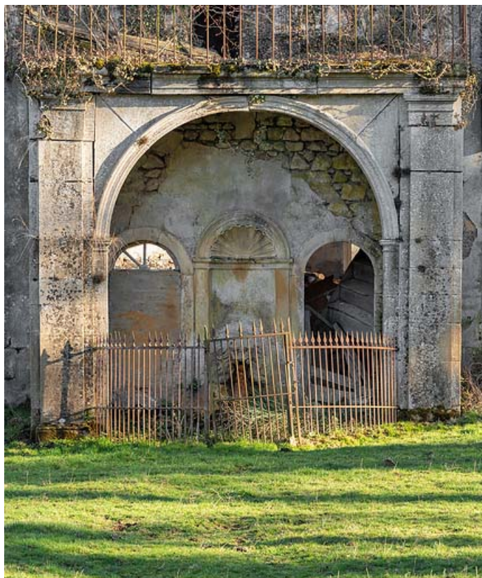
Pavillon de la source, vue rapprochée de face.

71, Saint-Christophe-en-Brionnais route départementale n°174, lieudit : Les Bains