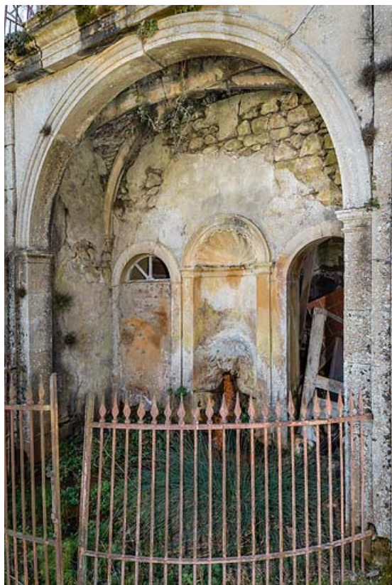
Pavillon de la source, vue rapprochée de trois quarts.

71, Saint-Christophe-en-Brionnais route départementale n°174, lieudit : Les Bains