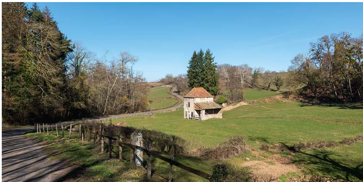
Vue générale du site, prise depuis la route (vue de l'arrière du pavillon de la source). 71, Saint-Christophe-en-Brionnais route départementale n°174, lieudit : Les Bains

N° de l'illustration : 20207100788NUC2AQ