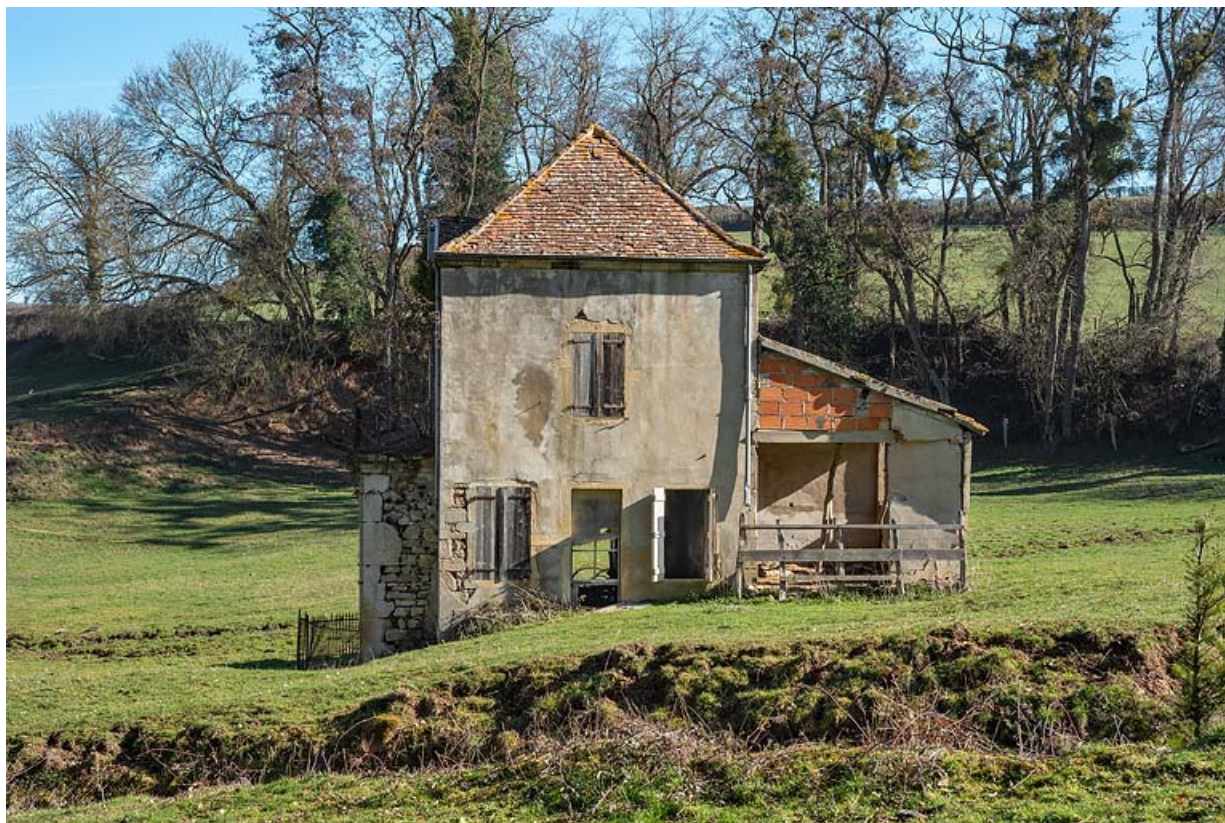
Pavillon de la source, vue latérale.

71, Saint-Christophe-en-Brionnais route départementale n°174, lieudit : Les Bains