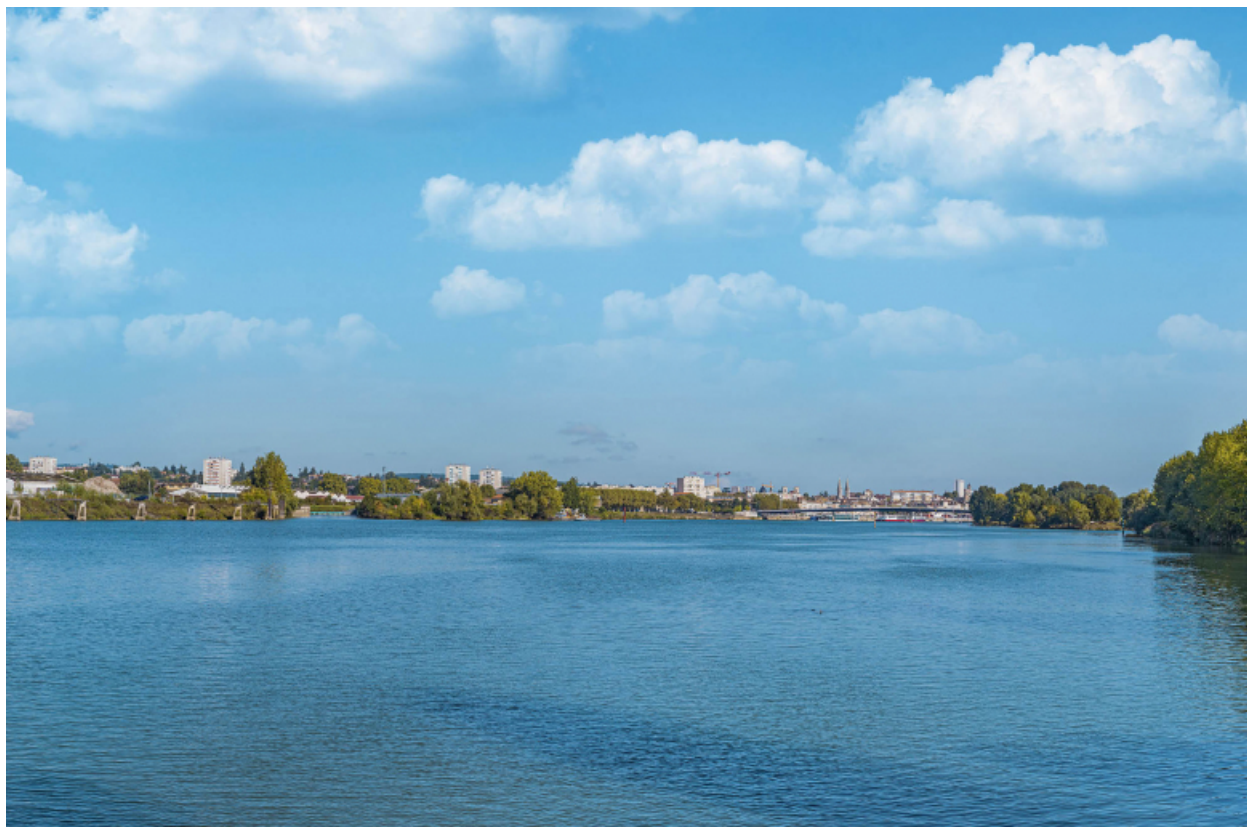
Accès à l'ancien port de commerce de Mâcon, vu depuis la rive gauche.

71, Mâcon rue de la Grosne, lieudit : PK 77