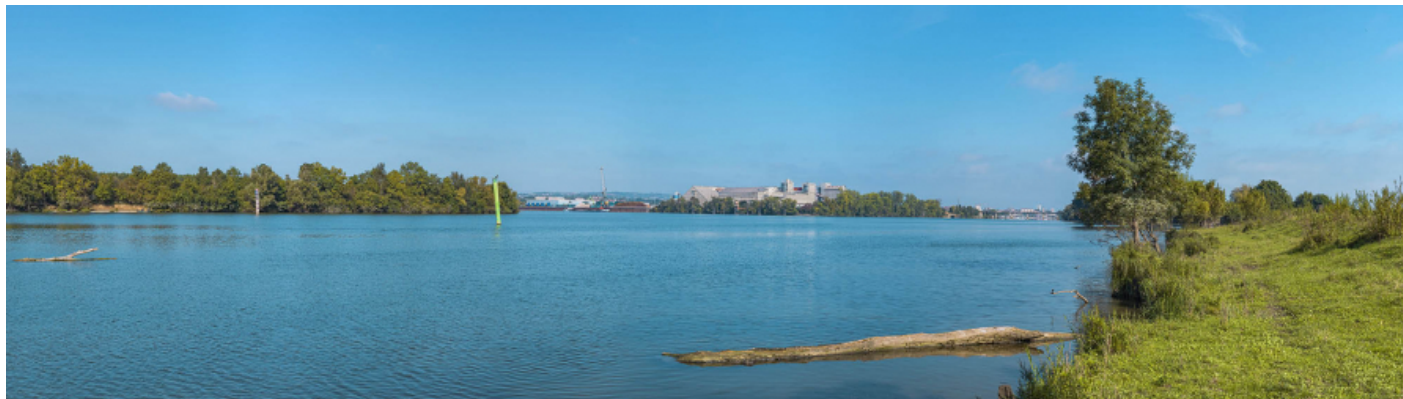
Le port de commerce de Mâcon vu depuis la rive gauche.

71, Mâcon rue de la Grosne, lieudit : PK 77