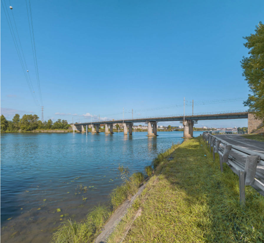
Le pont vu d'aval, rive gauche.