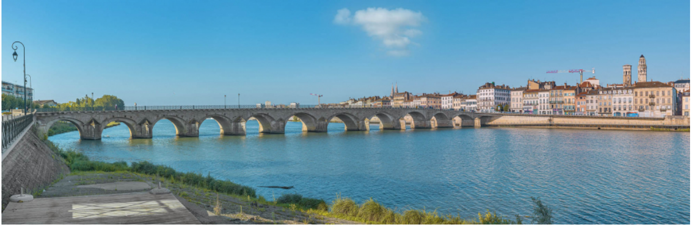
Le pont Saint-Laurent, vu d'amont, depuis la rive gauche.

71, Mâcon route départementale 1079, lieudit : PK 80,6