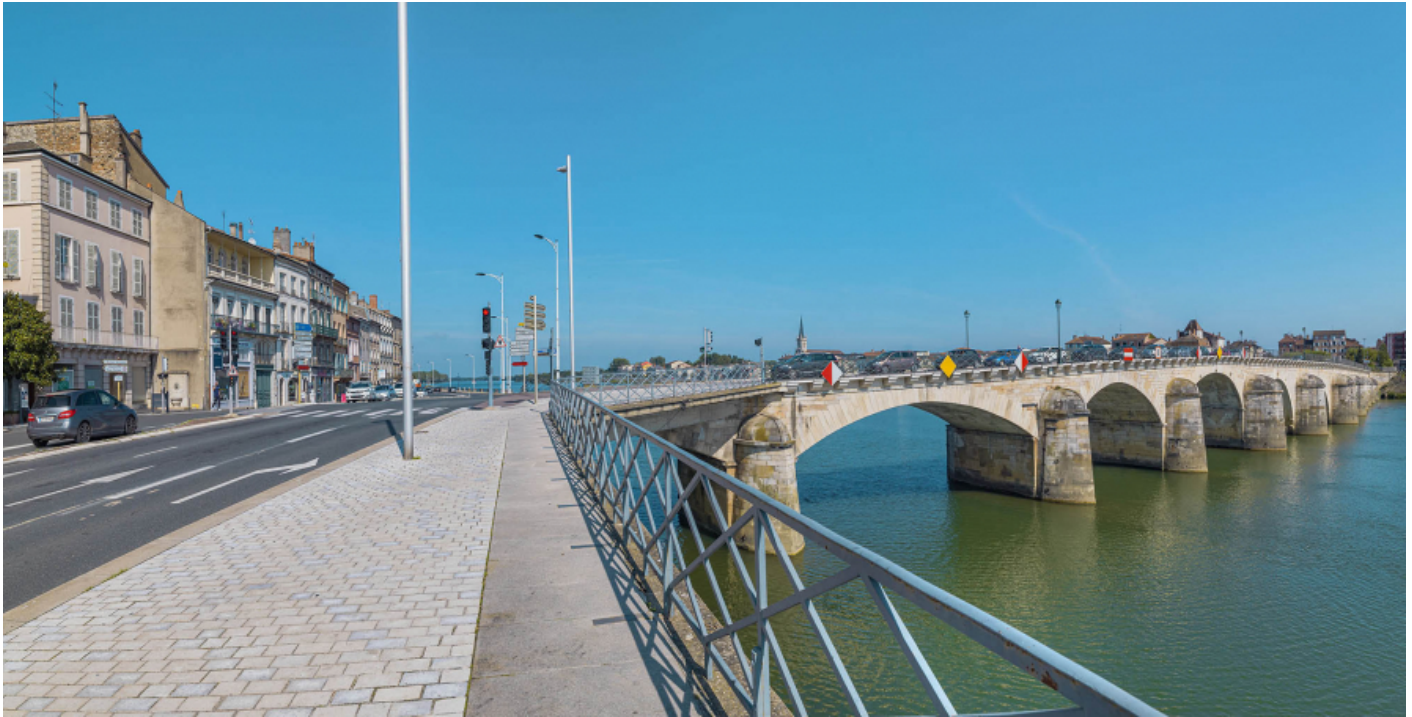
Le pont Saint-Laurent, vu d'aval, rive droite.

71, Mâcon route départementale 1079, lieudit : PK 80,6