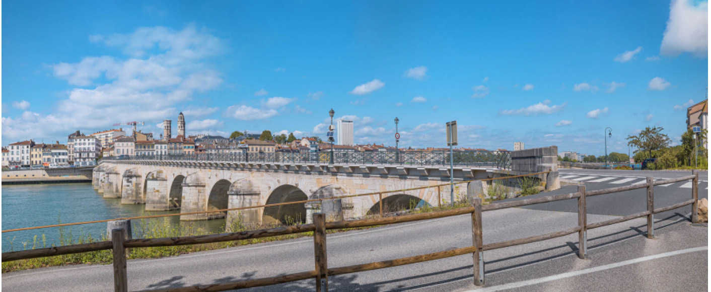
Vue d'ensemble du pont, d'aval et depuis la rive gauche.

71, Mâcon route départementale 1079, lieudit : PK 80,6