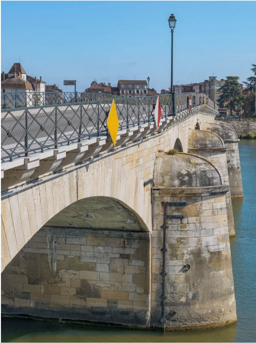
Détail des arrière-becs du pont.

71, Mâcon route départementale 1079, lieudit : PK 80,6