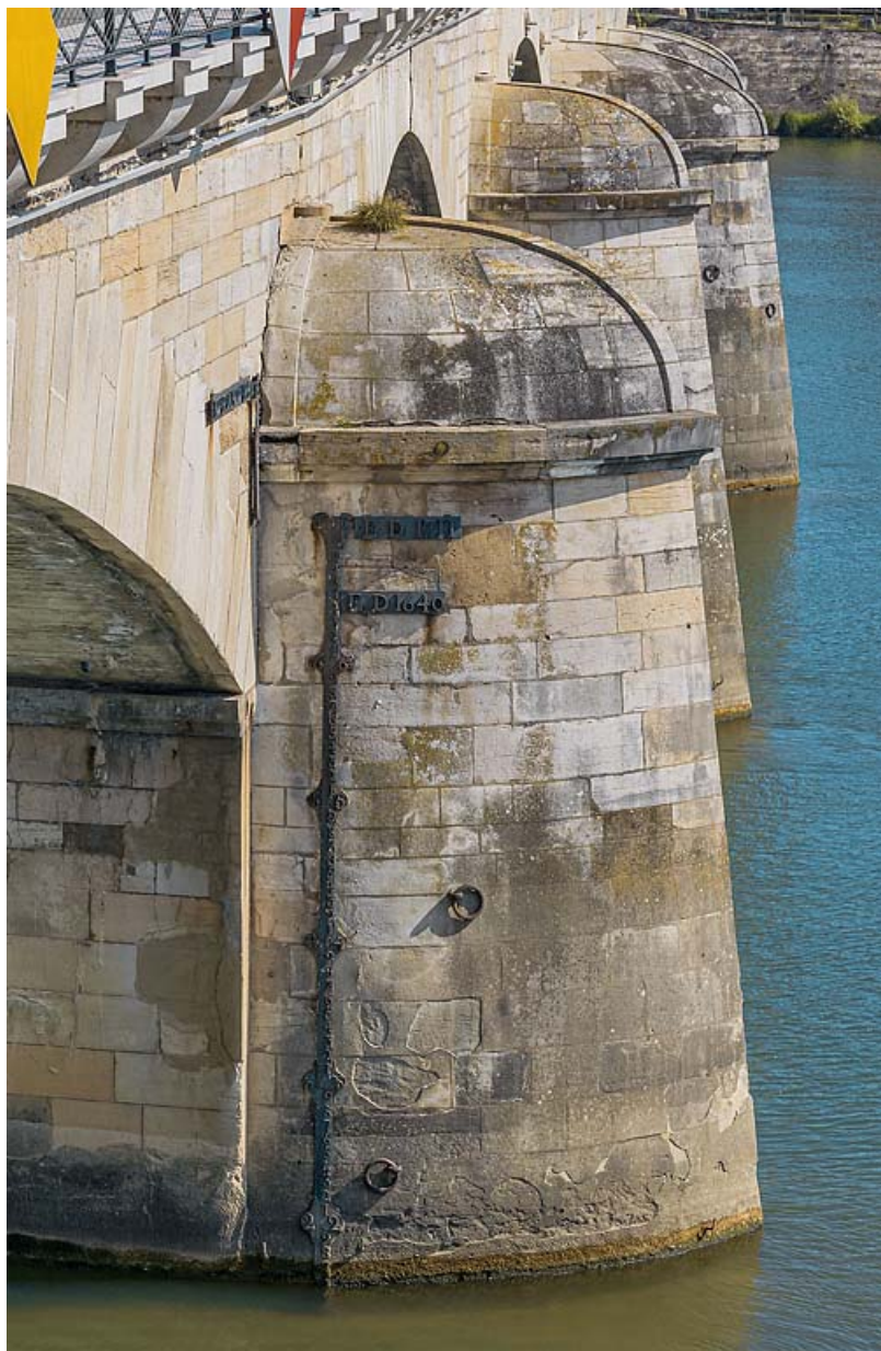
Détail des arrière-becs du pont et de l'échelle de crue.

71, Mâcon route départementale 1079, lieudit : PK 80,6