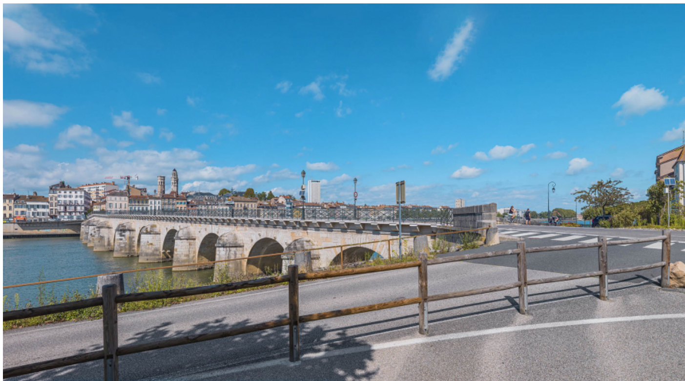
Vue d'ensemble du pont, d'aval et depuis la rive gauche.

71, Mâcon route départementale 1079, lieudit : PK 80,6