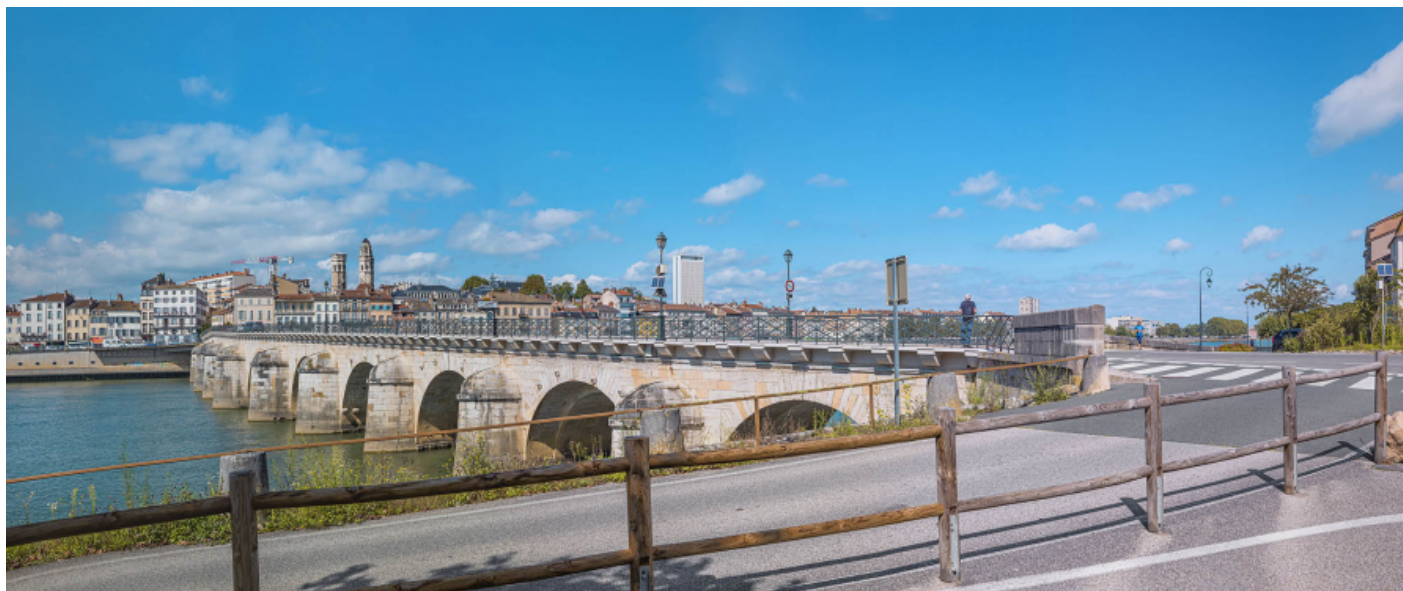
Vue d'ensemble du pont, d'aval et depuis la rive gauche.

71, Mâcon route départementale 1079, lieudit : PK 80,6