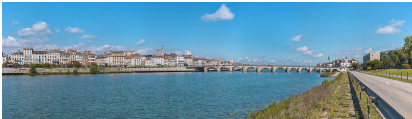
Vue d'ensemble du pont et des quais en aval, depuis la rive gauche.

71, Mâcon route départementale 1079, lieudit : PK 80,6