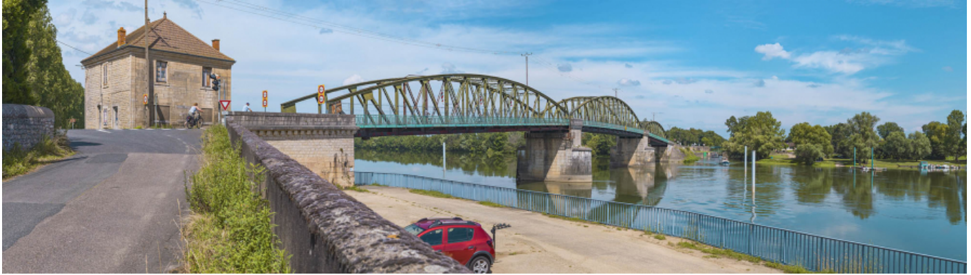
Le pont de Fleurville, vu d'aval, depuis la rive droite. La maison pontière se trouve au premier plan.

71, Montbellet route départementale 933A, lieudit : PK 97,45