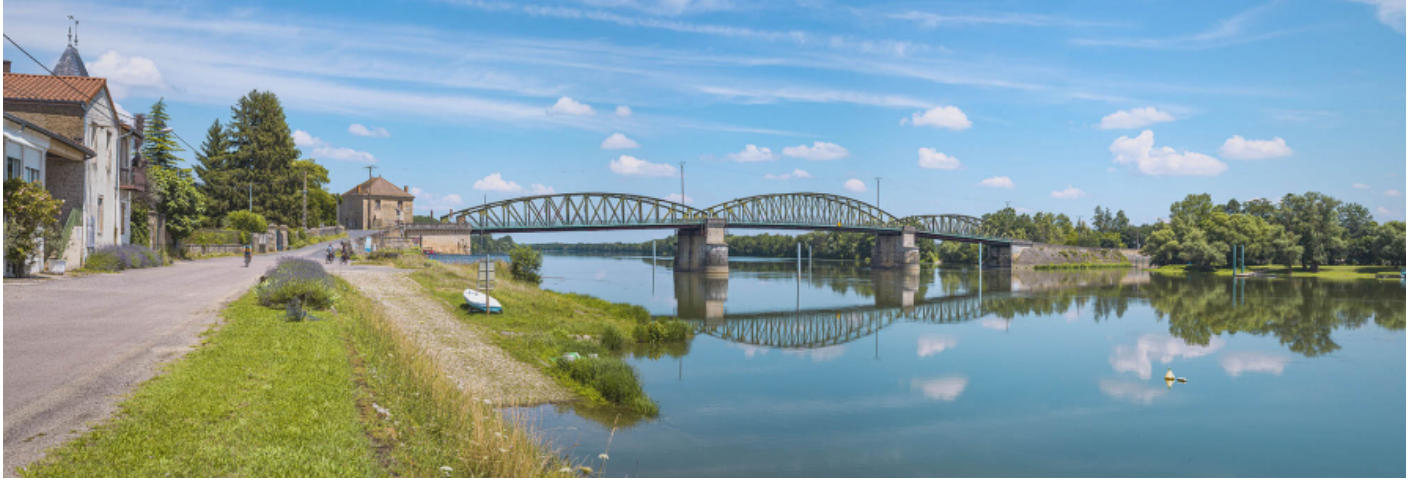
Le pont de Fleurville, vu d'aval, depuis la rive droite. Le port à gradins et la rampe se trouvent au premier plan.