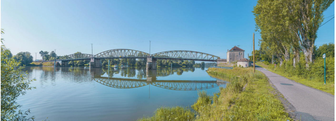
Le pont de Fleurville, vu d'amont, depuis la rive droite.

71, Montbellet route départementale 933A, lieudit : PK 97,45