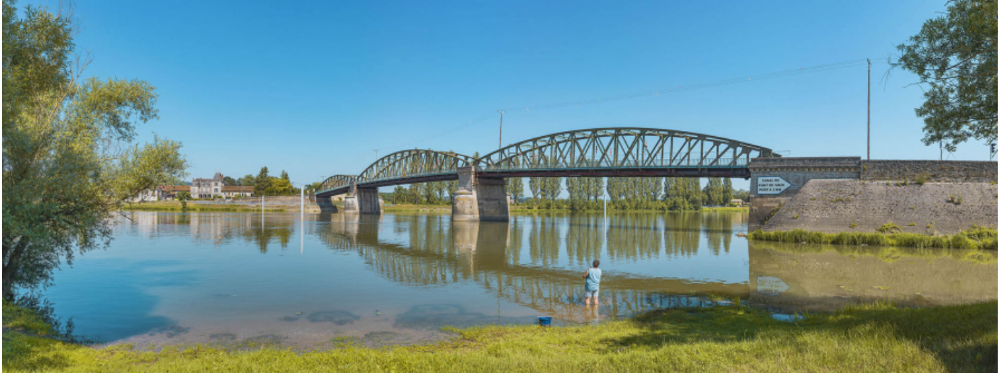
Le pont de Fleurville, vu d'aval, depuis la rive gauche.

71, Montbellet route départementale 933A, lieudit : PK 97,45