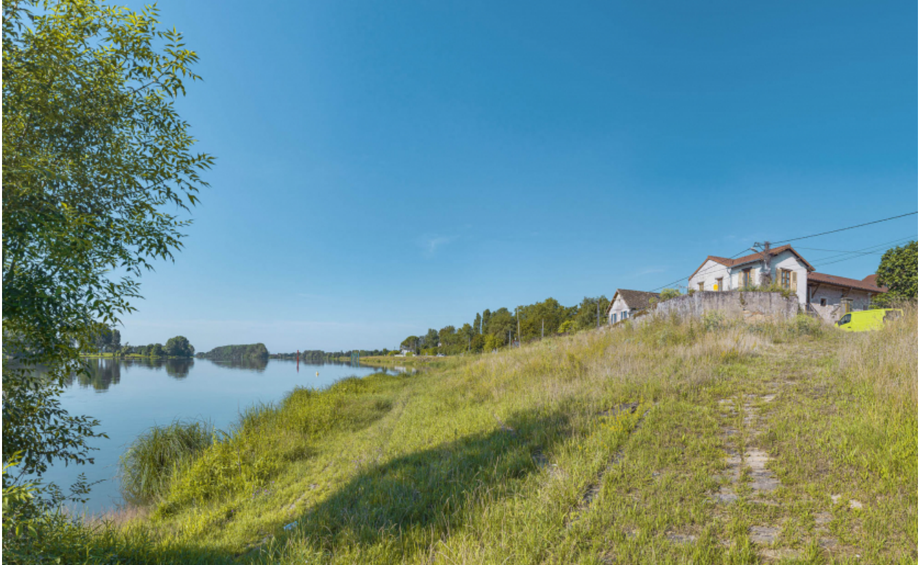
Les gradins du port de Fleurville recouverts par la végétation, rive droite.

71, Montbellet route départementale 933A, lieudit : PK 97,45