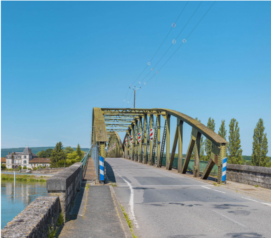
Le pont de Fleurville, depuis la rive gauche.

71, Montbellet route départementale 933A, lieudit : PK 97,45