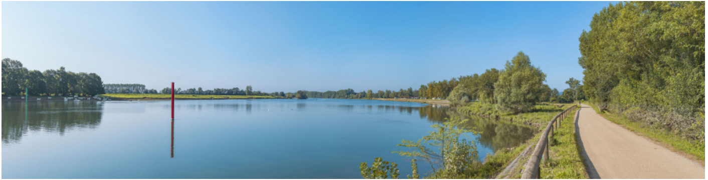
Le port d'Uchizy, vu d'amont. A droite, le chemin de halage/véloroute. 71, Uchizy, lieudit : PK 102,5