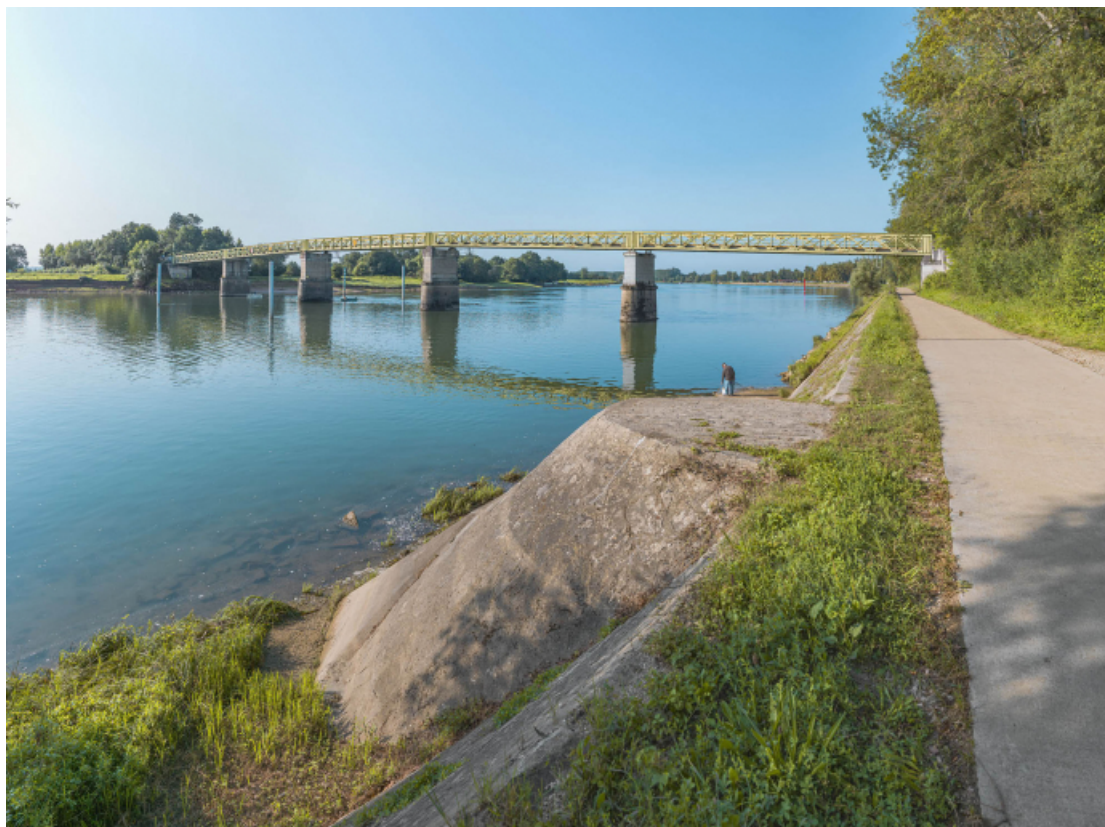
Vue d'ensemble du pont d'amont et depuis la rive droite. Perrés et rampe au premier plan.

71, Uchizy route départementale 163, lieudit : PK 103,2