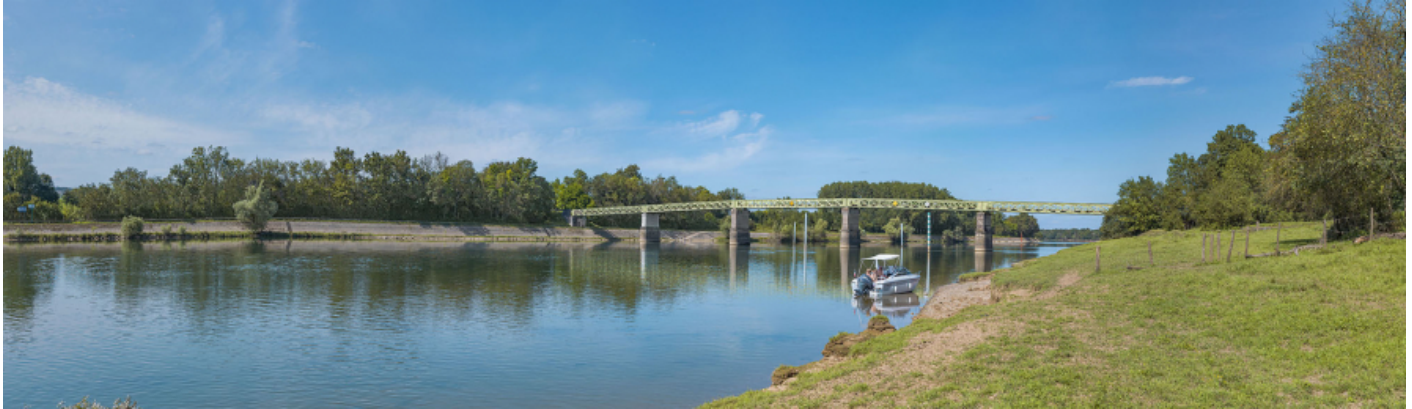
Le pont vu d'aval depuis la rive gauche.

71, Uchizy route départementale 163, lieudit : PK 103,2