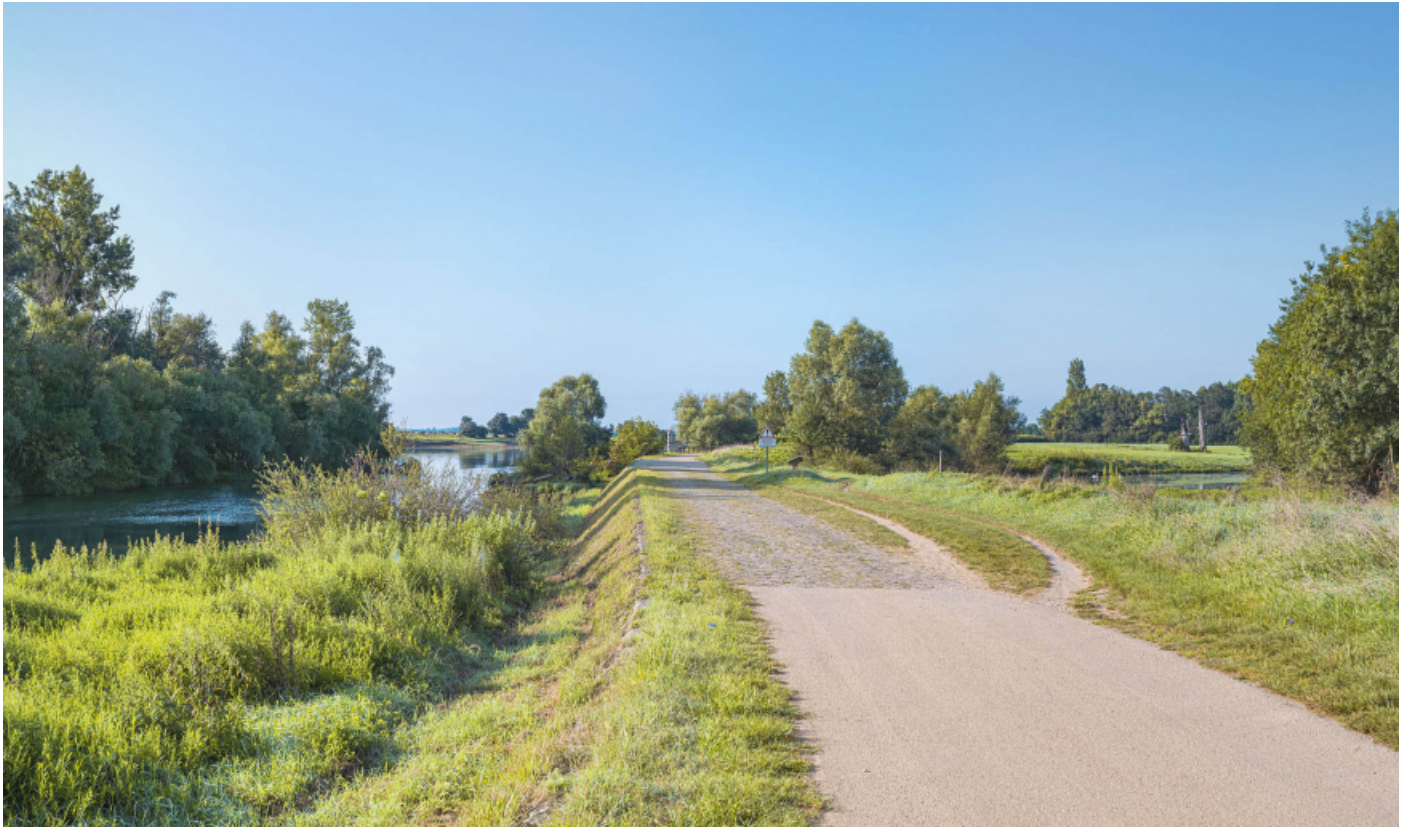
Le passage de l'île d'Uchizy, en amont du pont, rive droite. À gauche, la Saône et à droite, la lône.

71, Uchizy route départementale 163, lieudit : PK 103,2