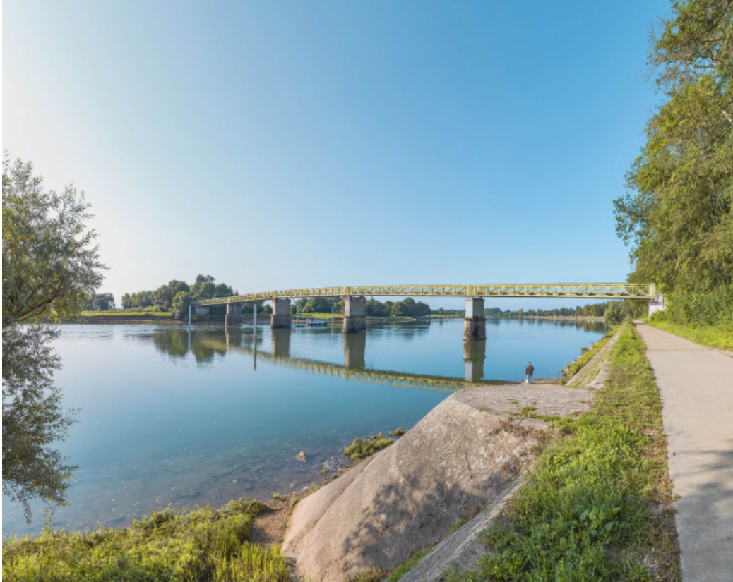
Vue d'ensemble du pont d'amont et depuis la rive droite. Perrés et rampe au premier plan.

71, Uchizy route départementale 163, lieudit : PK 103,2