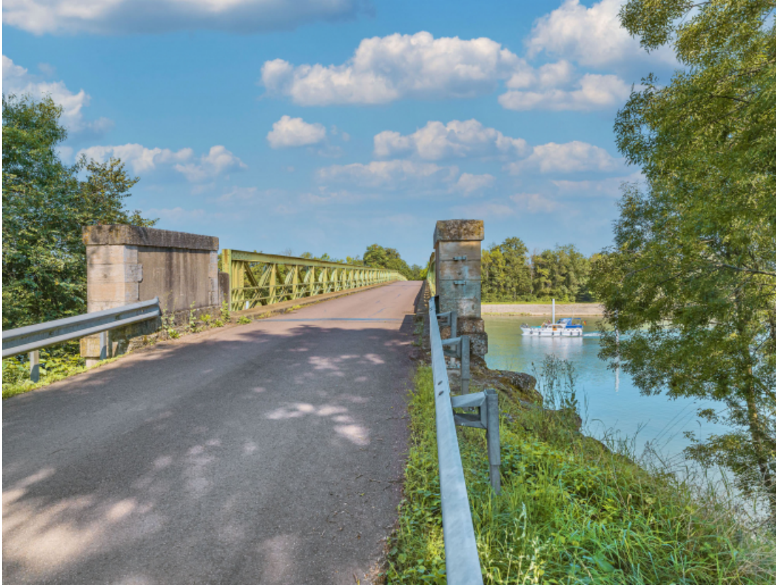
Vue du dessus du pont, rive gauche.

71, Uchizy route départementale 163, lieudit : PK 103,2