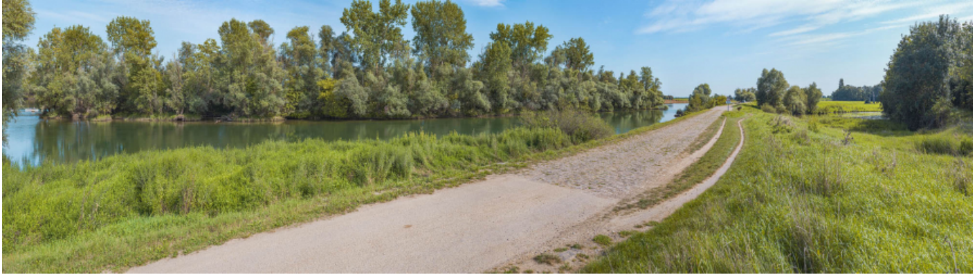
Le passage de l'île d'Uchizy, en amont du pont, rive droite. À gauche, la Saône et à droite, laône.

71, Uchizy route départementale 163, lieudit : PK 103,2