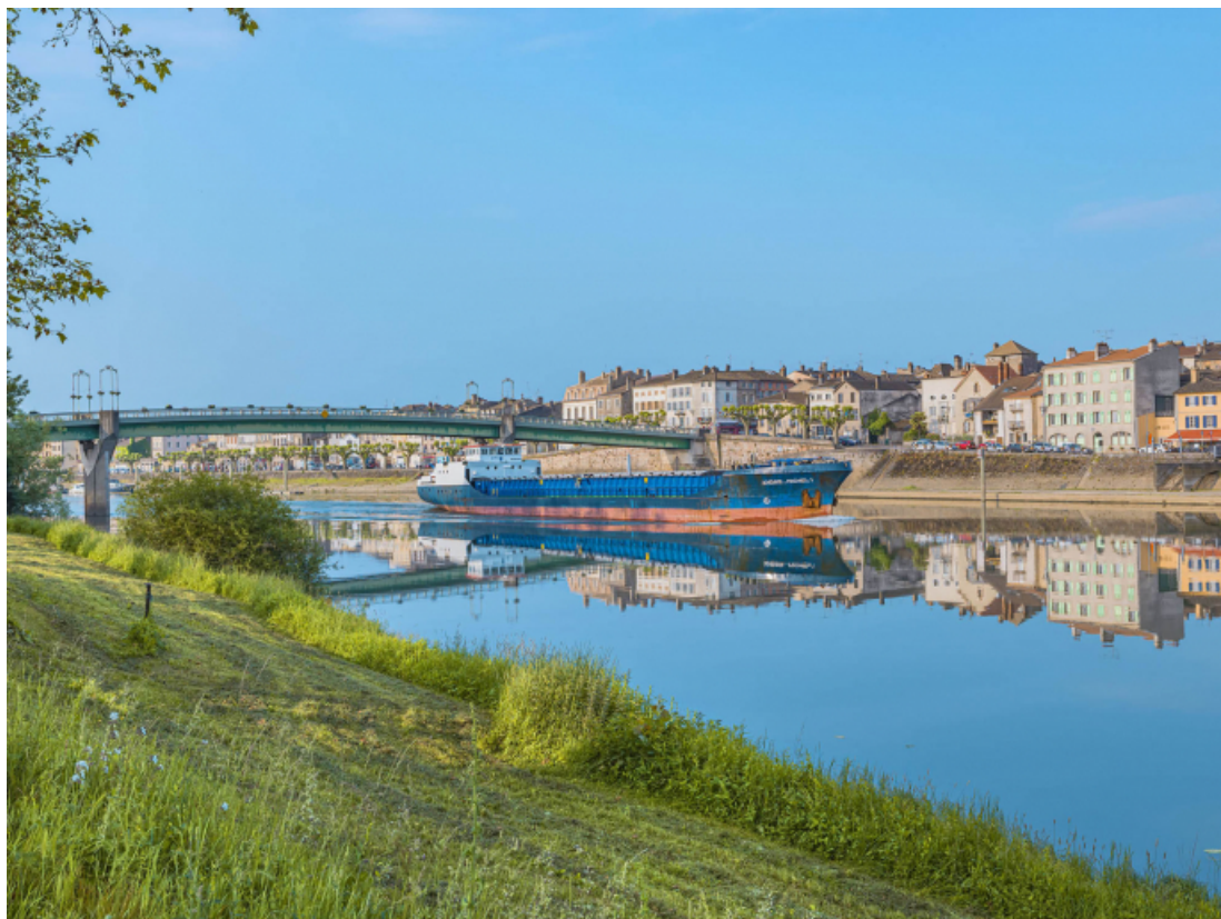
Le pont de Tournus, vu d'amont, depuis la rive gauche.

71, Tournus rue Jean Jaurès, lieudit : PK 110,9