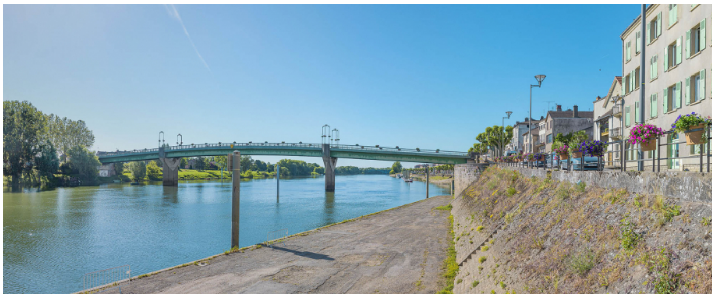
Le pont de Tournus, vu d'amont, rive droite.

71, Tournus rue Jean Jaurès, lieudit : PK 110,9