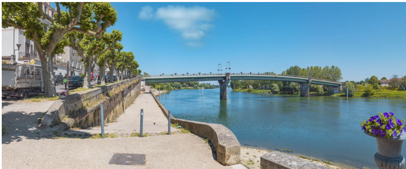
Le pont de Tournus, vu d'aval, au niveau de la banquette de halage.

71, Tournus rue Jean Jaurès, lieudit : PK 110,9