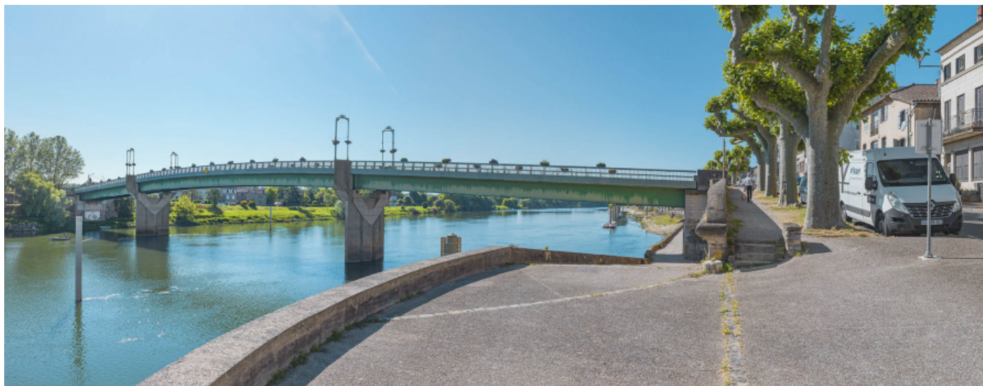
Le pont de Tournus, vu d'amont, rive droite.

71, Tournus rue Jean Jaurès, lieudit : PK 110,9