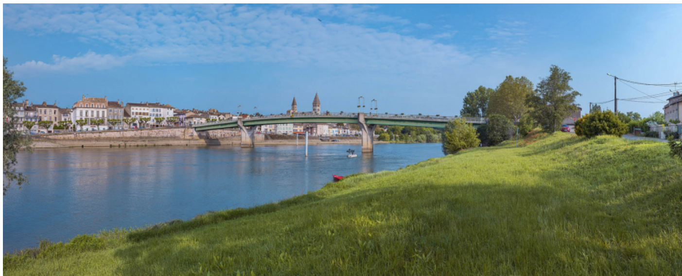
Le pont de Tournus, vu d'aval, depuis la rive gauche.

71, Tournus rue Jean Jaurès, lieudit : PK 110,9