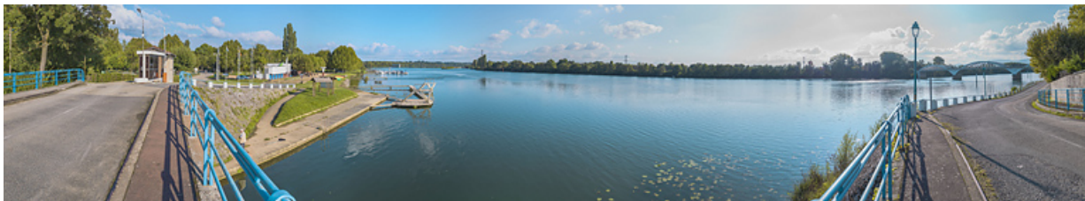
La Saône à la hauteur de Thoissey : à gauche, le barrage de Dracé et à droite, le pont de Thoissey.