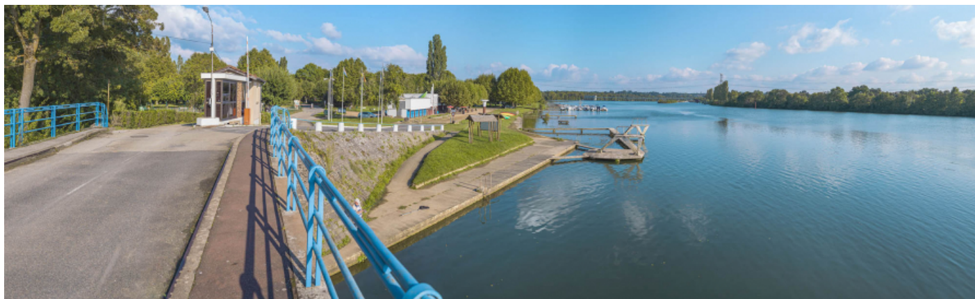
La Saône à hauteur du pont sur la Chalaronne (rive gauche). On distingue le barrage de Dracé en arrière-plan.