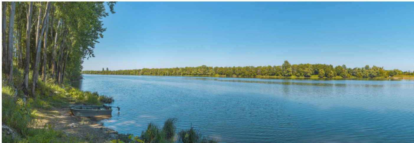
Confluence avec la Seille (au niveau du PK 106).