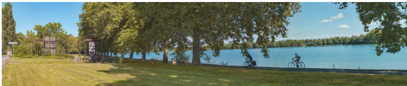
Les vestiges du barrage de Thoisy à Mâcon, au niveau du Parc Nord.