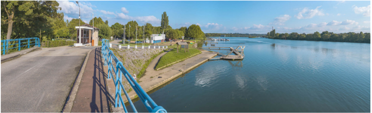
La Saône à hauteur du pont sur la Chalaronne (rive gauche). On distingue le barrage de Dracé en arrière-plan. 71, Ormes, lieudit : PK 119