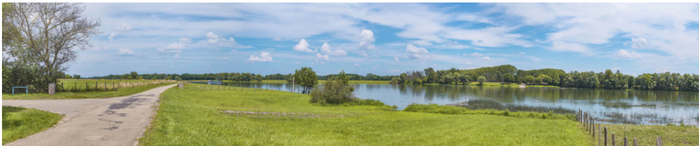
Véloroute et ancien passage de Port-Celet : rampe d'accès au bac à traile.