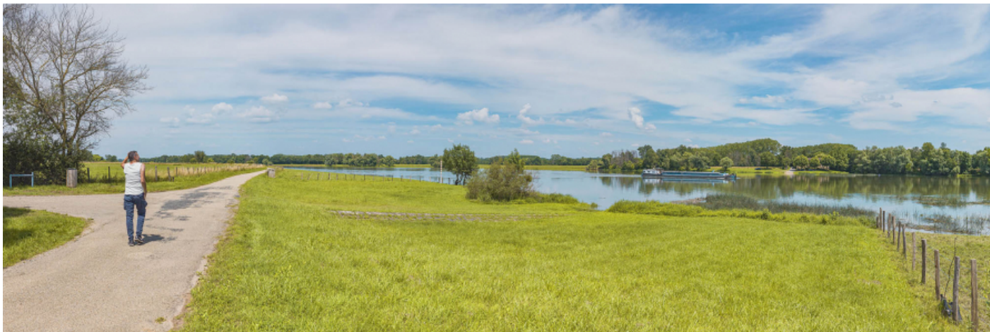
Véloroute et ancien passage de Port-Celet : rampe d'accès au bac à traile.