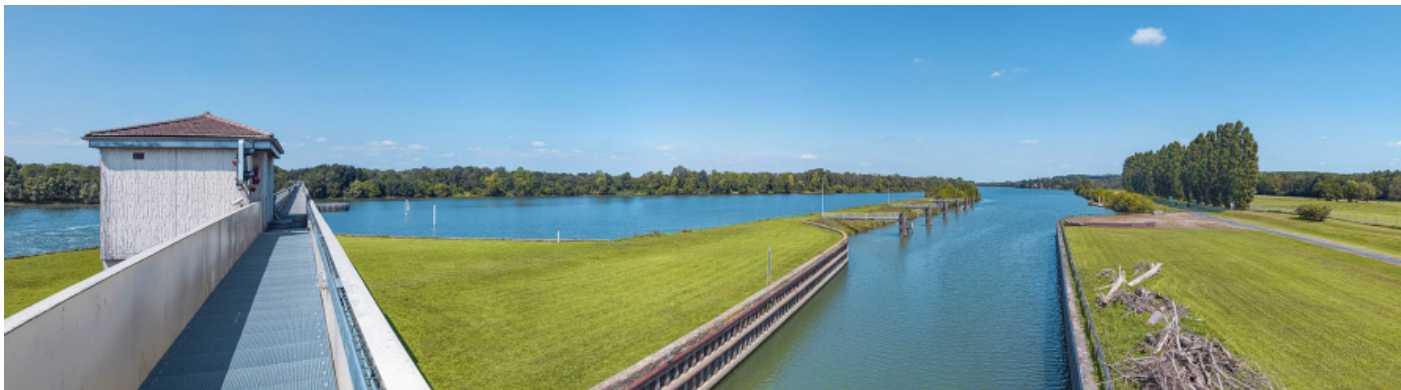
L'amont du sas vu depuis la passerelle du barrage.

71, Ormes rue du Sablé, lieudit : PK 119