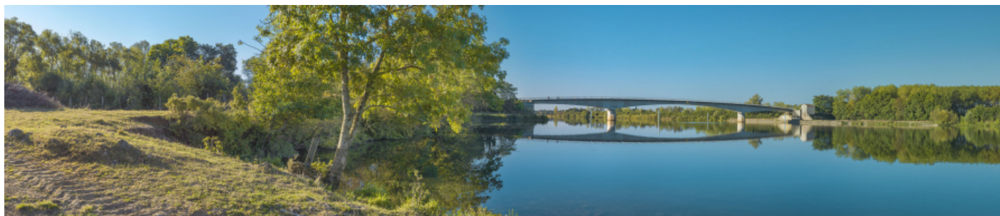
Vue d'ensemble du pont de Thorey depuis la rive gauche.