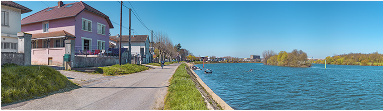
Le quai avec la rampe de mise à l'eau et ses perrés.