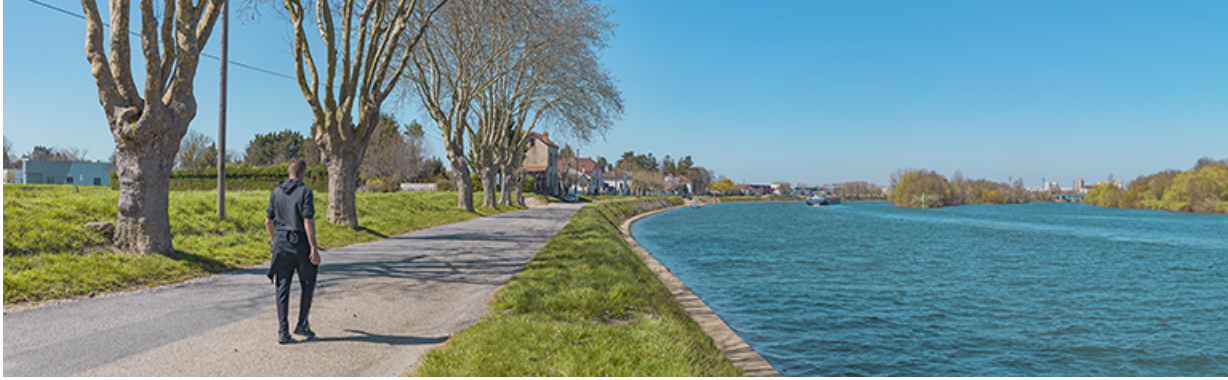
Le quai Bellevue et les îles de Benne-la-Faux.