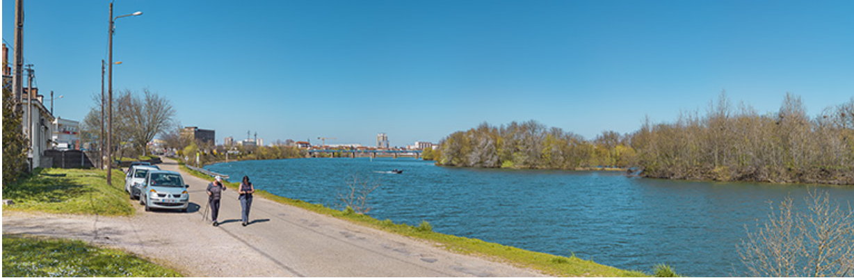
L'amont du quai avec en arrière-plan, le viaduc des Dombes. À droite, les îles de Benne-la-Faux dans la Saône. 71, Saint-Rémy quai Bellevue