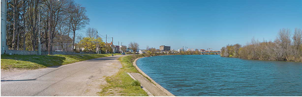
Les perrés du quai, avec en arrière-plan, le viaduc des Dombes.