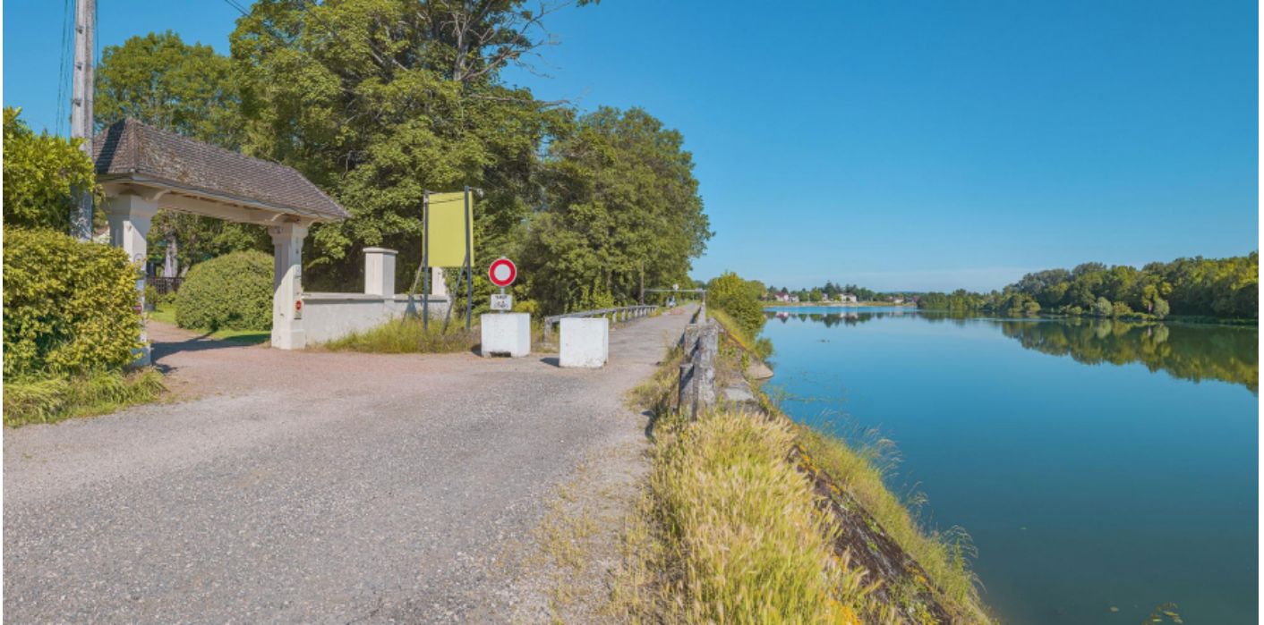
Extrémité aval du quai avec le pont sur la Roie de Droux.