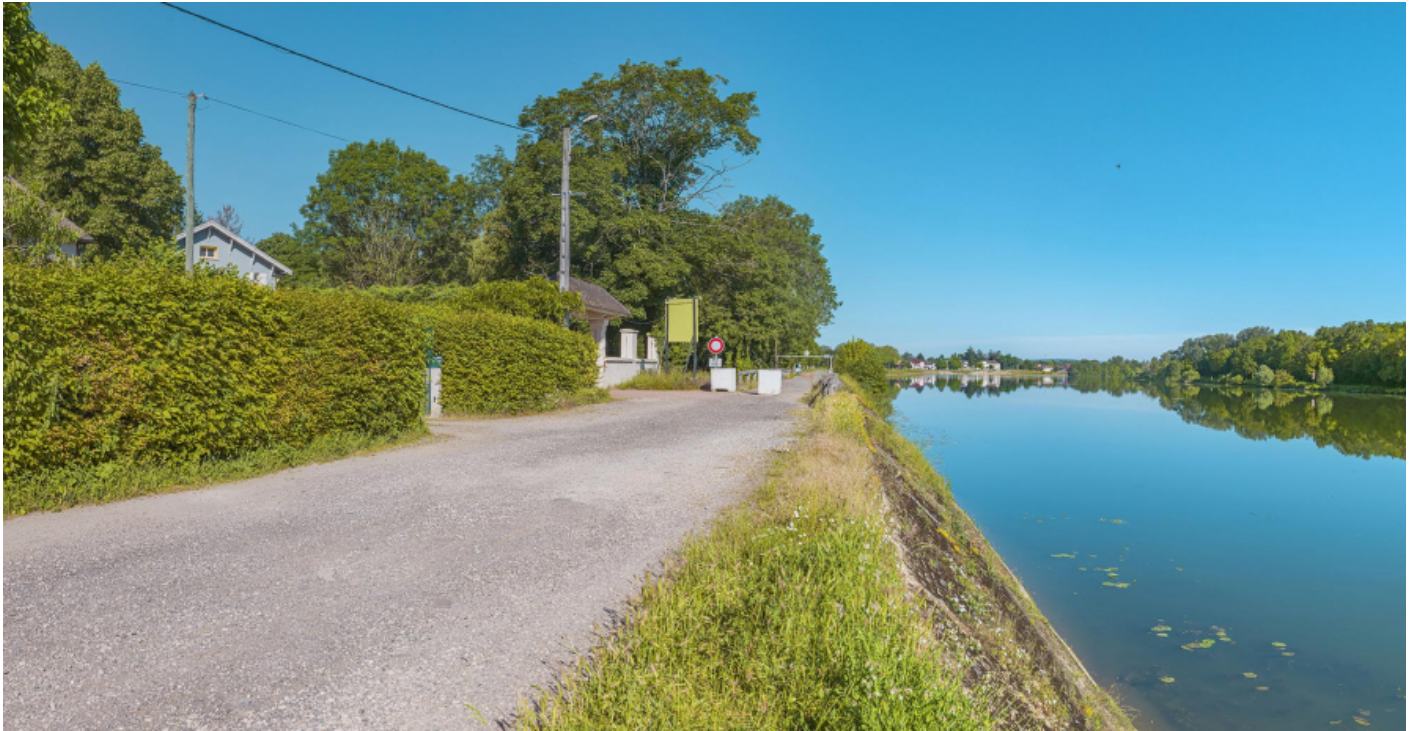
Extrémité aval du quai avec le pont sur la Roie de Droux.