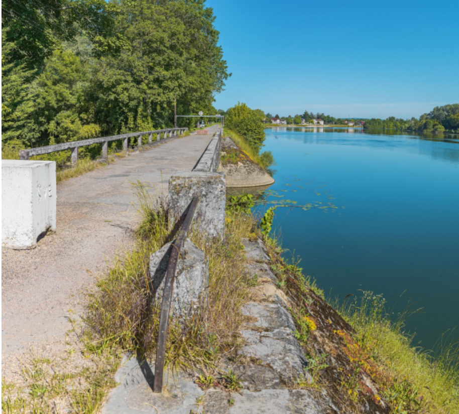
Pont sur la Roie de Droux.