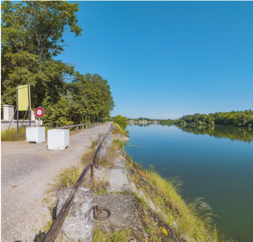
Extrémité aval du quai avec le pont sur la Roie de Droux.