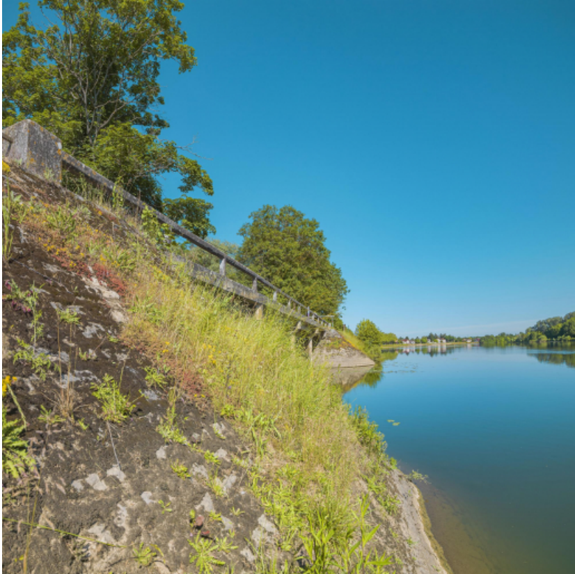
Le pont sur la Roie de Droux.