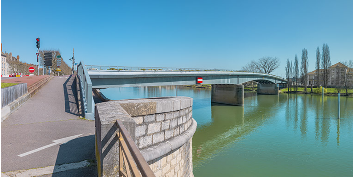
Vue d'ensemble du pont, prise d'aval. Au premier plan : la banquette de halage. 71, Chalon-sur-Saône route nationale 73, lieudit : PK 141.2