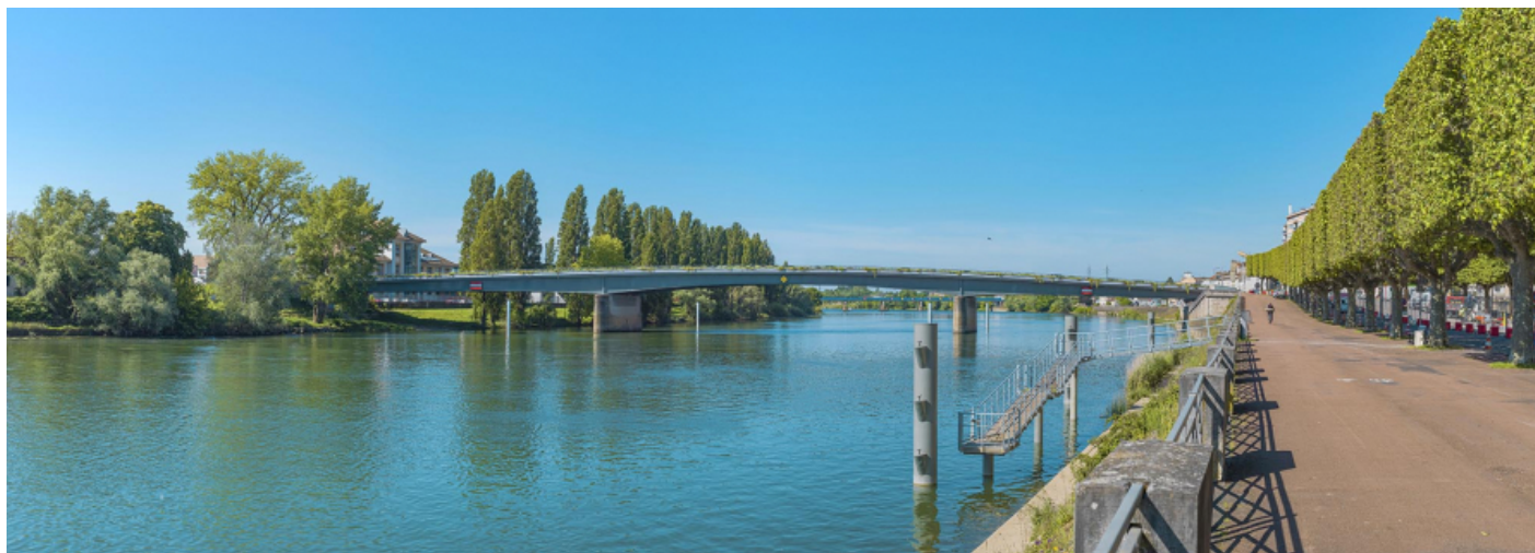
Vue d'ensemble du pont Jean-Richard depuis l'amont, au niveau du quai Gambetta.

71, Chalon-sur-Saône route nationale 73, lieudit : PK 141.2