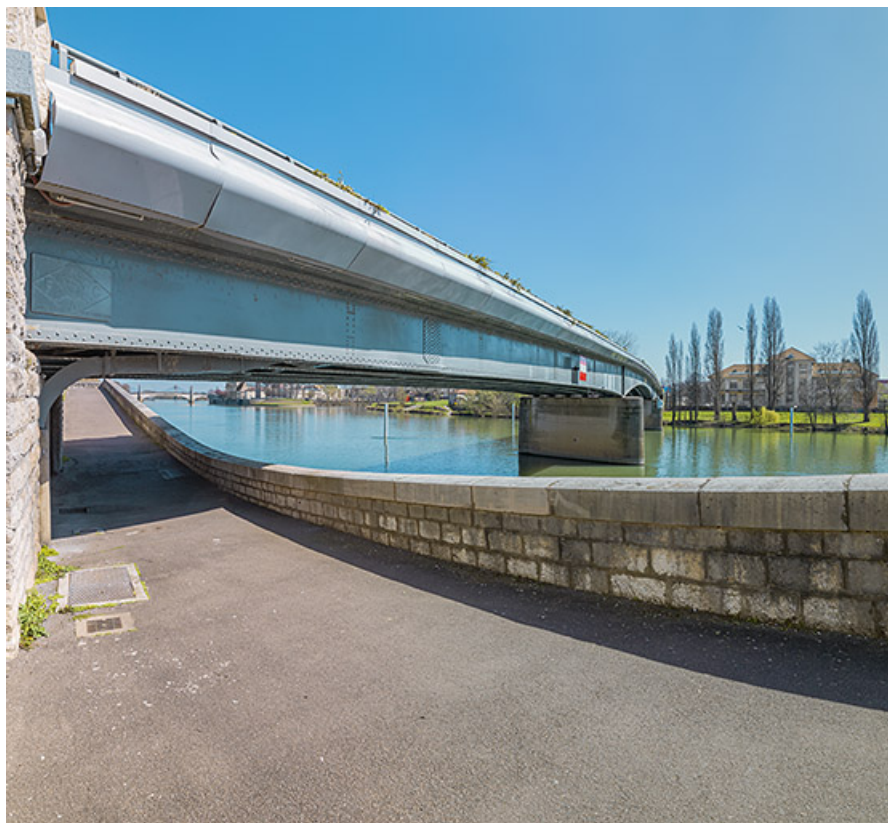
Tablier du pont vu depuis la banquette de halage.

71, Chalon-sur-Saône route nationale 73, lieudit : PK 141.2