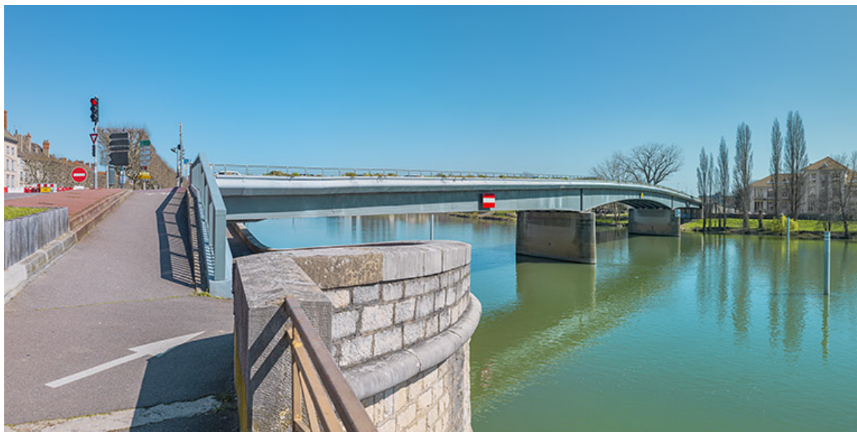
Vue d'ensemble du pont, prise d'aval. Au premier plan : la banquette de halage.

71, Chalon-sur-Saône route nationale 73, lieudit : PK 141.2