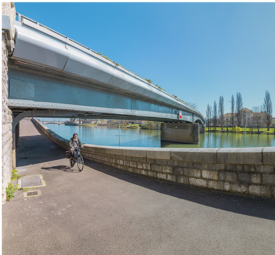
Tablier du pont vu depuis la banquette de halage.

71, Chalon-sur-Saône route nationale 73, lieudit : PK 141.2