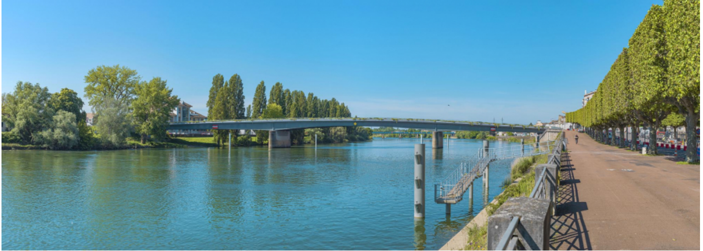
Vue d'ensemble du pont Jean-Richard depuis l'amont, au niveau du quai Gambetta.

71, Chalon-sur-Saône route nationale 73, lieudit : PK 141.2