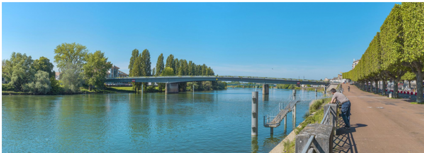
Vue d'ensemble du pont Jean-Richard depuis l'amont, au niveau du quai Gambetta.

71, Chalon-sur-Saône route nationale 73, lieudit : PK 141.2