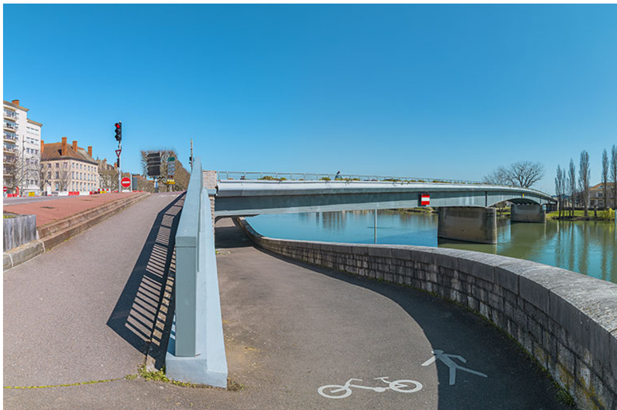
Vue d'ensemble du pont depuis l'aval et la banquette de halage.

71, Chalon-sur-Saône route nationale 73, lieudit : PK 141.2