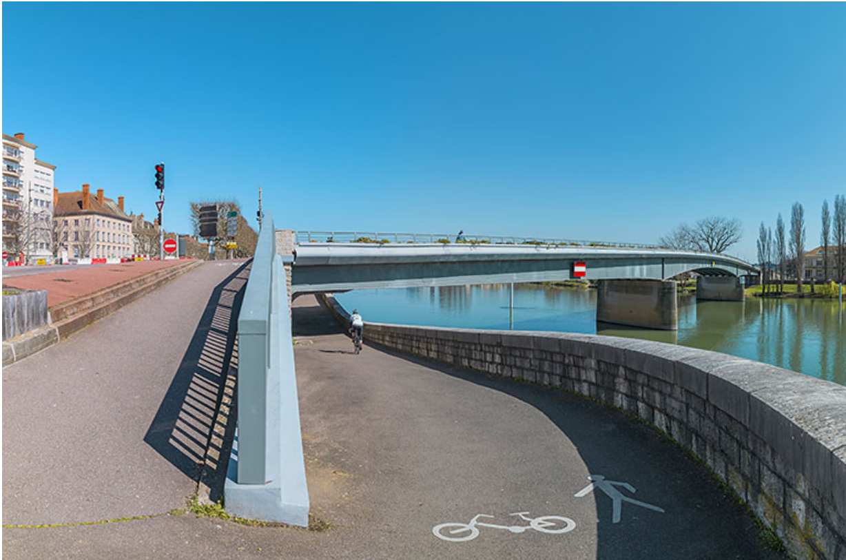
Vue d'ensemble du pont depuis l'aval et la banquette de halage.

71, Chalon-sur-Saône route nationale 73, lieudit : PK 141.2