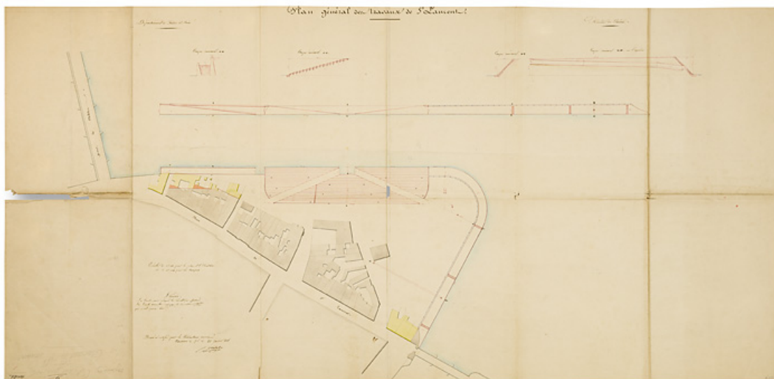
Plan général des travaux de St Laurent. Par Pretet (conducteur des Ponts et Chaussées). Dessin, 22 janvier 1845. 71, Chalon-sur-Saône quai de la Monnaie

Plan général des travaux de St Laurent. Dessin, 22 janvier 1845, 128,2 x 62,3 cm. Par Pretet (conducteur des Ponts et Chaussées). Archives départementales de la Saône-et-Loire, Mâcon. 3 S 43.