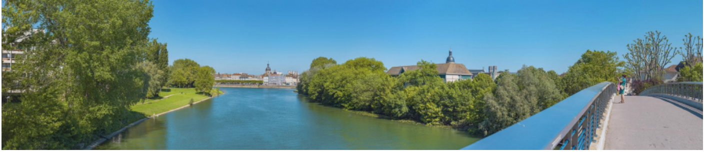
La ville de Chalon-sur-Saône vue depuis la passerelle Pierre-Soubrane. 71, Chalon-sur-Saône avenue de Verdun