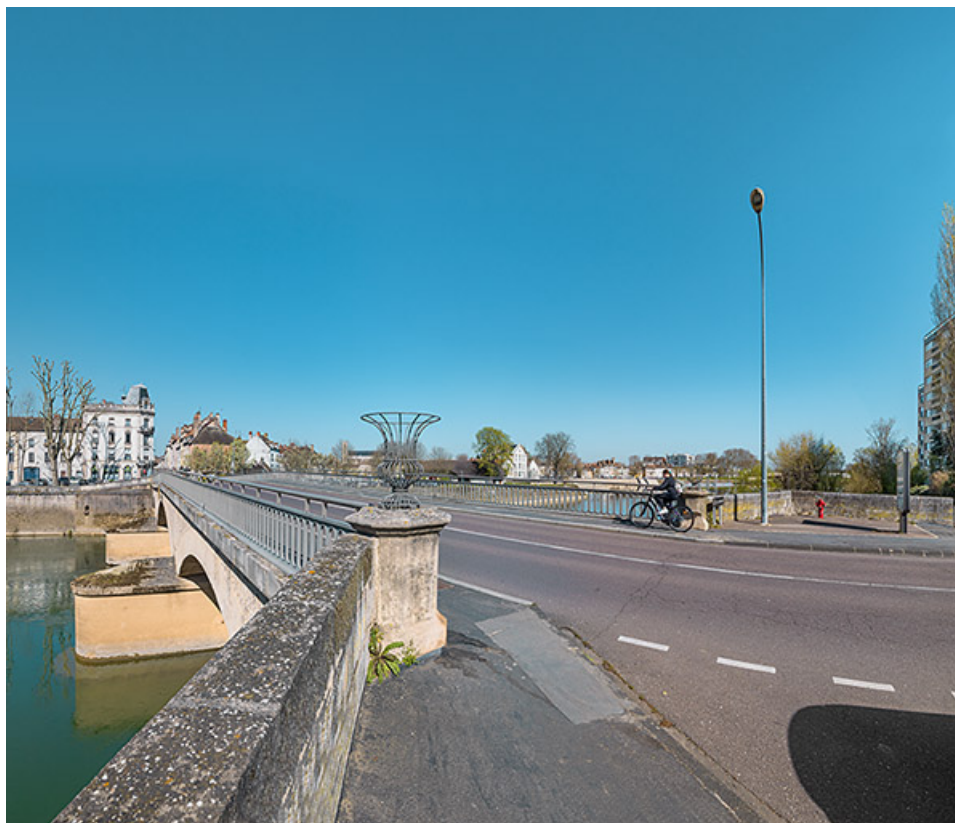
Vue d'ensemble du pont depuis la chaussée.