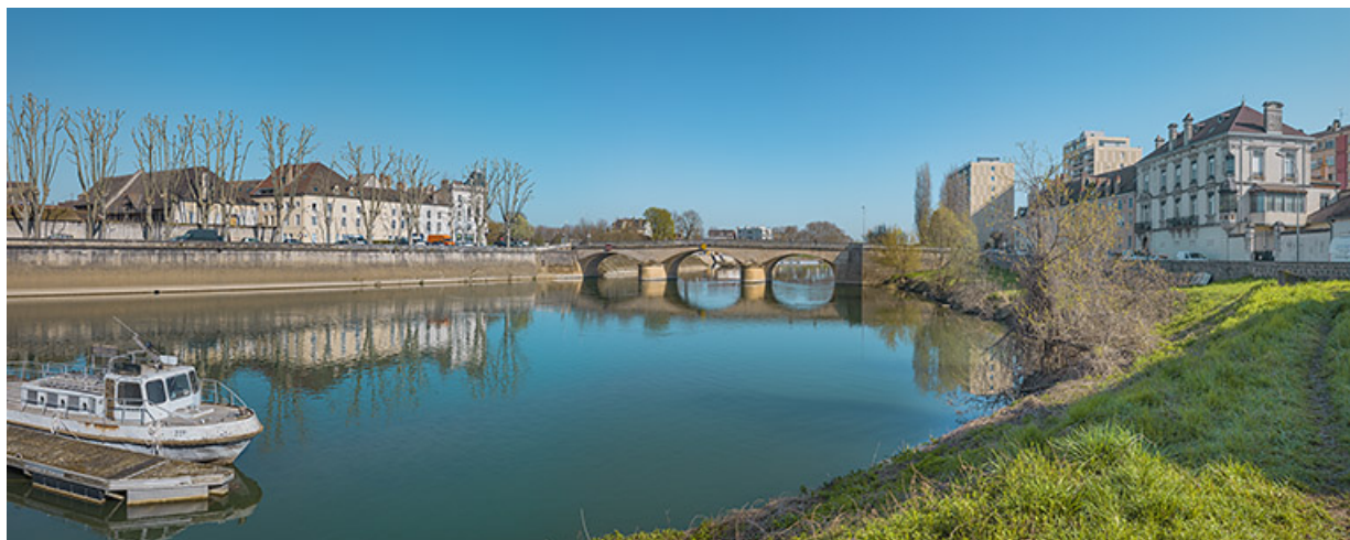
Vue d'ensemble depuis le port de plaisance.