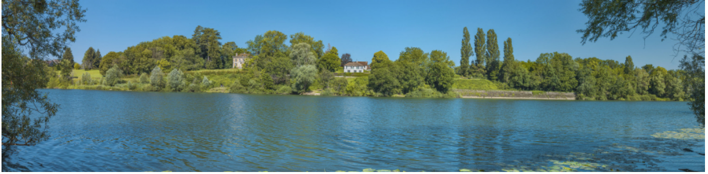
Vue d'ensemble de la banquette de halage et du mur de soutènement, depuis la rive gauche.