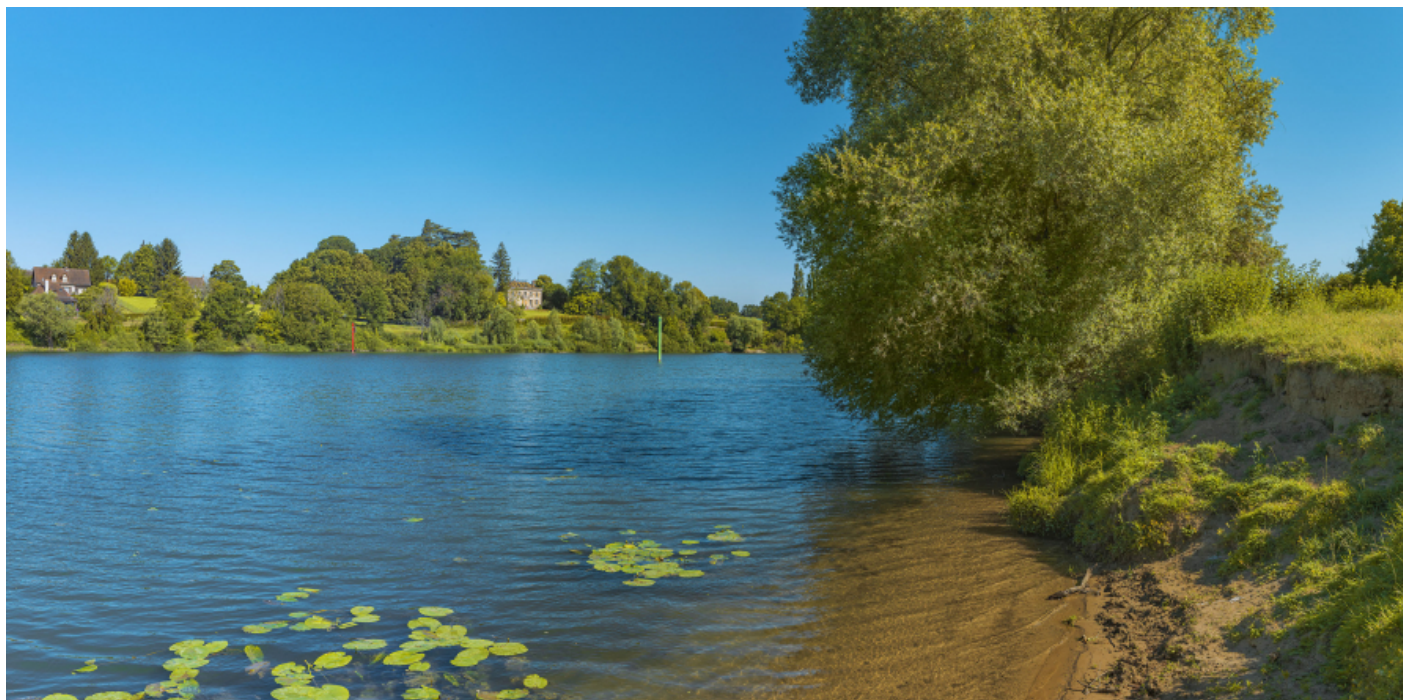
Raconnay, depuis la rive gauche de la Saône.