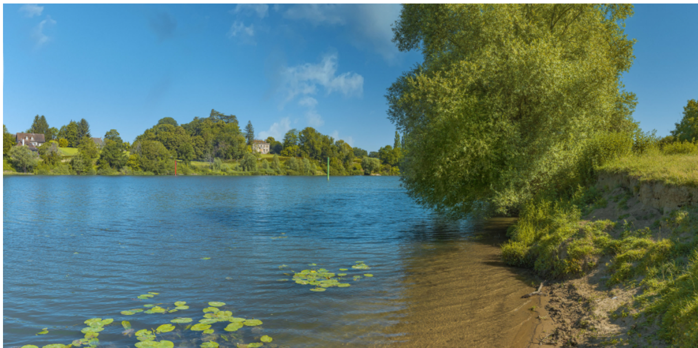
Raconnay, depuis la rive gauche de la Saône.