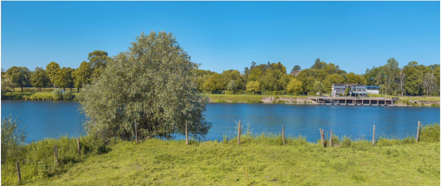
Le port de Gergy depuis la rive opposée.