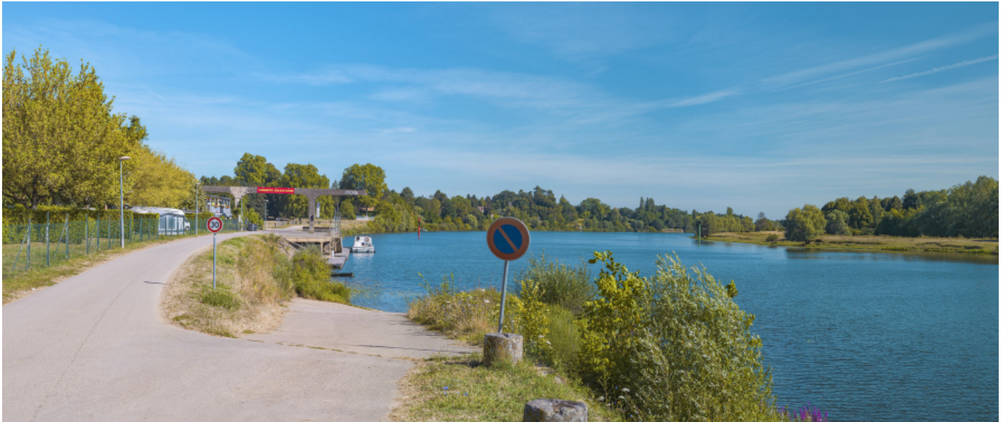
Vue d'ensemble du port de Gergy, depuis la rampe aval.