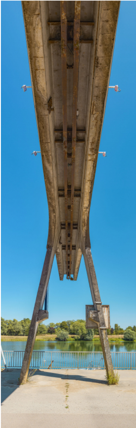
Portique de déchargement avec poulie.