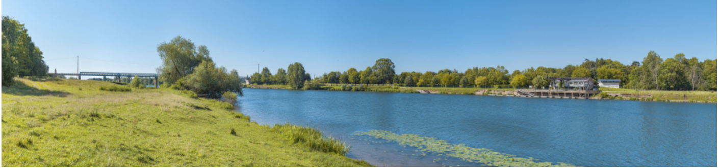
Le port de Gergy depuis la rive opposée. En arrière-plan, le pont Boucicaut.