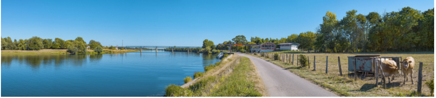
Le port de Gergy, vu d'amont. Le pont Boucicaut en arrière-plan.