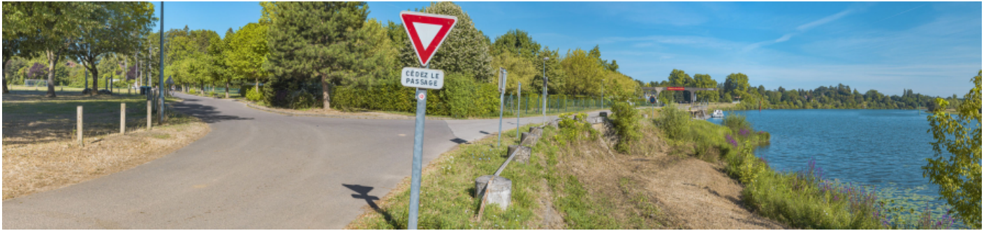
Vue d'ensemble du site du port de Gergy depuis la rampe aval.