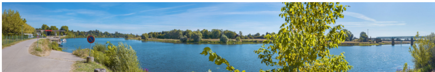
Vue panoramique avec de gauche à droite : le port de Gergy et le pont Boucicaut.