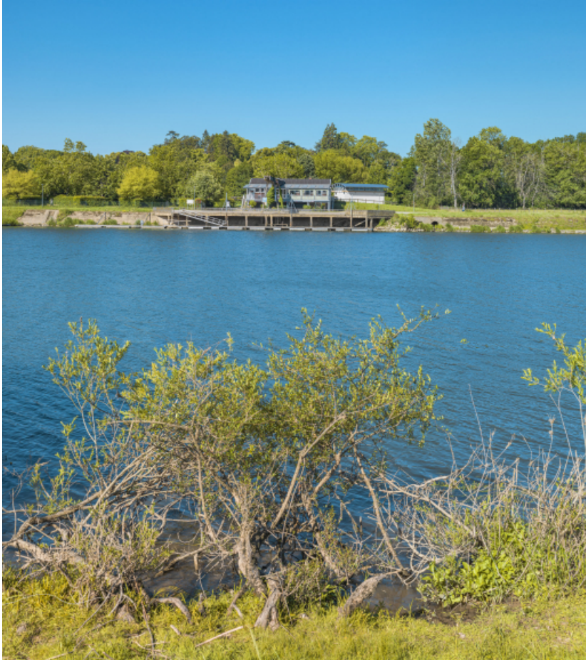
Le port de Gergy depuis la rive opposée.