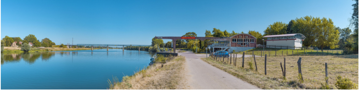
Le port de Gergy, vu d'amont. Le pont Boucicaut en arrière-plan.