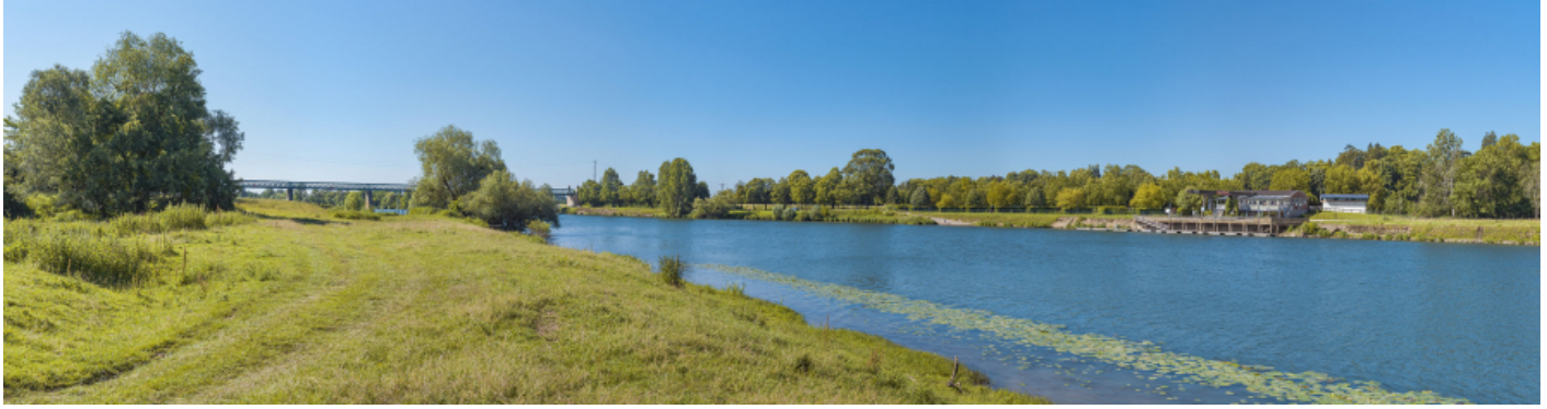
Le port de Gergy depuis la rive opposée. En arrière-plan, le pont Boucicaut.