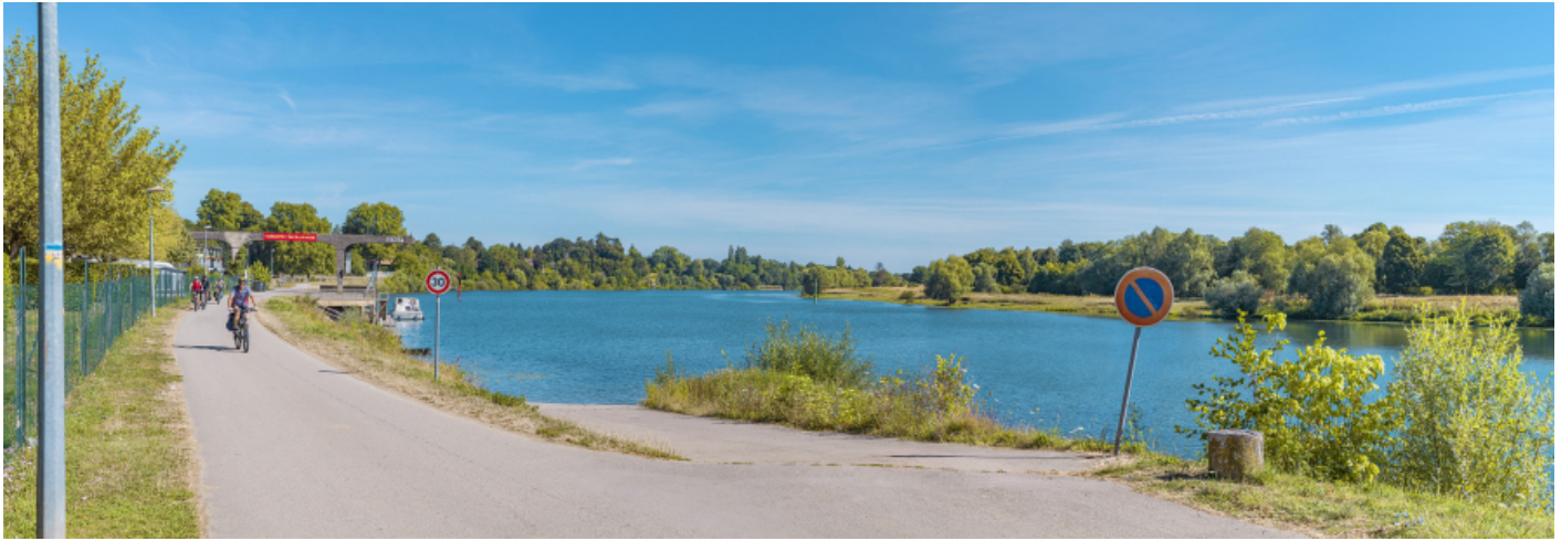
Vue d'ensemble du port de Gergy, depuis la rampe aval.