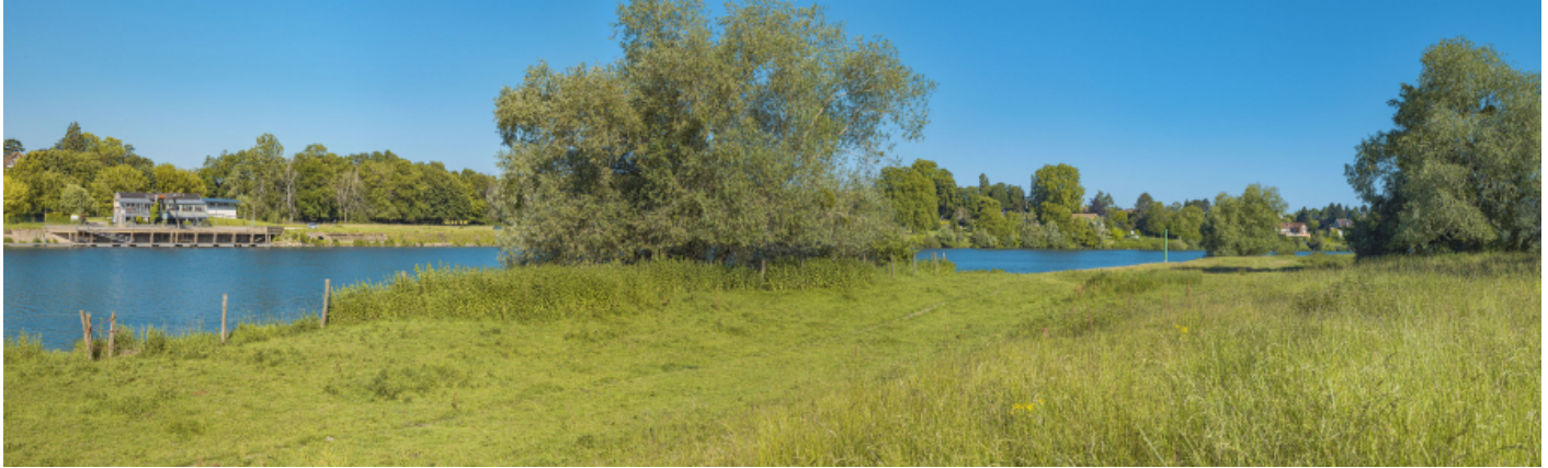
Le port de Gergy depuis la rive opposée.