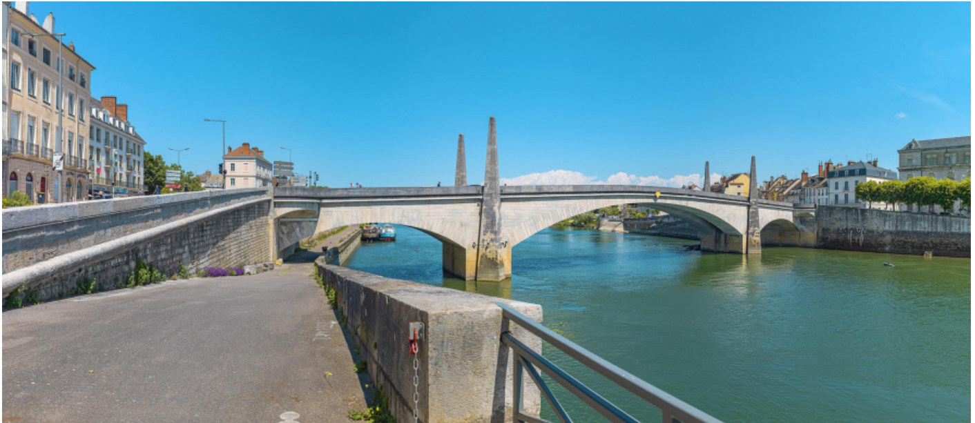
Vue d'ensemble du pont, depuis la banquette de halage aval. 71, Chalon-sur-Saône route départementale 19, lieu dit : PK 141.83