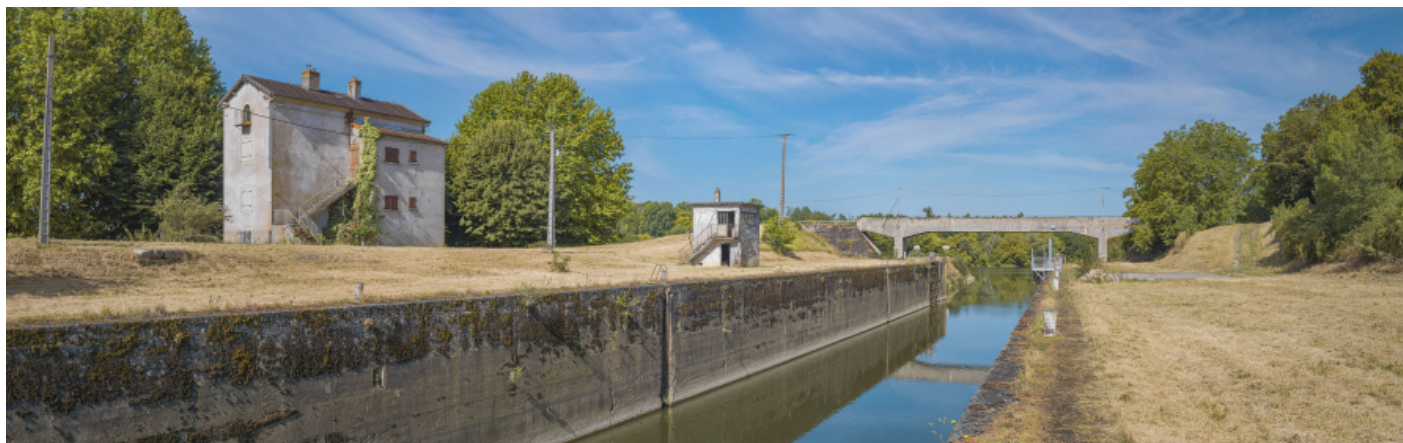
Le site de l'ancienne écluse de Verdun.

71, Verdun-sur-le-Doubs, lieudit : PK 167.5