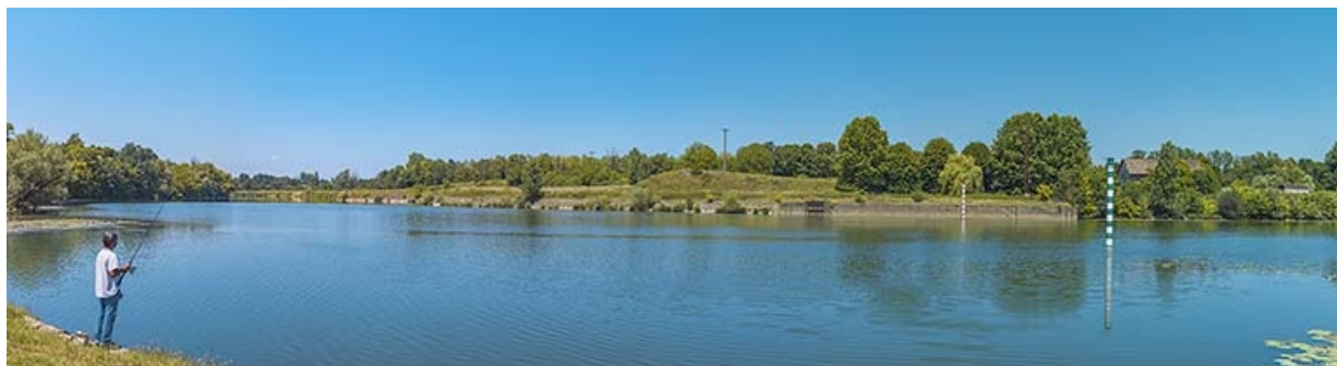
La Saône à hauteur de l'ancien barrage, depuis la rive gauche.

71, Les Bordes rue de l' Ile, lieudit : PK 167,5