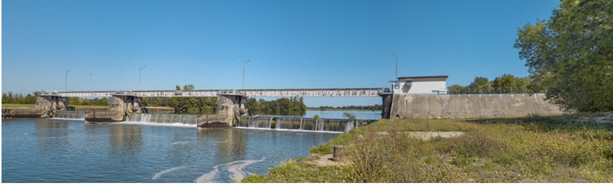
Vue d'ensemble du barrage depuis Charnay-lès-Chalon, rive gauche.

71, Charnay-lès-Chalon rue Neuve, lieudit : PK 178