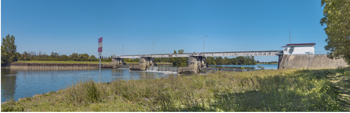
Vue d'ensemble du barrage depuis Charnay-lès-Chalon, rive gauche.

71, Charnay-lès-Chalon rue Neuve, lieudit : PK 178