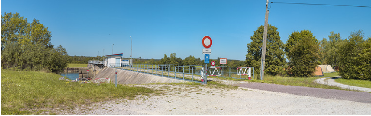
Vue d'ensemble du barrage depuis Charnay-lès-Chalon, rive gauche.

71, Charnay-lès-Chalon rue Neuve, lieudit : PK 178