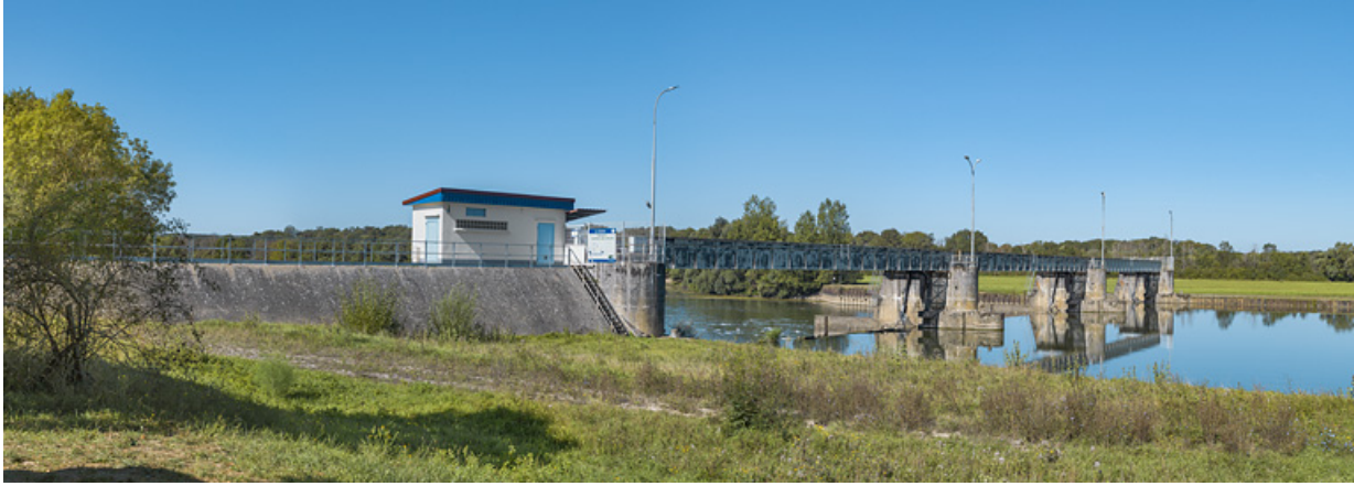
Vue d'ensemble d'amont depuis Charnay-lès-Chalon, rive gauche.

71, Charnay-lès-Chalon rue Neuve, lieudit : PK 178