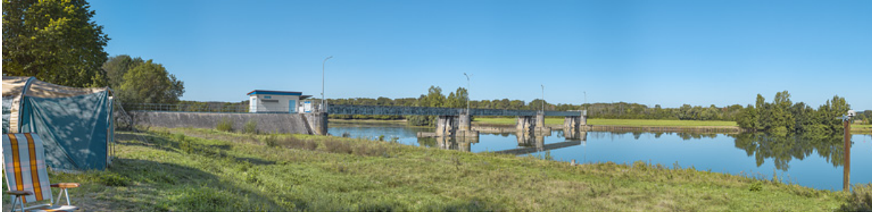
Vue d'ensemble d'amont depuis Charnay-lès-Chalon, rive gauche.

71, Charnay-lès-Chalon rue Neuve, lieudit : PK 178