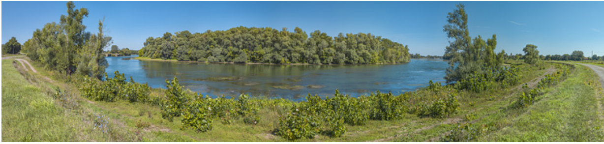
Vue d'ensemble de la partie de bief comprise entre les deux barrages de Charnay. A gauche, l'ancien et à droite, le nouveau. 71, Charnay-lès-Chalon

N° de l'illustration : 20197100471NUC4AQ