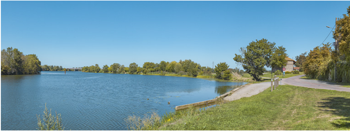
Vue d'ensemble de la cale double.