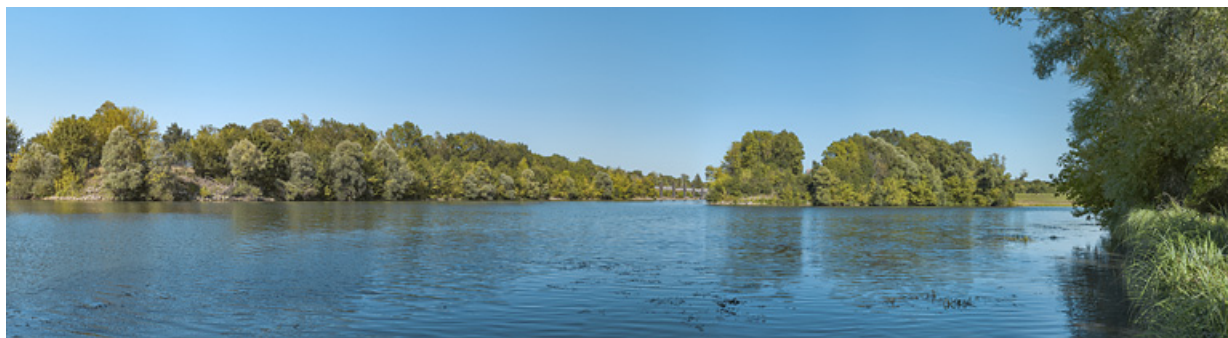
La sortie du bief d'Écuellen, avec en arrière plan, à gauche, le site d'écluse d'Écuellen et à droite, l'ancien bras de la Saône. 71, Écuellen, lieudit : PK 175