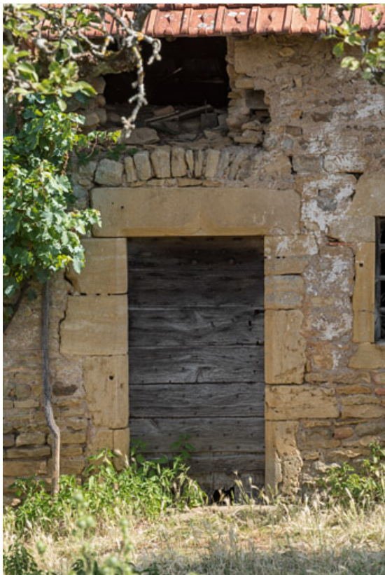
Porte d'une des maisons de l'alignement, avec un linteau à accolade, provenant sans doute d'un autre bâtiment et utilisé en remploi.