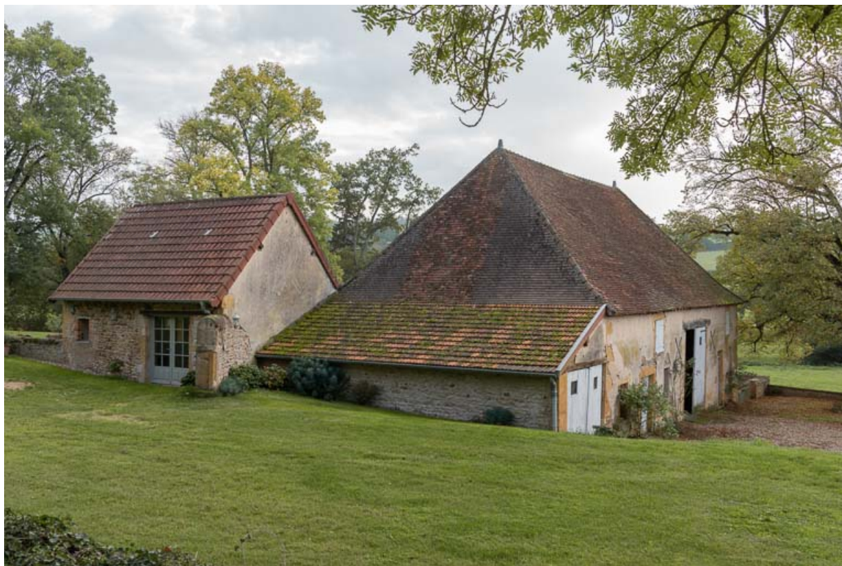
Vue des dépendances, construites dans la seconde moitié du XIXe siècle : le chenil et la grange.