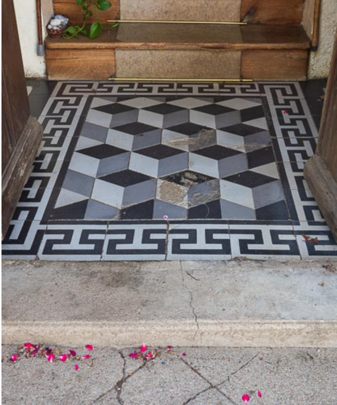
Sol du petit vestibule de la maison, en carreaux de grès céram de la manufacture Paul Charnoz de Paray-le-Monial (fin du XIXe s. - déb. du XXe s.)