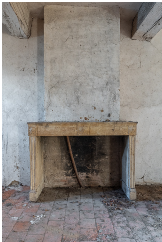
Cheminée d'une des anciennes chambres de la demeure