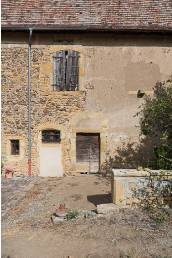
Travée centrale de la façade postérieure de la maison 71, Anzy-le-Duc, lieudit : La Mollière