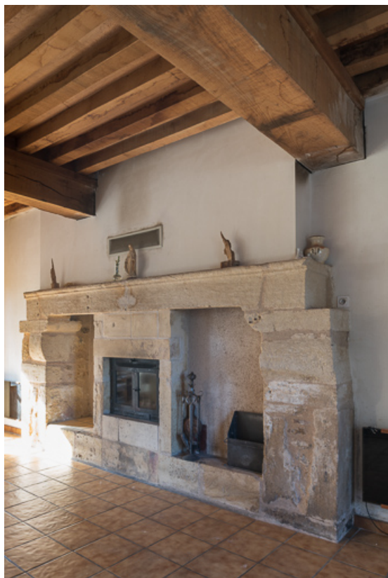
Cheminée de l'ancienne cuisine de la demeure