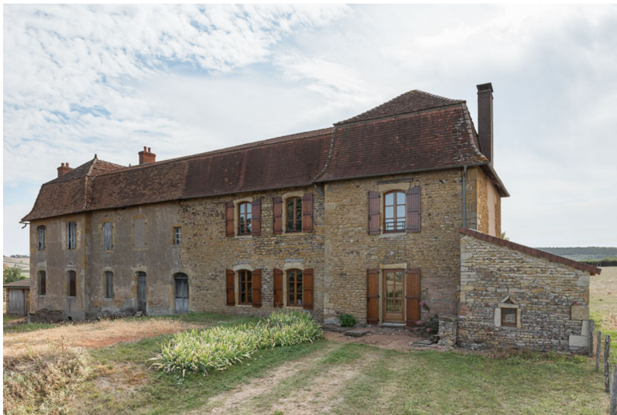
Vue de la demeure ou maison de maître de la Mollière (façade antérieure)