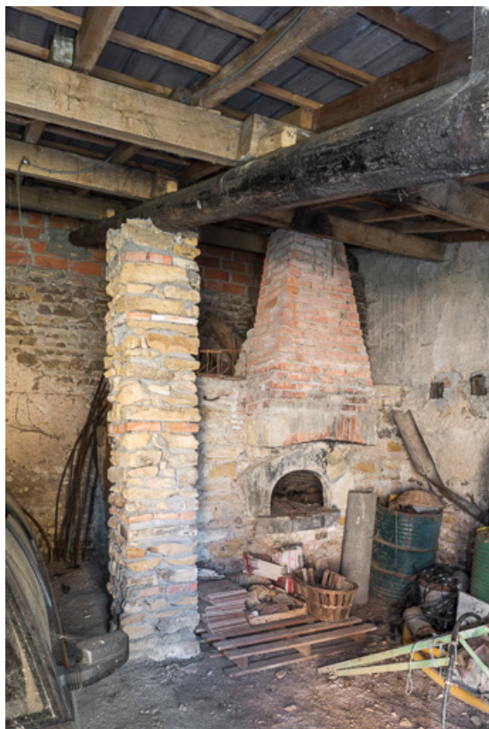
Four à pain du XIXe siècle, contre la façade nord-est de la demeure 71, Anzy-le-Duc, lieudit : La Mollière