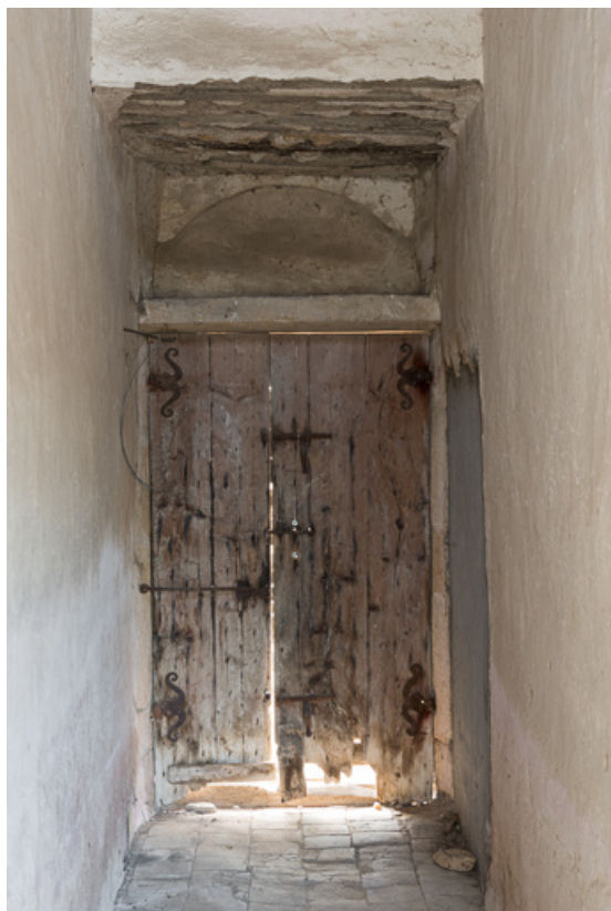
Vue de la porte de la façade postérieure, depuis le vestibule 71, Anzy-le-Duc, lieudit : La Mollière