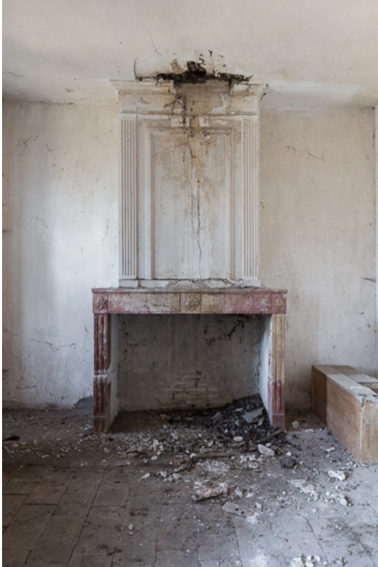
Vue de la cheminée de cette chambre