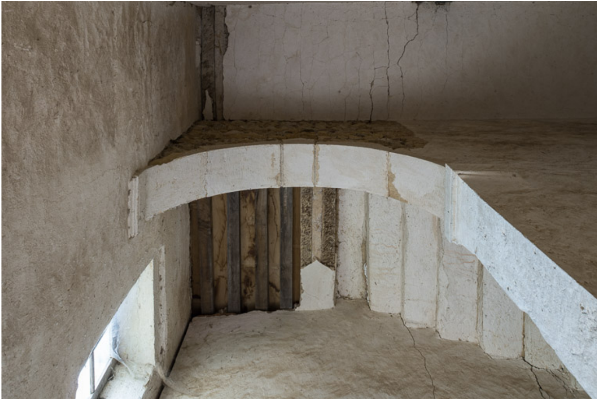
Arche ouvrant sur l'escalier de la demeure