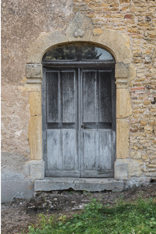
Porte principale de la demeure sur la façade antérieure du bâtiment 71, Anzy-le-Duc, lieudit : La Mollière