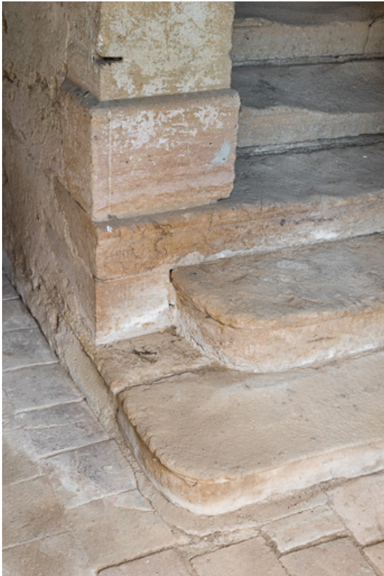
Moulure, à la base du mur-noyau de l'escalier