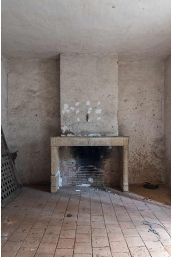
Une des anciennes chambres, à l'étage de la demeure 71, Anzy-le-Duc, lieudit : La Mollière