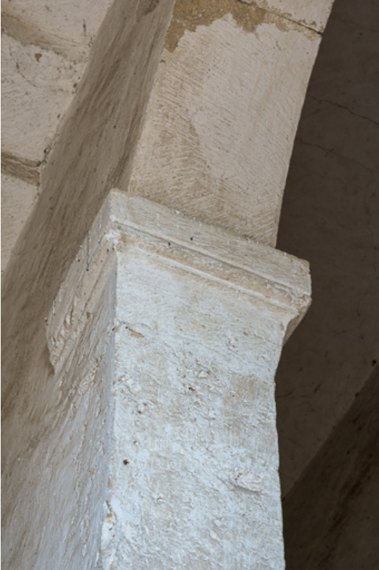
Chapiteau recevant la retombée de l'arche