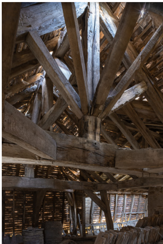
Détail de la charpente : poinçon et contrefiches