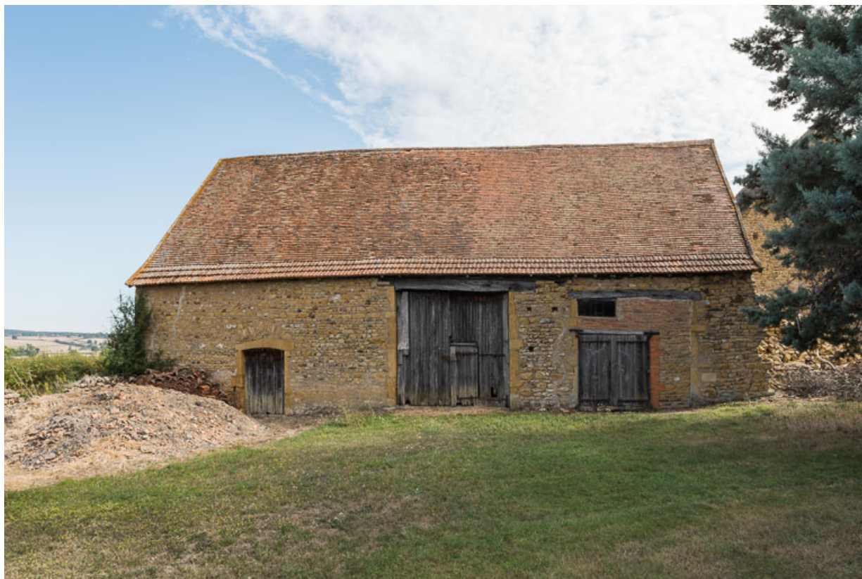
Façade antérieure de l'aile principale des dépendances, orientée à l'ouest