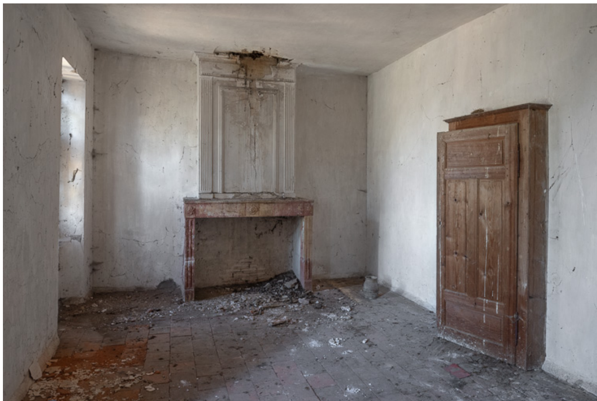
Vue d'une ancienne chambre de la demeure