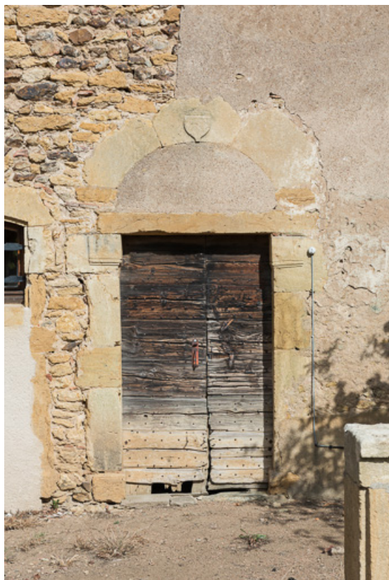
Porte de la façade postérieure de la demeure