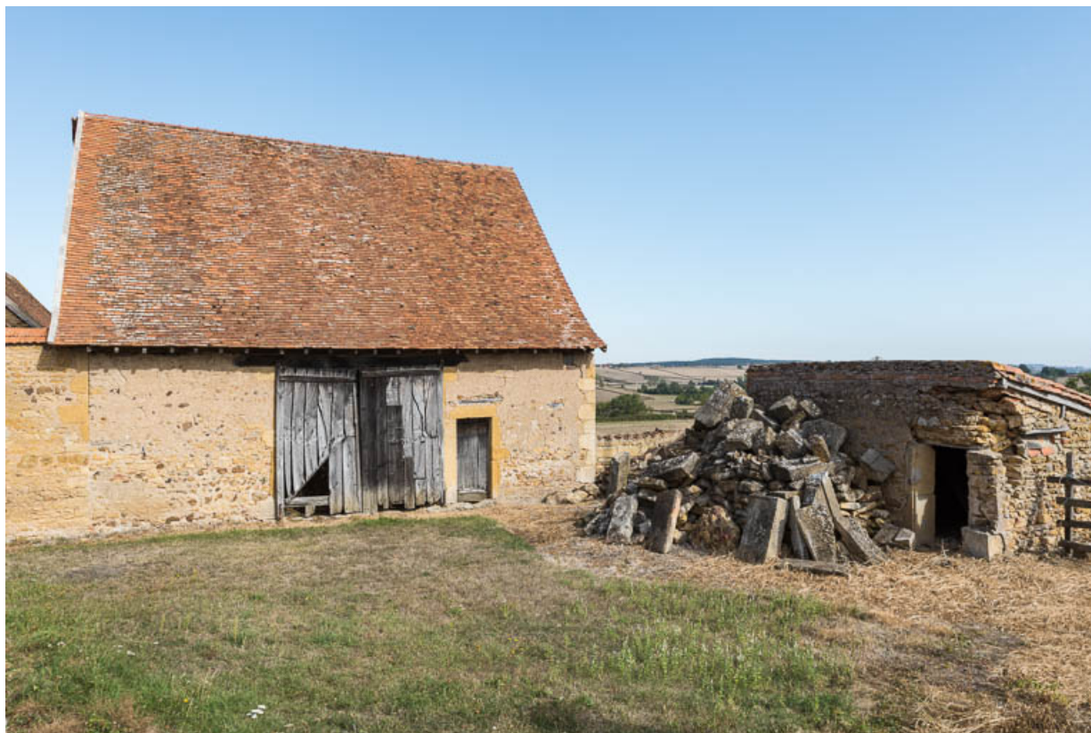
Seconde aile des dépendances (façade antérieure, orientée au sud). A droite, les soues à cochons (XIXe siècle) partiellement démolies.