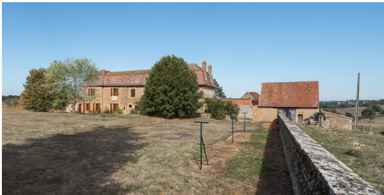
Vue de la demeure (façade postérieure) de la Mollière et de ses dépendances, depuis le jardin.