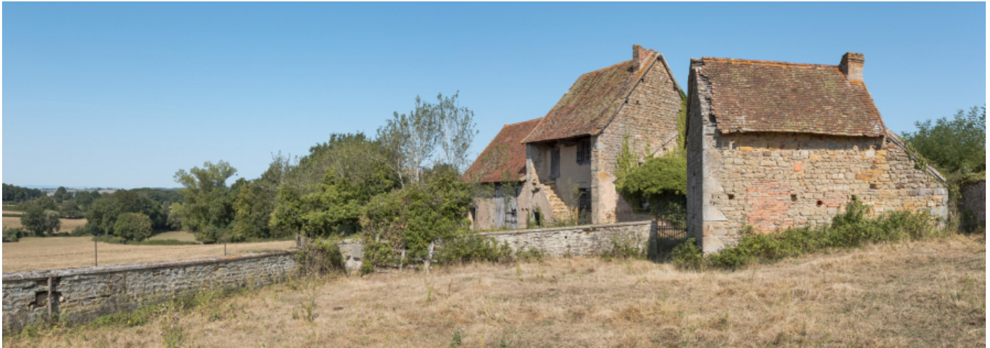
Vue d'ensemble depuis le sud-est des façades antérieures de la maison.

N° de l'illustration : 20187100385NUC4AQ