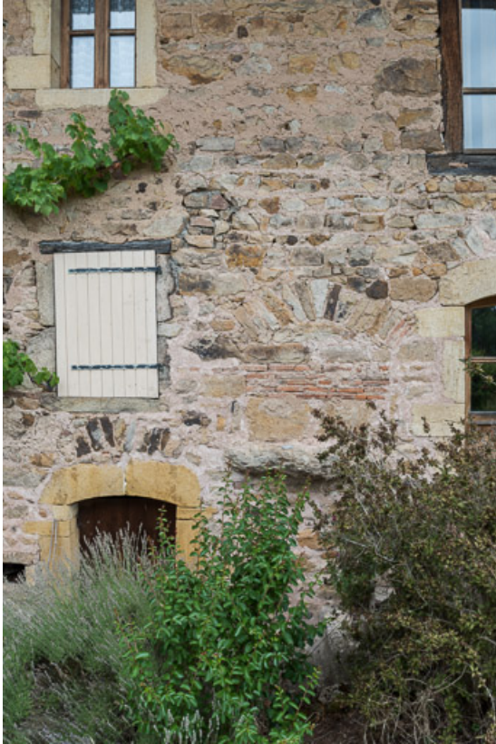
Détail de la façade antérieure de la maison. Au centre, l'évacuation de la pierre d'évier. 71, Colombier-en-Brionnais, 55 route de Frâgne, lieudit : Frâgne