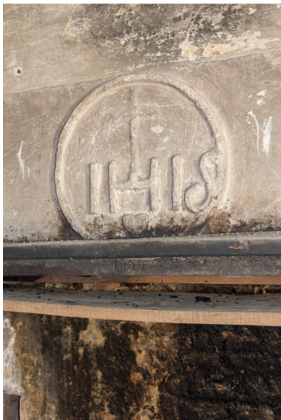
Détail du linteau de la cheminée de la cuisine. Le monogramme "IHS" (auquel un second "i" a été intégré sans doute par erreur) est la transcription de l'abréviation du nom de Jésus en grec. La piété était présente quotidiennement dans la société rurale brionnaise au XVIIIe et XIXe siècles.

71, Saint-Julien-de-Civry, lieudit : Maringue