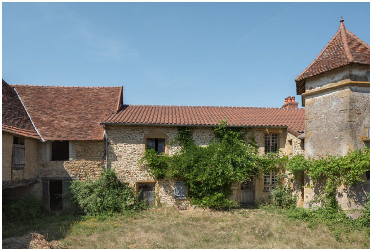
Vue de l'ensemble des bâtiments fermant la cour au nord. De gauche à droite, un bâtiment agricole avec son toit pentu, abritant une étable et un fenil, et la maison avec sa tour d'escalier hexagonale hors-oeuvre.

71, Saint-Julien-de-Civry, lieudit : Maringue