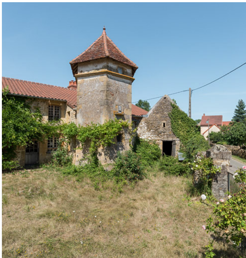
Vue de la façade antérieure de la maison, de la tour d'escalier et d'un petit bâtiment agricole, abritant également une étable ou écurie et fermant la cour à l'est.

71, Saint-Julien-de-Civry, lieudit : Maringue