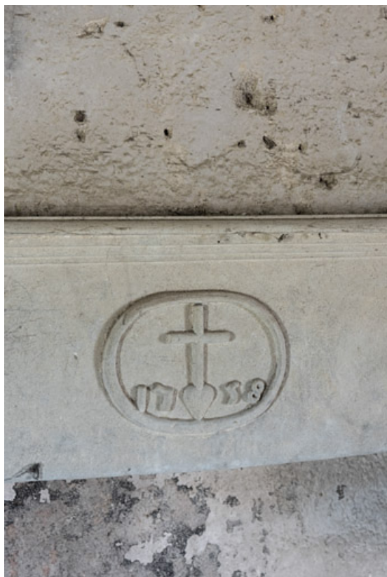
Détail du linteau de la cheminée portant la date de 1758 (indiquant probablement une série de transformations à cette date) dans un médaillon également décoré d'une représentation du Sacré-Coeur.

71, Saint-Julien-de-Civry, lieudit : Maringue