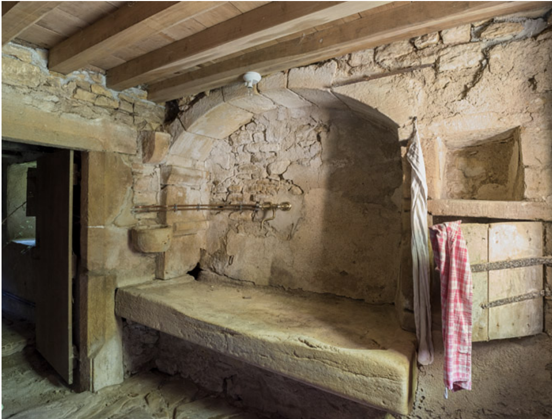
La bassie, avec sa pierre d'évier, dans une niche.

71, Saint-Julien-de-Civry, lieudit : Maringue