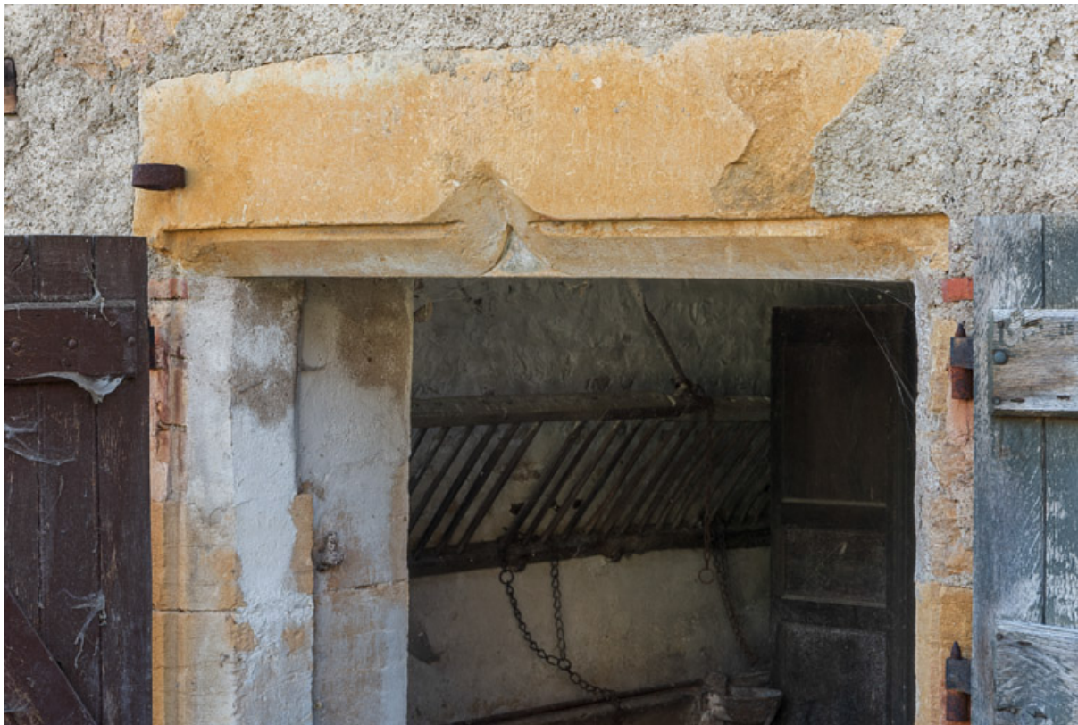
Porte de l'étable double. Le bâtiment étant vraisemblablement plus récent que l'habitation, le linteau avec son accolade est probablement ici un remploi.

71, Saint-Julien-de-Civry, lieudit : Maringue