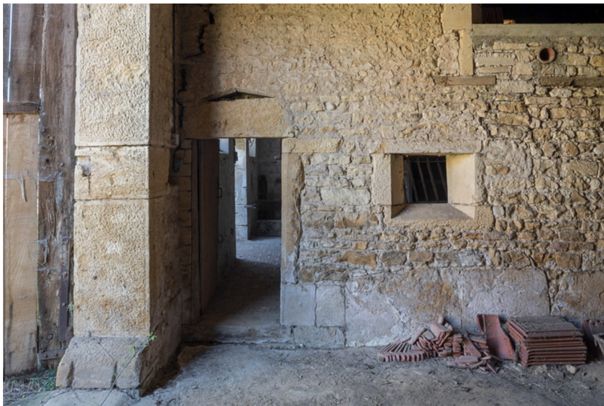
Intérieur de la remise, à côté de l'étable, présentant un des piédroits de l'ouverture de la porte (avec son chasse-roue) et une partie du mur mitoyen avec l'étable percé d'une porte et de feurons.

71, Saint-Julien-de-Civry, lieudit : Maringue