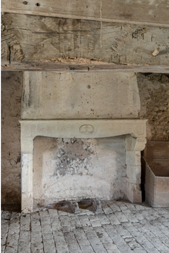
Cheminée dans une chambre, à l'étage de la demeure

71, Saint-Julien-de-Civry, lieudit : Maringue