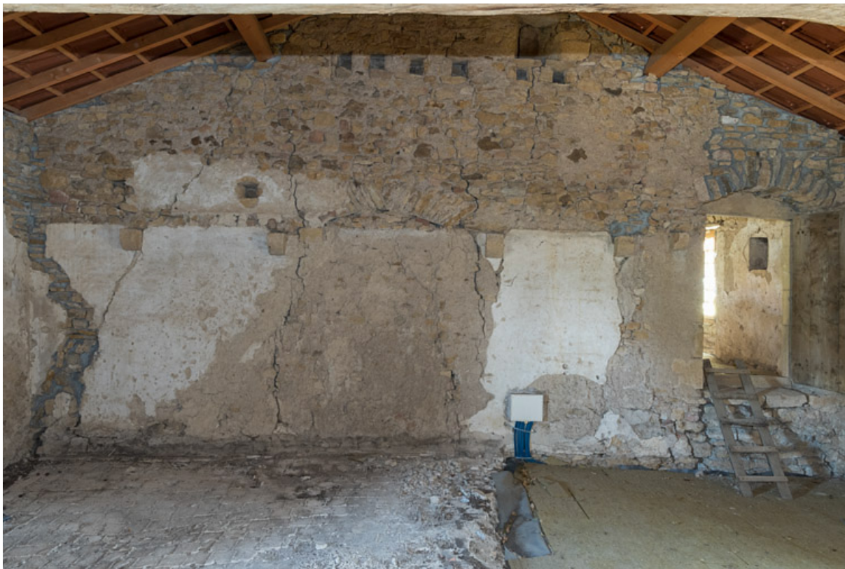
Mur de la grande chambre, face à la cheminée. Les trous marquant l'emplacement d'anciennes poutres et la hauteur de l'enduit à la chaux, qui recouvre le mur, indique la présence d'un ancien plancher, qui séparait la pièce des combles.

71, Saint-Julien-de-Civry, lieudit : Maringue