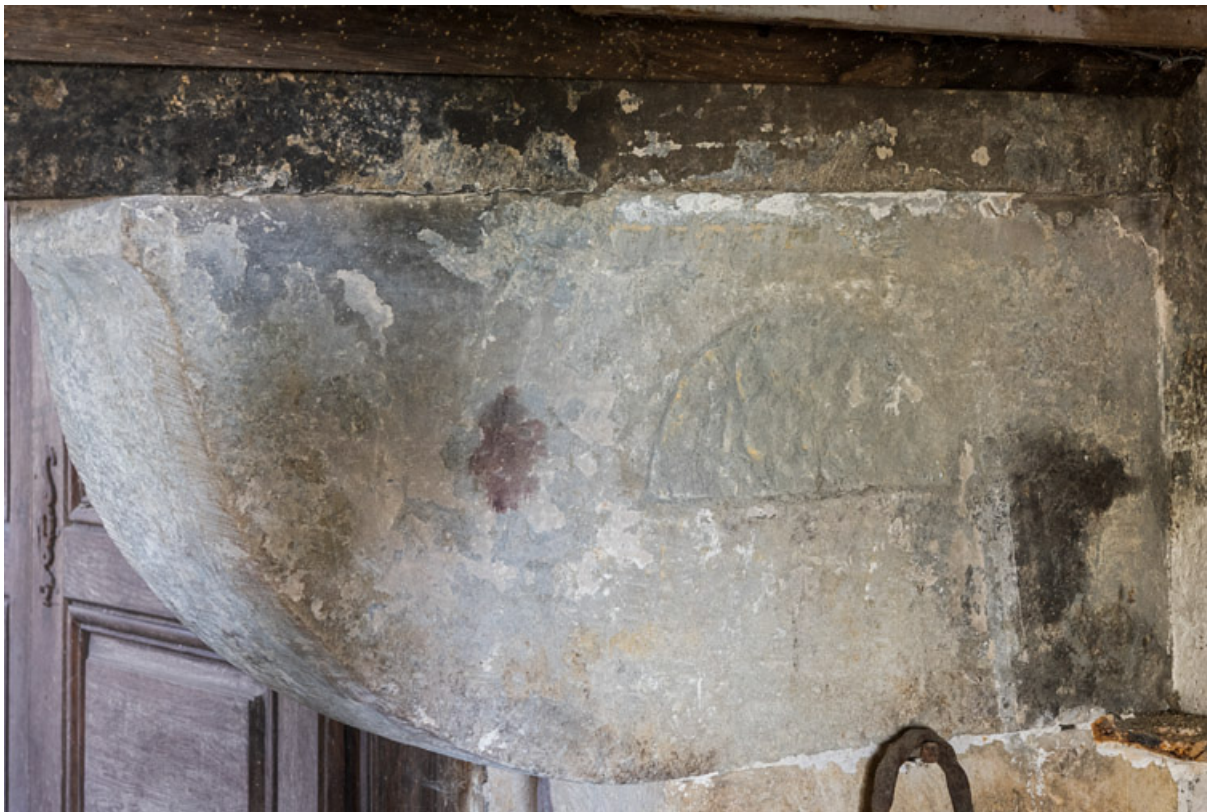
Corbeau portant le linteau de la cheminée et sur lequel est gravé une date - "18??" - indiquant une reprise de cet élément (et sans doute d'autres transformations) au XIXe siècle.

71, Saint-Julien-de-Civry, lieudit : Maringue