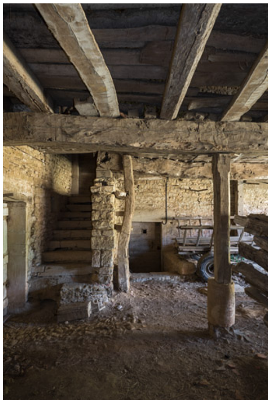
Hangar à droite de la remise. Au fond, deux petits escaliers permettent l'accès à un cellier pour l'un et à une cave semi-enterrée pour le second.

71, Saint-Julien-de-Civry, lieudit : Maringue