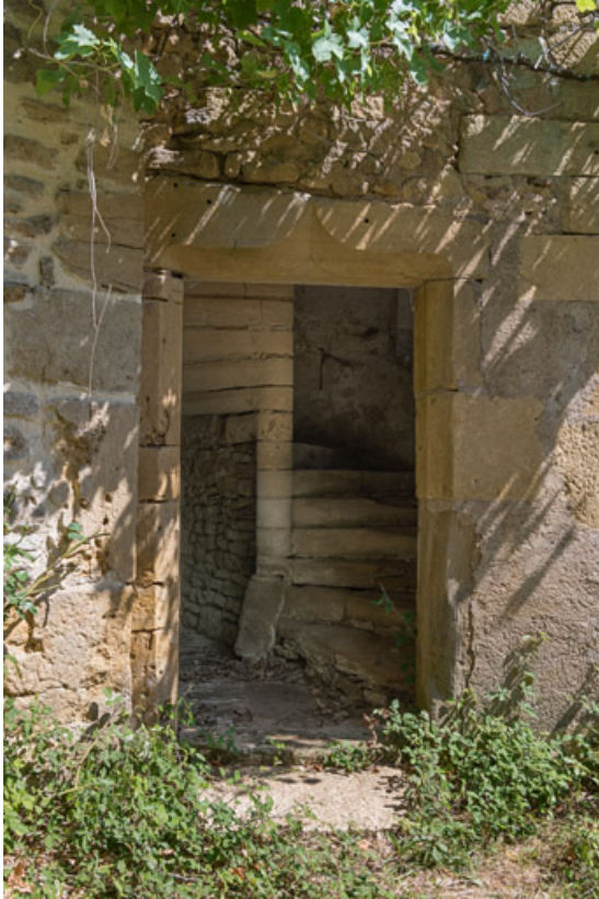
Vue de l'escalier à vis et de sa porte d'accès, avec son linteau orné d'une accolade 71, Saint-Julien-de-Civry, lieudit : Maringue