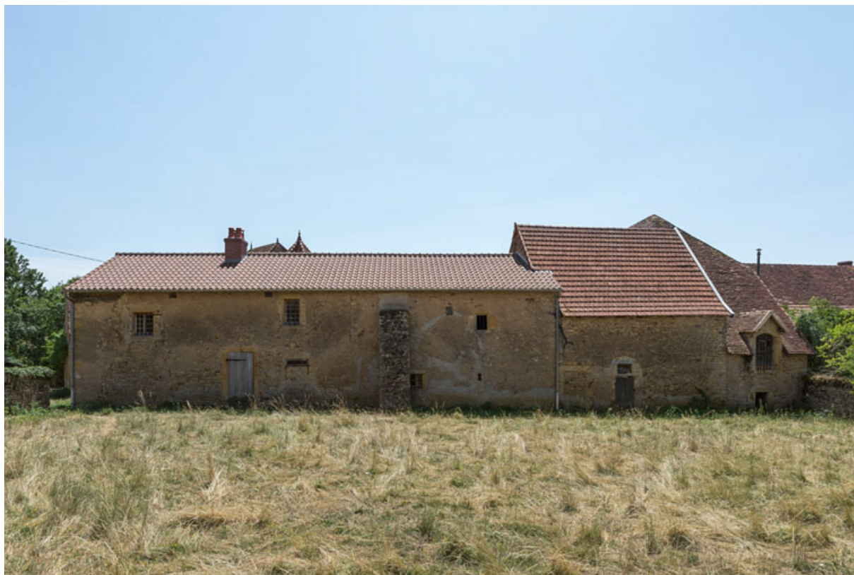
Façade postérieure de la demeure et des bâtiments annexes, depuis le jardin, au nord. Une rupture de maçonnerie, à gauche du contrefort, indique que l'habitation a été vraisemblablement construite en deux phases.

71, Saint-Julien-de-Civry, lieudit : Maringue