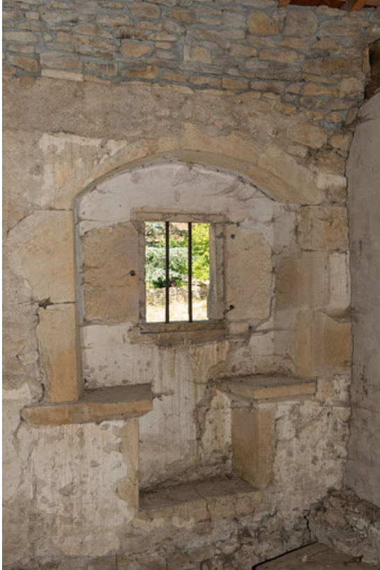
Coussiège dans la grande chambre de l'étage

71, Saint-Julien-de-Civry, lieudit : Maringue