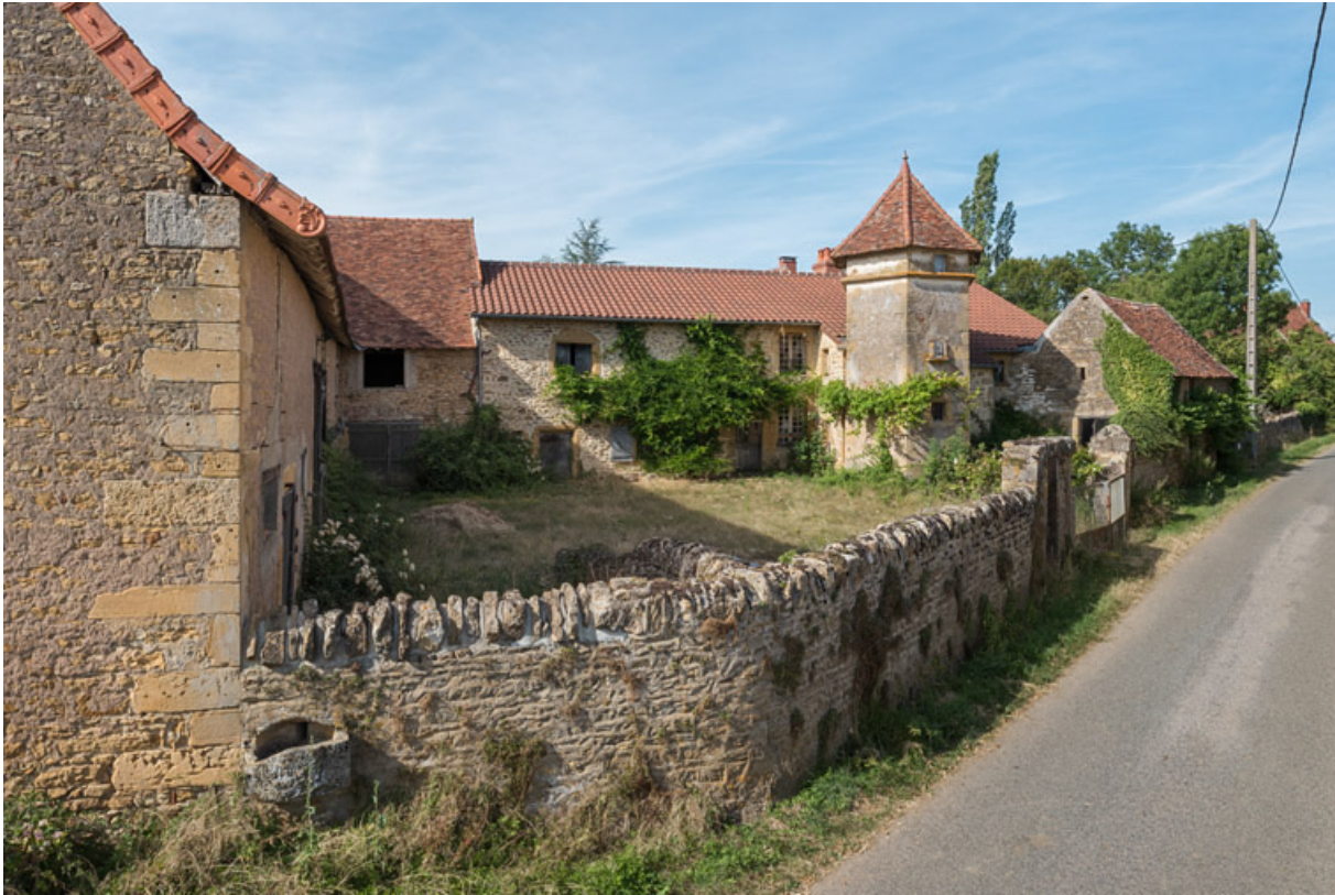
Vue d'ensemble des bâtiments du domaine

71, Saint-Julien-de-Civry, lieudit : Maringue