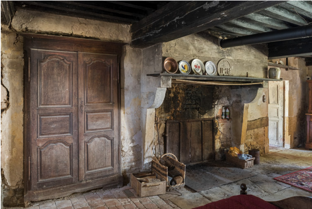
Vue de la cuisine, avec sa cheminée et un placard, aménagé dans l'épaisseur du mur.

71, Saint-Julien-de-Civry, lieudit : Maringue