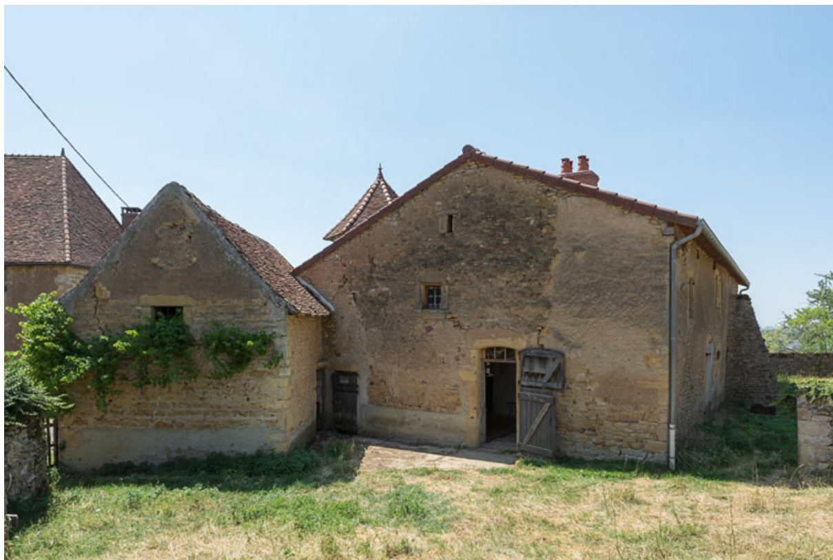
Mur-pignon est de la demeure joignant la petite écurie, fermant la cour de ferme à l'est

71, Saint-Julien-de-Civry, lieudit : Maringue