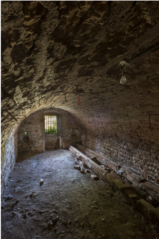
Vue intérieure de la cave

71, Saint-Julien-de-Civry, lieudit : Maringue