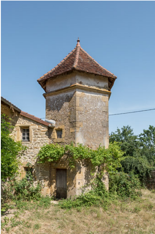
Vue de la tour hexagonale abritant un escalier à vis et, au sommet, un pigeonnier.

71, Saint-Julien-de-Civry, lieudit : Maringue