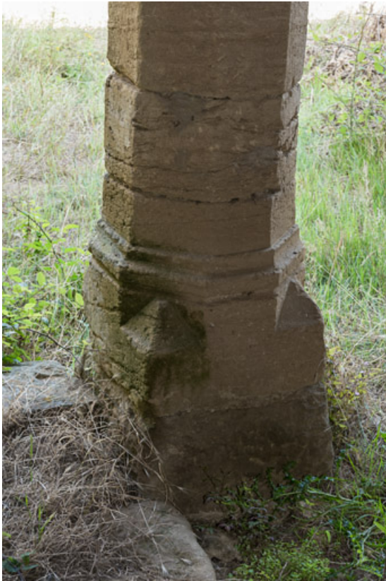
Une des poutres du plancher du fenil est soutenu par ce pilier hexagonal, avec une base moulurée, utilisé en remploi. 71, Saint-Julien-de-Civry, lieudit : Maringue