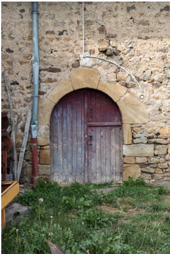
Porte de l'étable de la grange de la ferme n°4, couverte d'un arc en plein cintre. 71, Dyo, lieudit : Mans