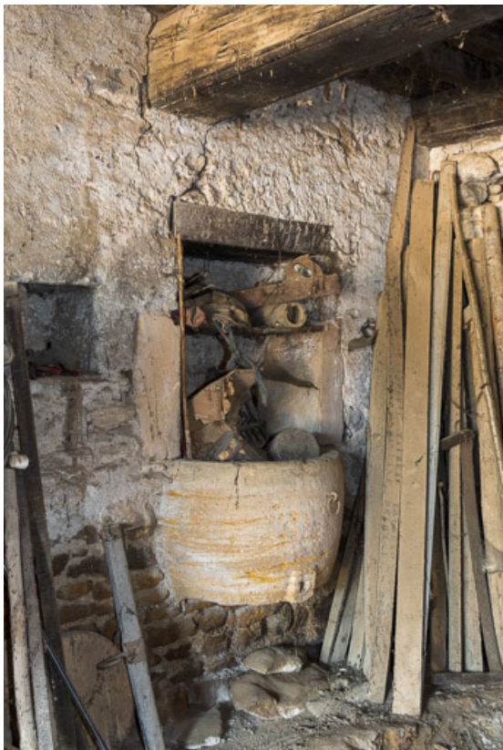
Cuvier à lessive dans l'ancienne maison n°3 (A 380), partiellement reconstruite et entièrement transformée en remise. 71, Dyo, lieudit : Mans