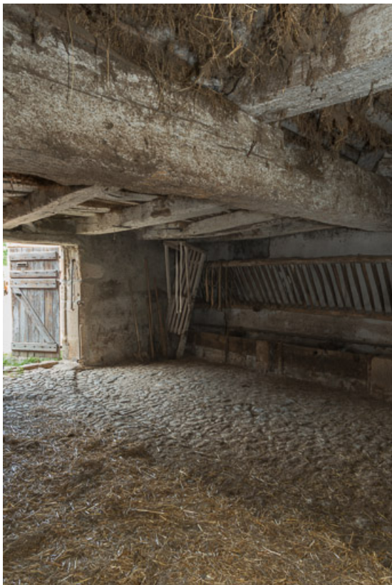
Vue intérieure de l'étable de la ferme n°2 (A 381).