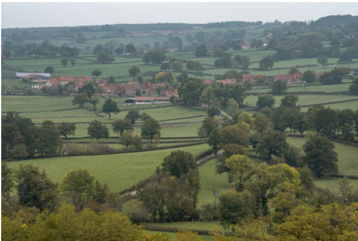
Vue du hameau de Mans, depuis le bourg de Dyo, au sud-ouest.