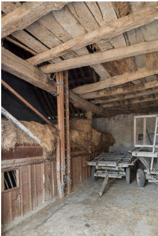
Vue intérieure de la grange de la ferme n°4 (A 379). 71, Dyo, lieudit : Mans