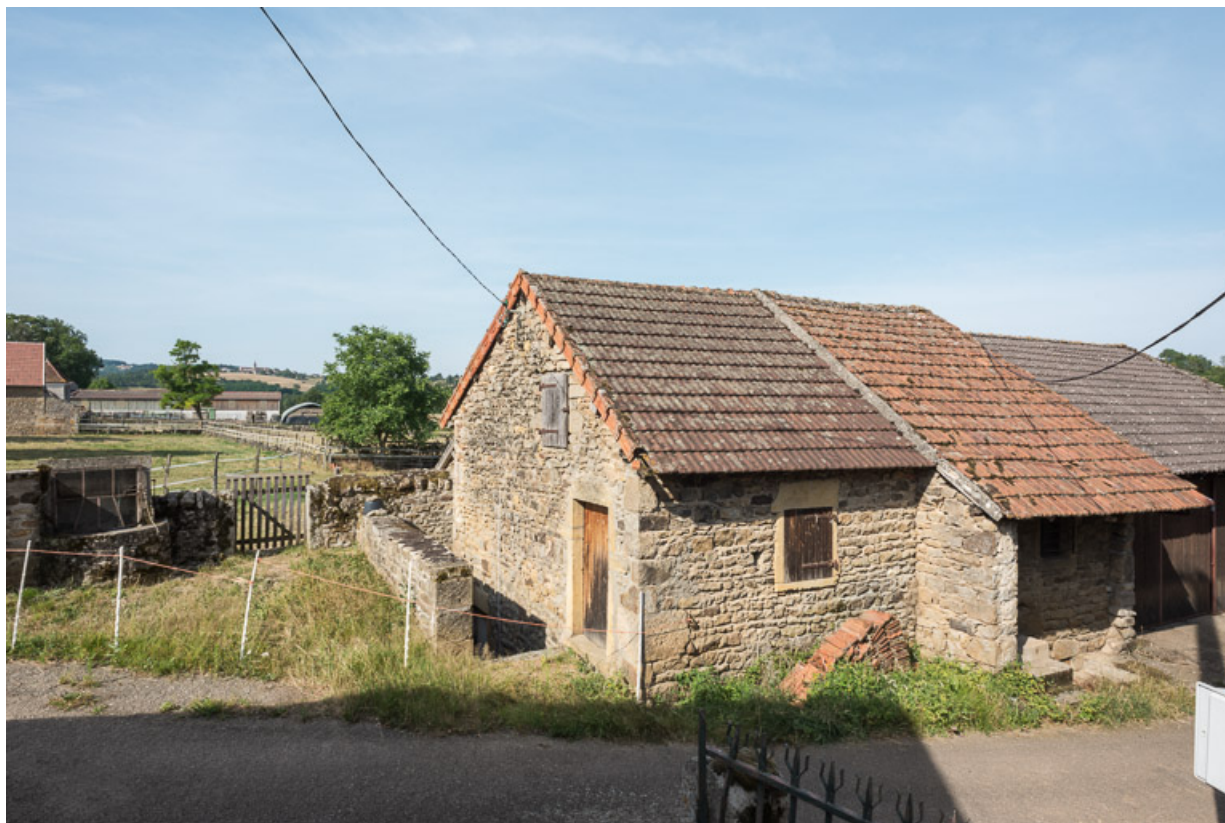
Vue d'un bâtiment dépendant de la ferme n°4 (A 379), de l'autre côté du chemin, abritant une cave et un four à pain. 71, Dyo, lieudit : Mans