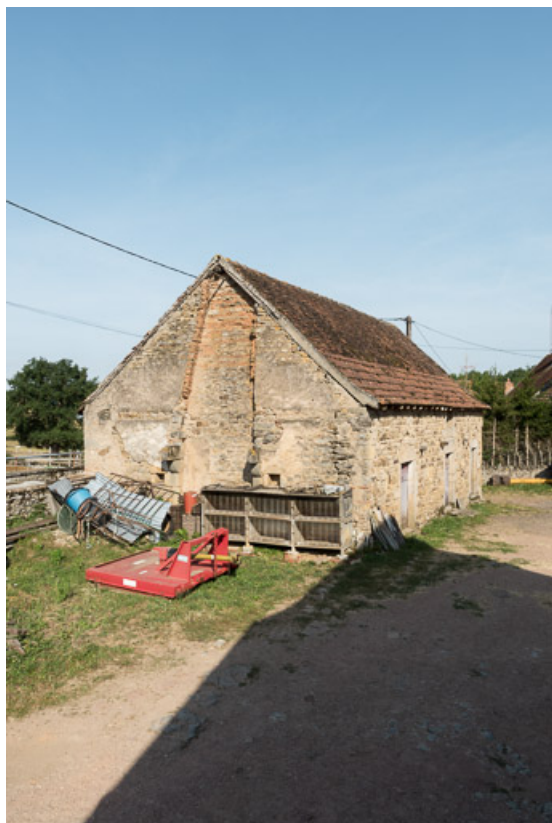
Vue du mur-pignon est de la dépendance, qui conserve une trace de la cheminée de la maison de la ferme n°2 (A 381). 71, Dyo, lieudit : Mans