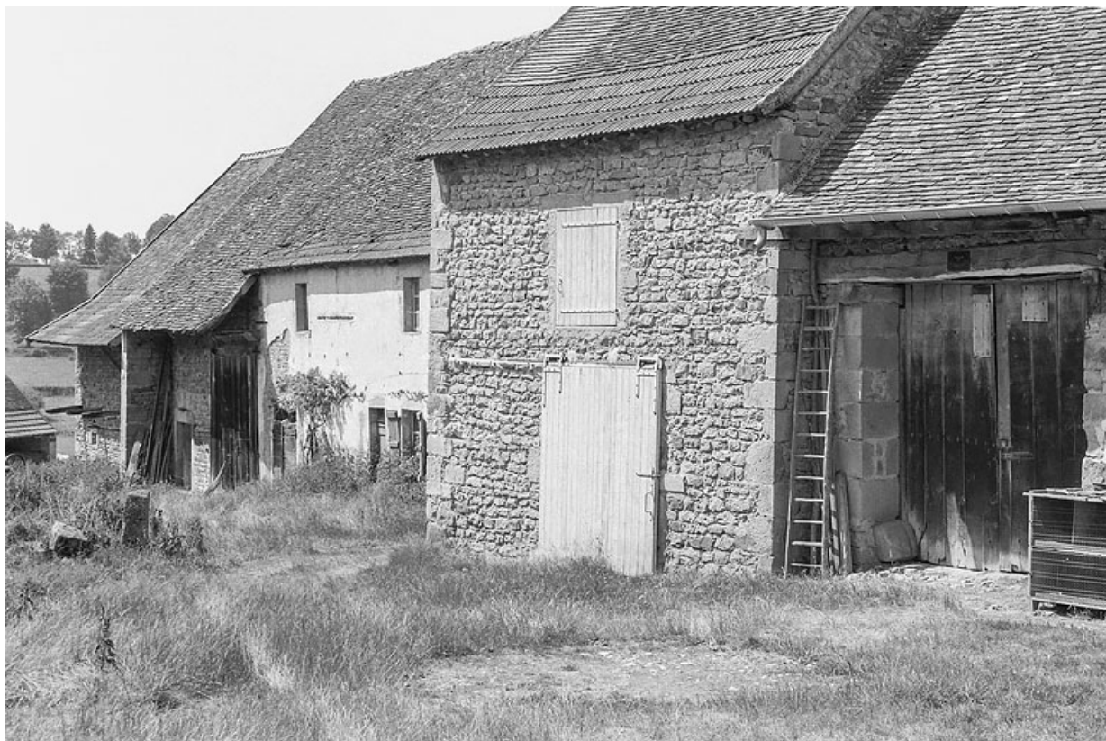
Vue des bâtiments, constituant la seconde partie de l'alignement, vers 1970. 71, Dyo, lieudit : Mans