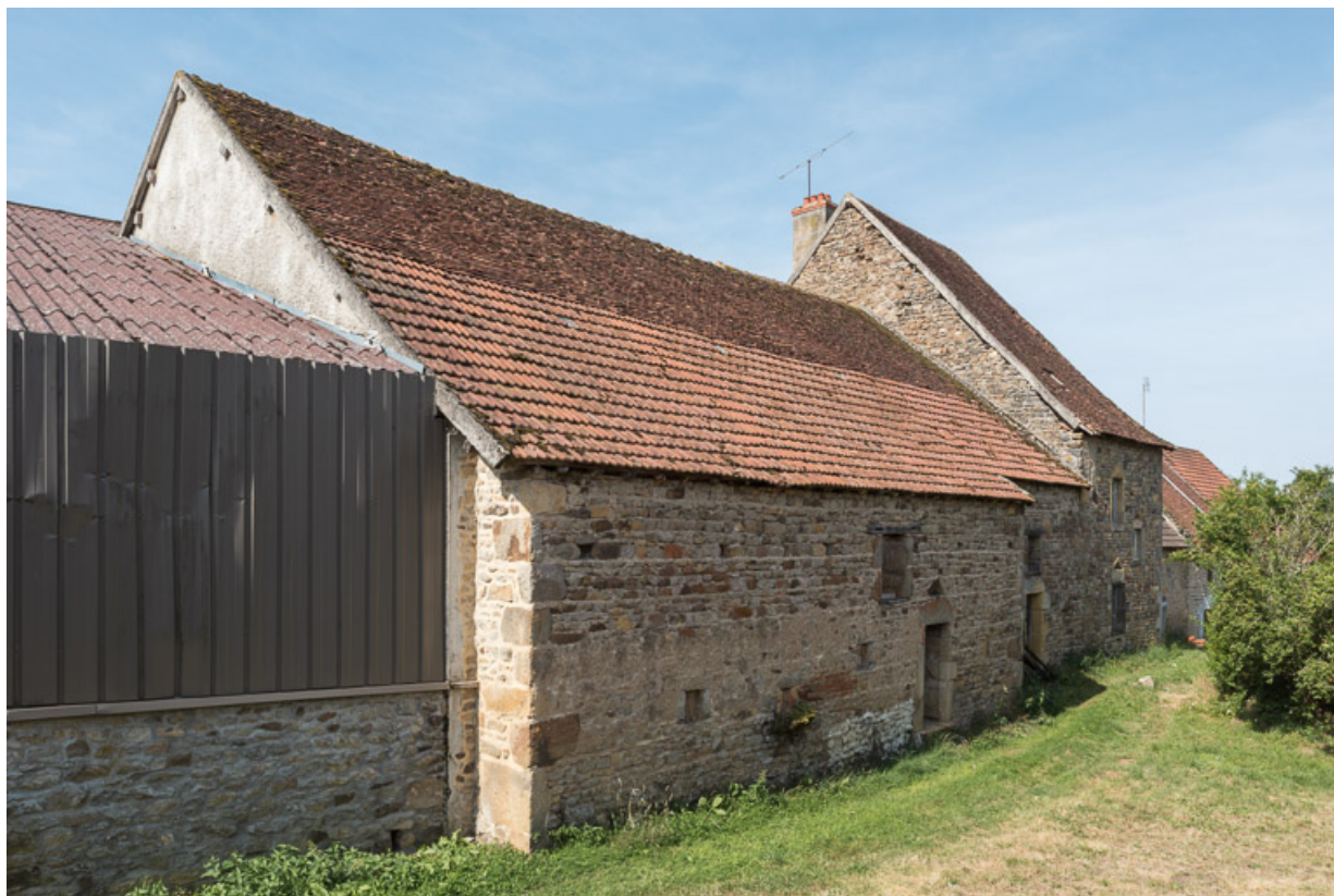
Vue postérieure de l'alignement. le hangar, à gauche, a été construit à l'emplacement de la maison de la ferme n°1 (A 382). 71, Dyo, lieudit : Mans