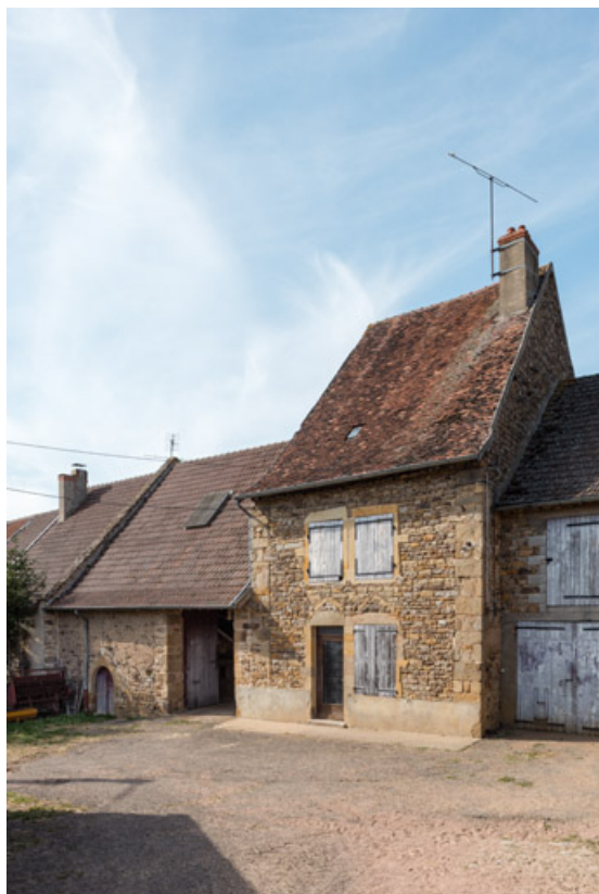
Vue de la ferme n°4 (A 379).