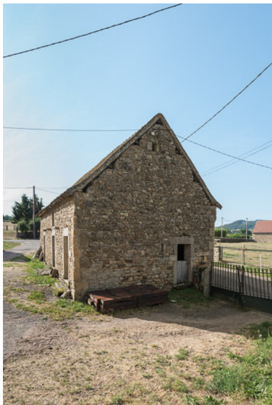
Mur-pignon ouest de la dépendance avec ses angles chanfreinés.