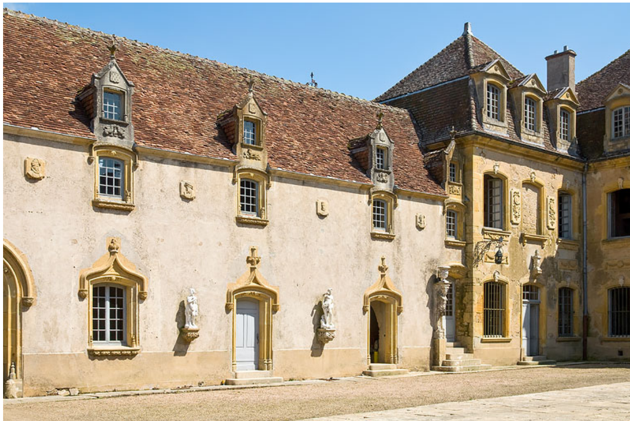
Vue du pavillon d'angle et de l'aile, à l'est de la cour d'honneur.