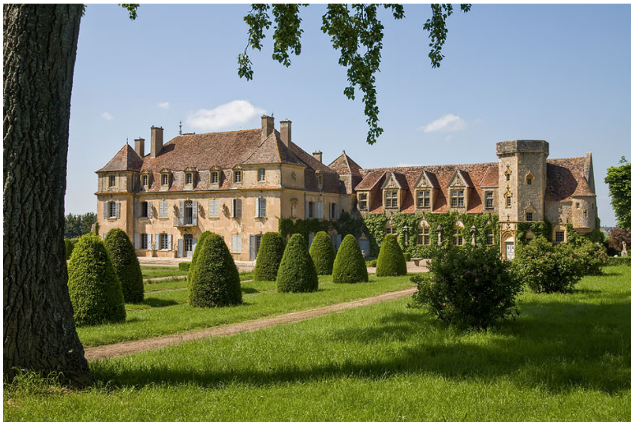
Vue du château depuis le jardin, au sud.