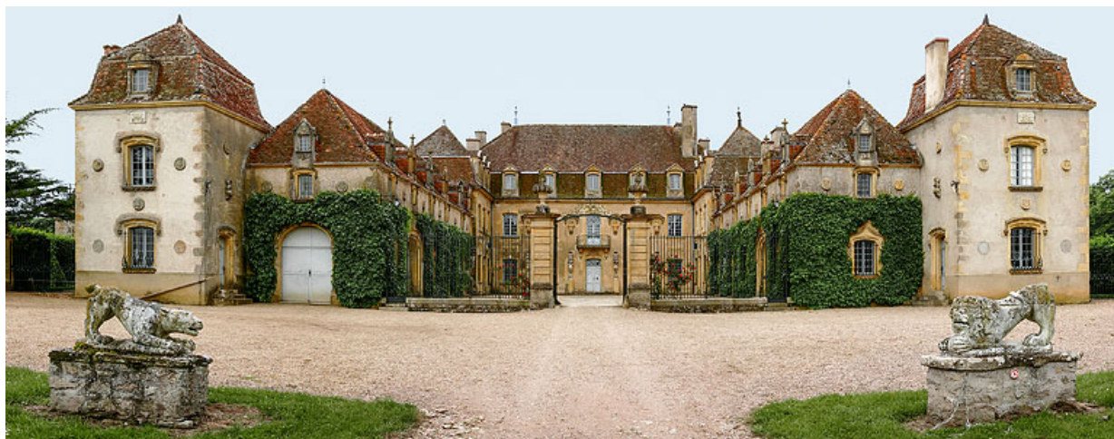
Vue du château et de la cour d'honneur au nord.