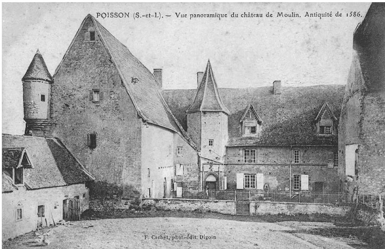
Vue du château de Moulin-l'Arconce, avant sa destruction commencée en 1901. Plusieurs éléments ont été remployés au château de Chaumont.