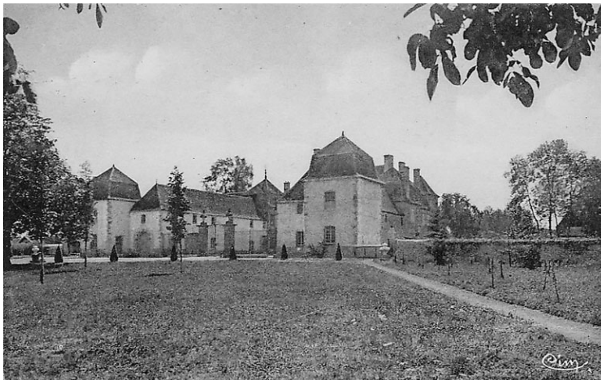
Vue du château, depuis le nord, carte postale, début du XXe siècle.