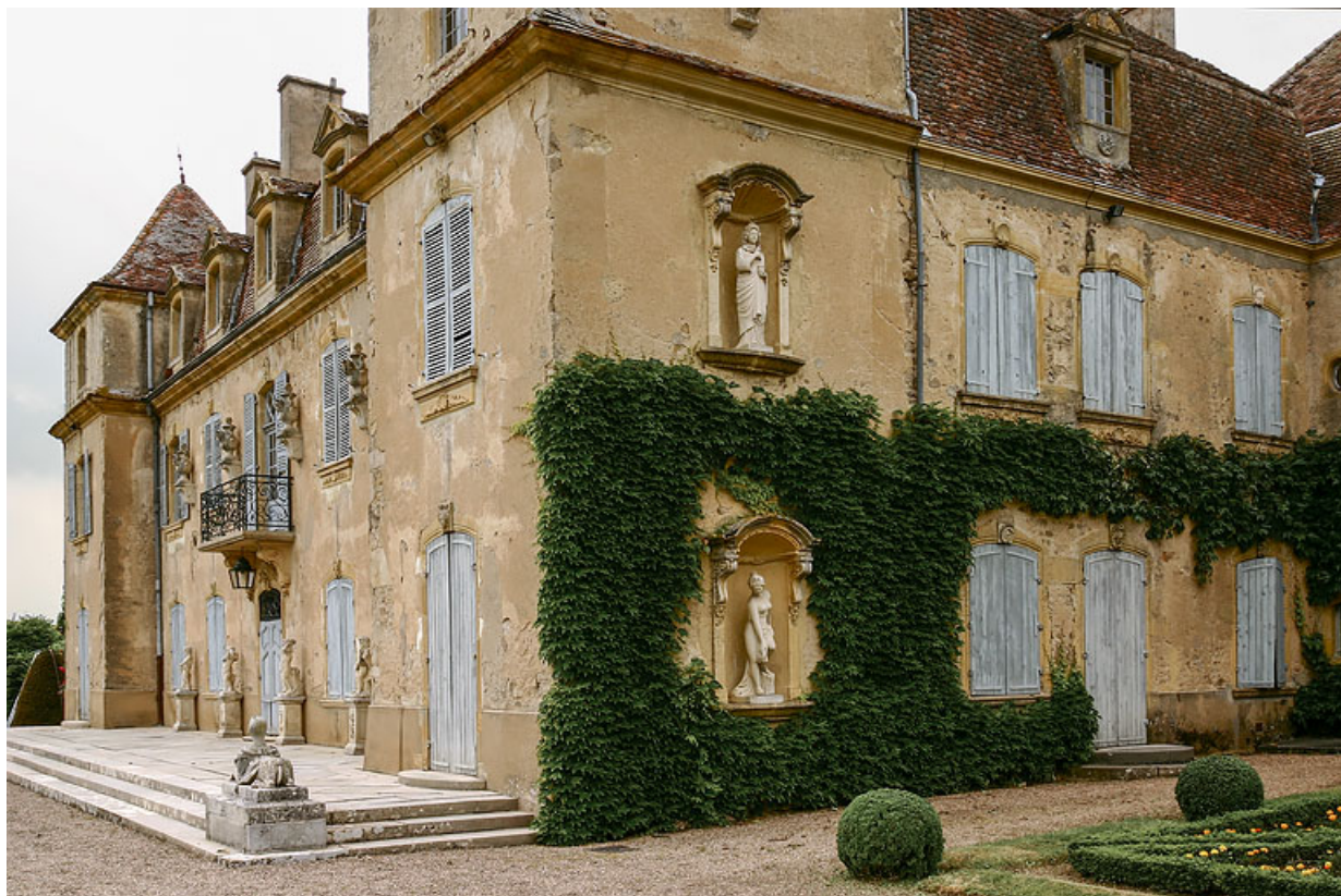
Vue des façades sud et est.