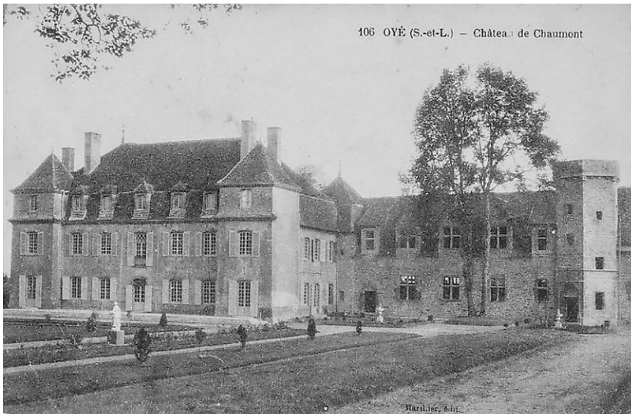
Vue du château, depuis le sud, carte postale, début du XXe siècle.