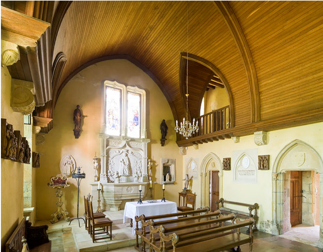
Chapelle, aménagée au début du XXe siècle, dans une partie de l'ancienne grange, à l'est du corps de logis. 71, Oyé, lieudit : Chaumont