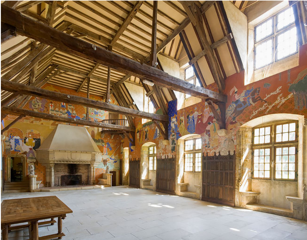
Grande salle d'apparat, aménagée au début du XXe siècle dans une ancienne grange, à l'est du corps de logis. Les murs sont décorés d'une fresque représentant les épisodes de la vie de saint Louis, achevée en 1957.