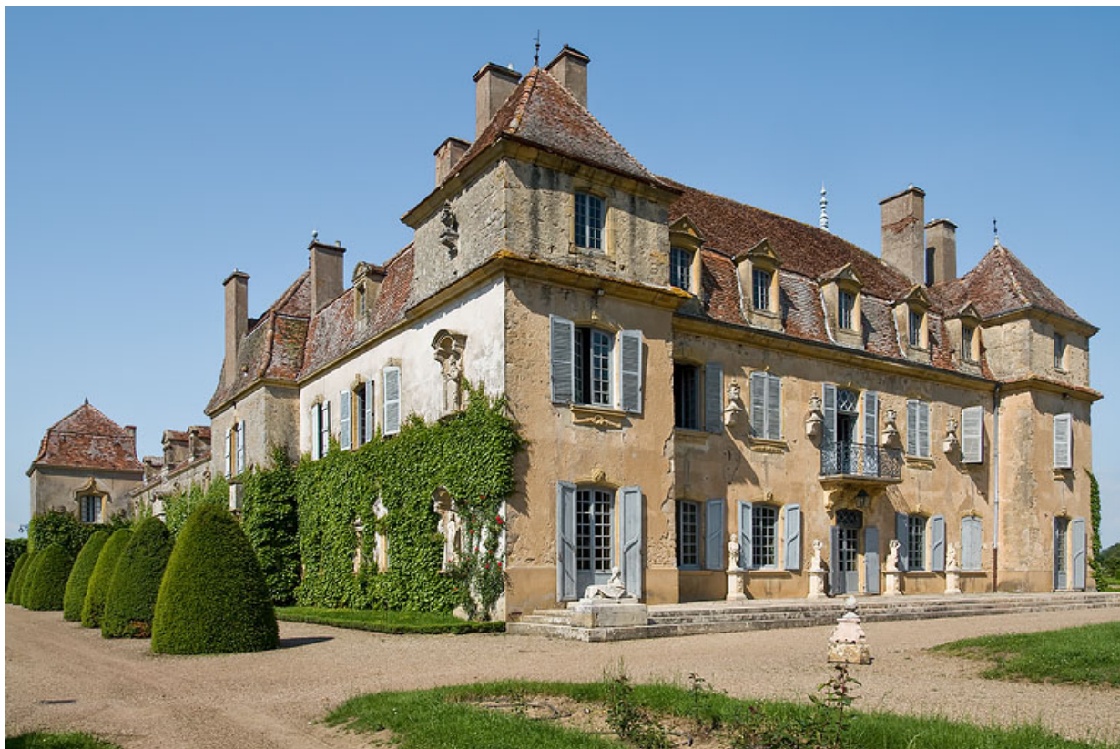
Vue des façades sud et ouest