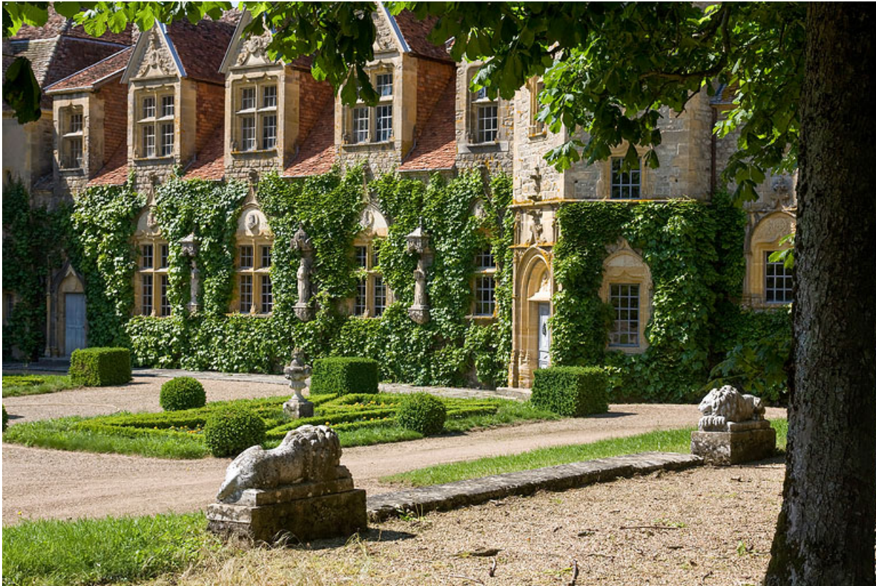
Vue de la façade sud de l'ail abritant la grande salle (ancienne grange), transformée au début du XXe siècle par l'ajout de lucarnes et d'une tour d'escalier hors-oeuvre provenant de l'ancien château de Moulin-l'Arconce (commune de Poisson).