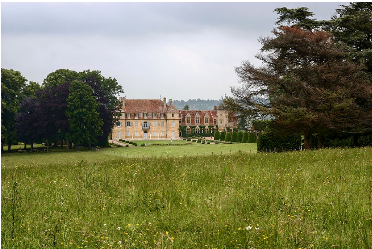
Vue du château depuis le jardin, au sud.