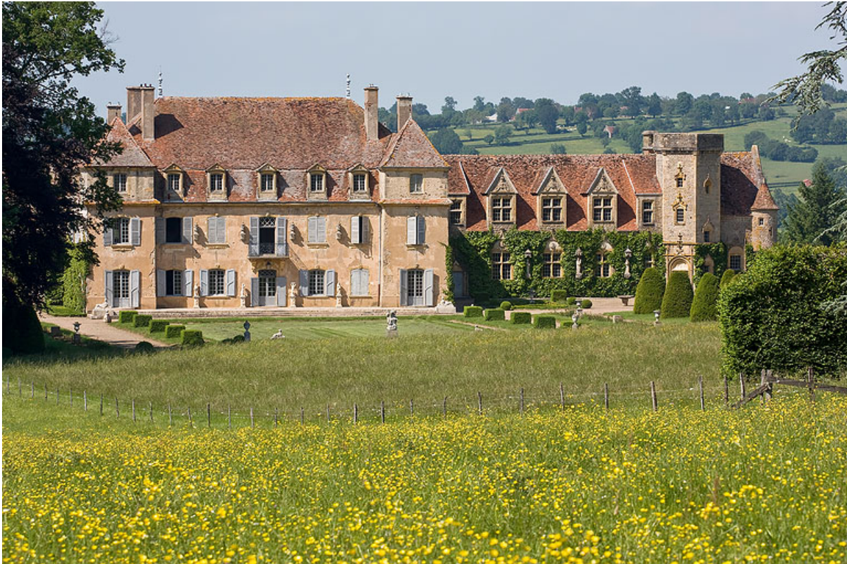
Vue du château depuis le jardin, au sud.