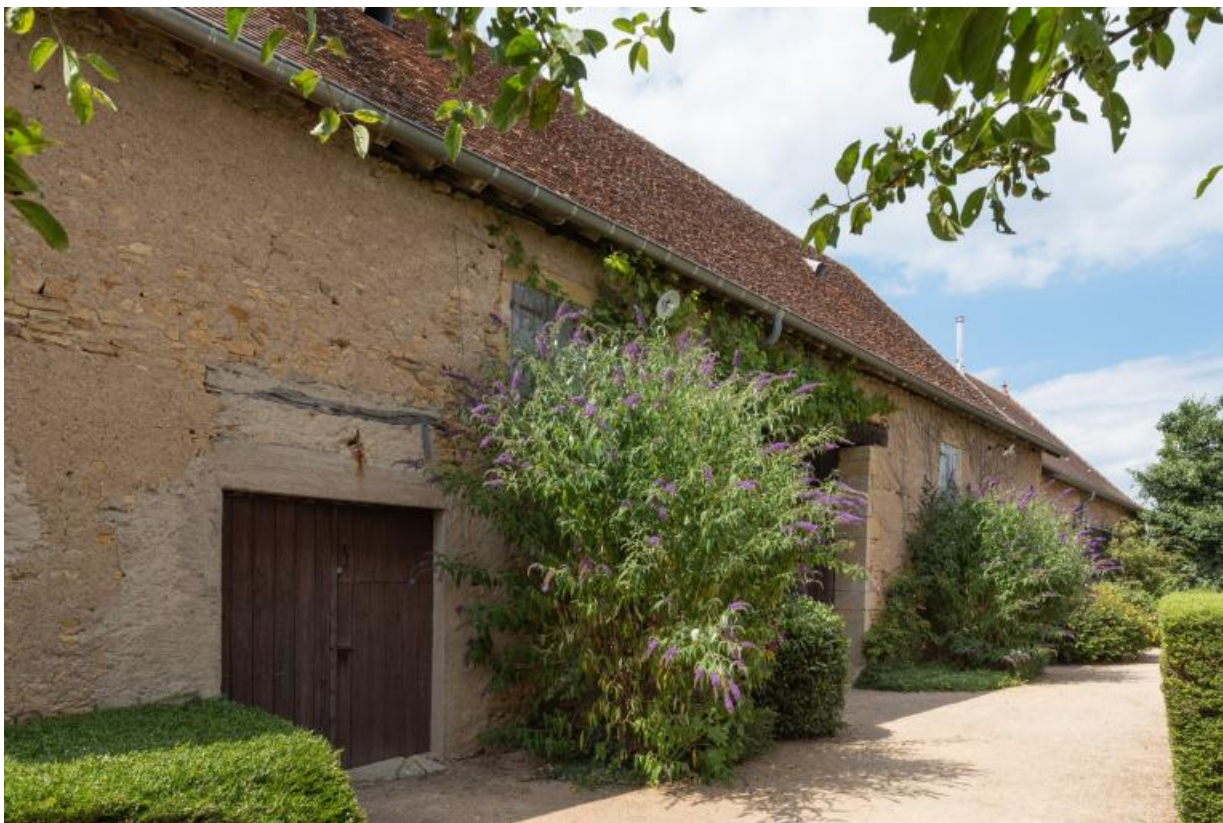
Vue des façades antérieures des deux granges, construites à des dates différentes dans le même alignement. La grange, au premier plan, a été érigée en 1831.

71, Saint-Julien-de-Civry, lieudit : En Vaux