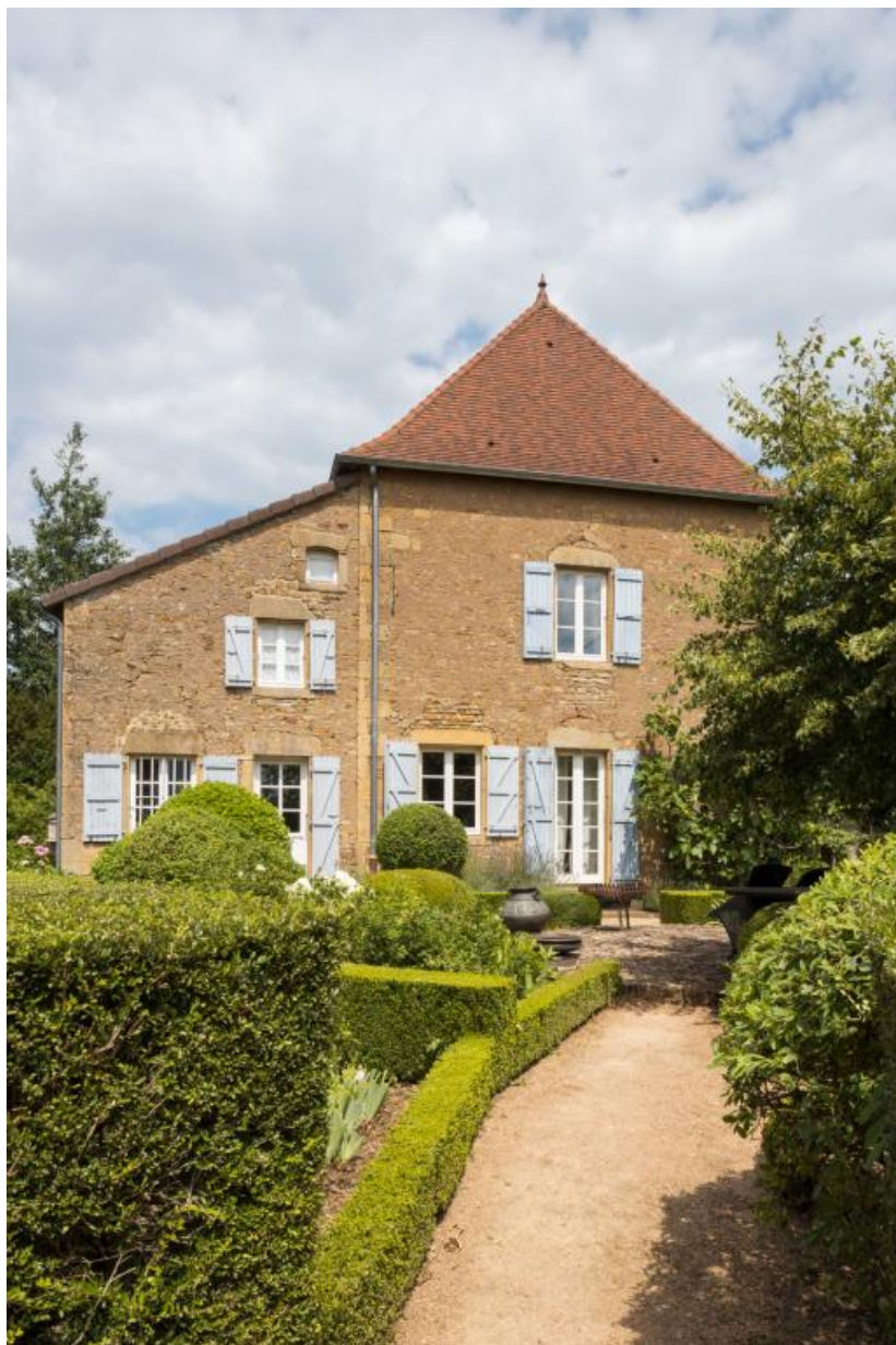
Façade latérale ouest de la maison

71, Saint-Julien-de-Civry, lieudit : En Vaux