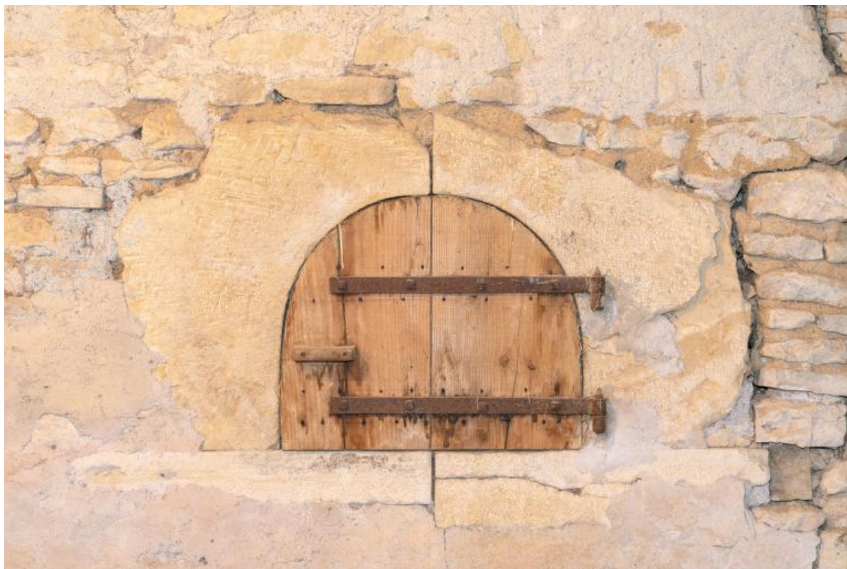
Vue d'un feuron depuis la remise

71, Saint-Julien-de-Civry, lieudit : En Vaux