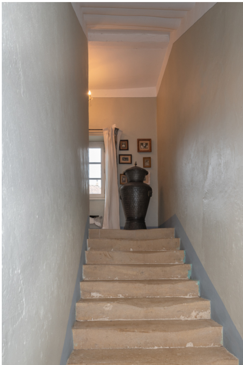
Volée de l'escalier rampe sur rampe de la maison

71, Saint-Julien-de-Civry, lieudit : En Vaux