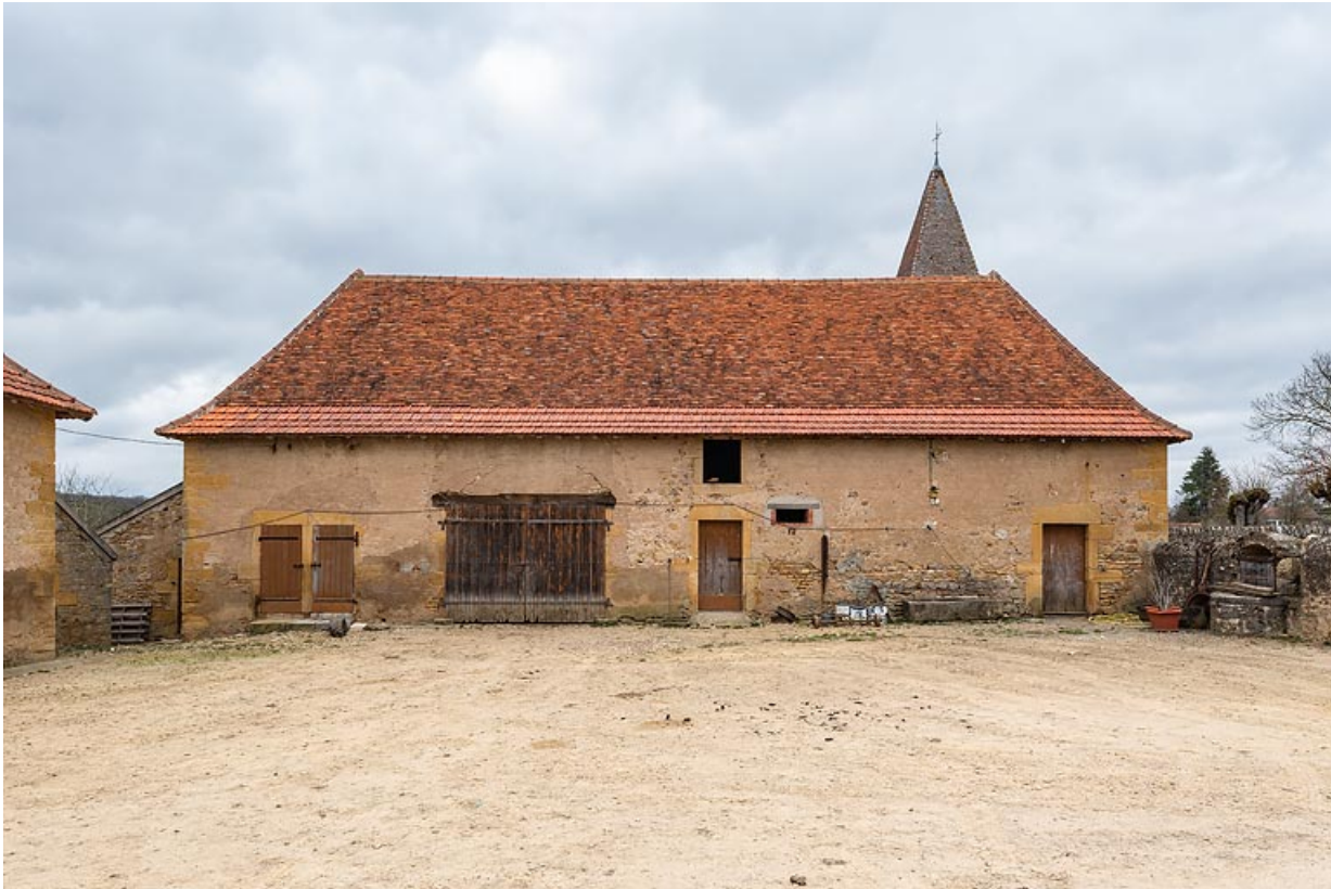
Seconde dépendance, abritant notamment une remise et des soues à cochons