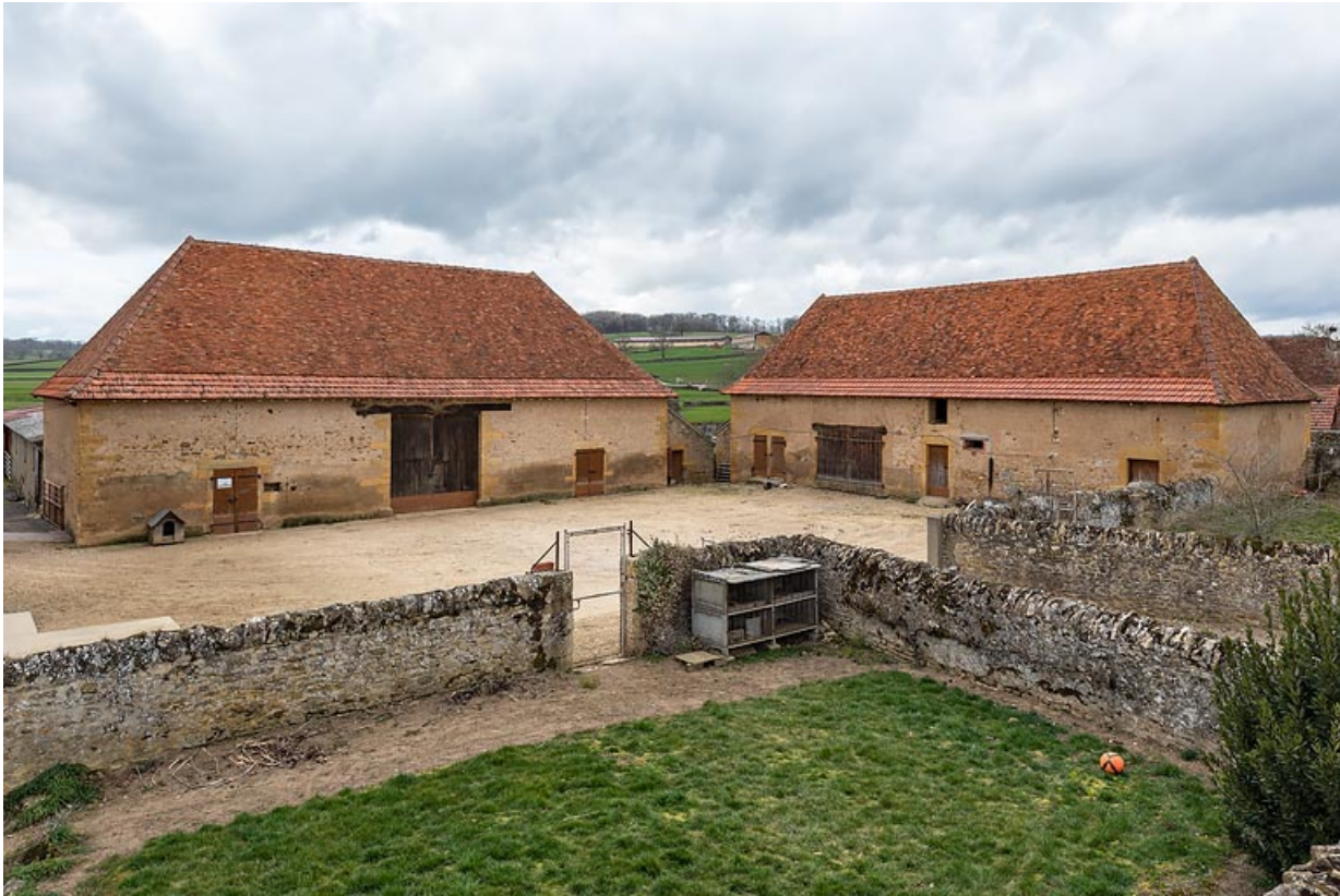
Vue de la grange, à l'ouest, et de la seconde dépendance, au nord de la cour 71, Changy, lieudit : le Vieux Bourg