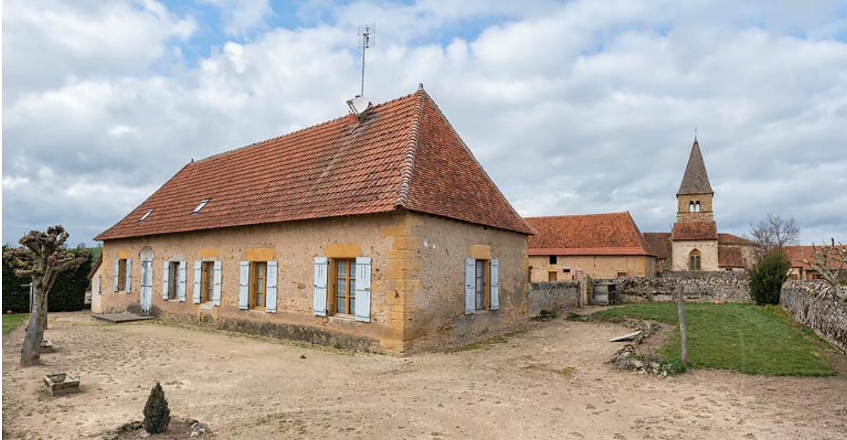
Façade postérieure de la maison. A l'arrière-plan, l'ancienne église paroissiale de Changy. 71, Changy, lieudit : le Vieux Bourg

N° de l'illustration : 20197100753NUC4AQ