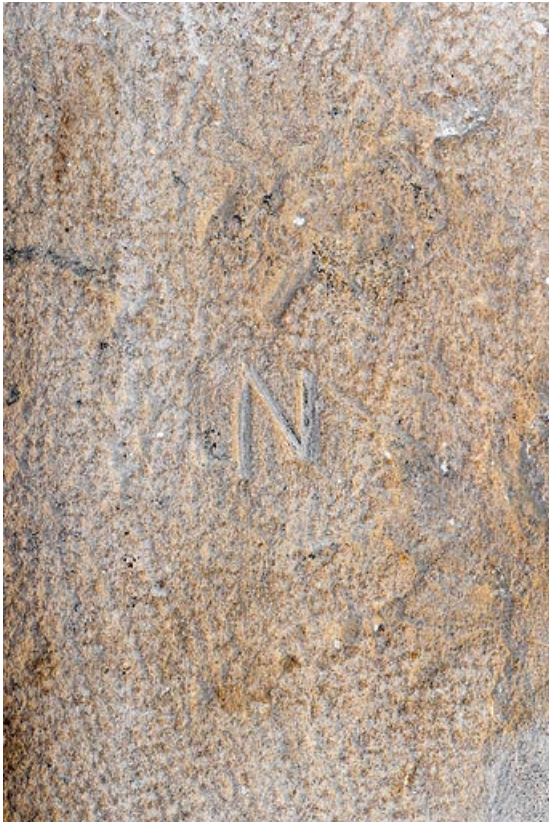
Pierre avec marque de tâcheron, dans l'encadrement d'une porte, à l'intérieur de la maison 71, Changy, lieudit : le Vieux Bourg