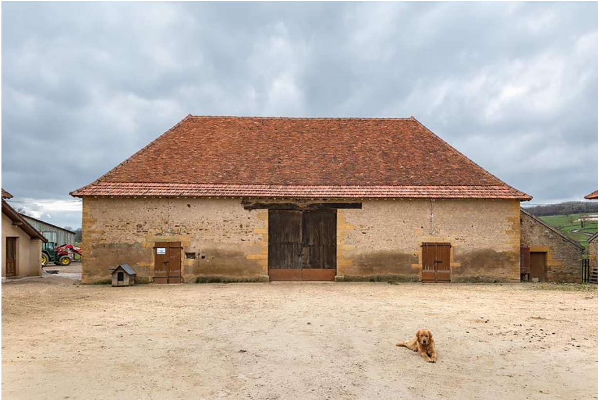
Grange, au fond de la cour, abritant une remise et deux étables doubles