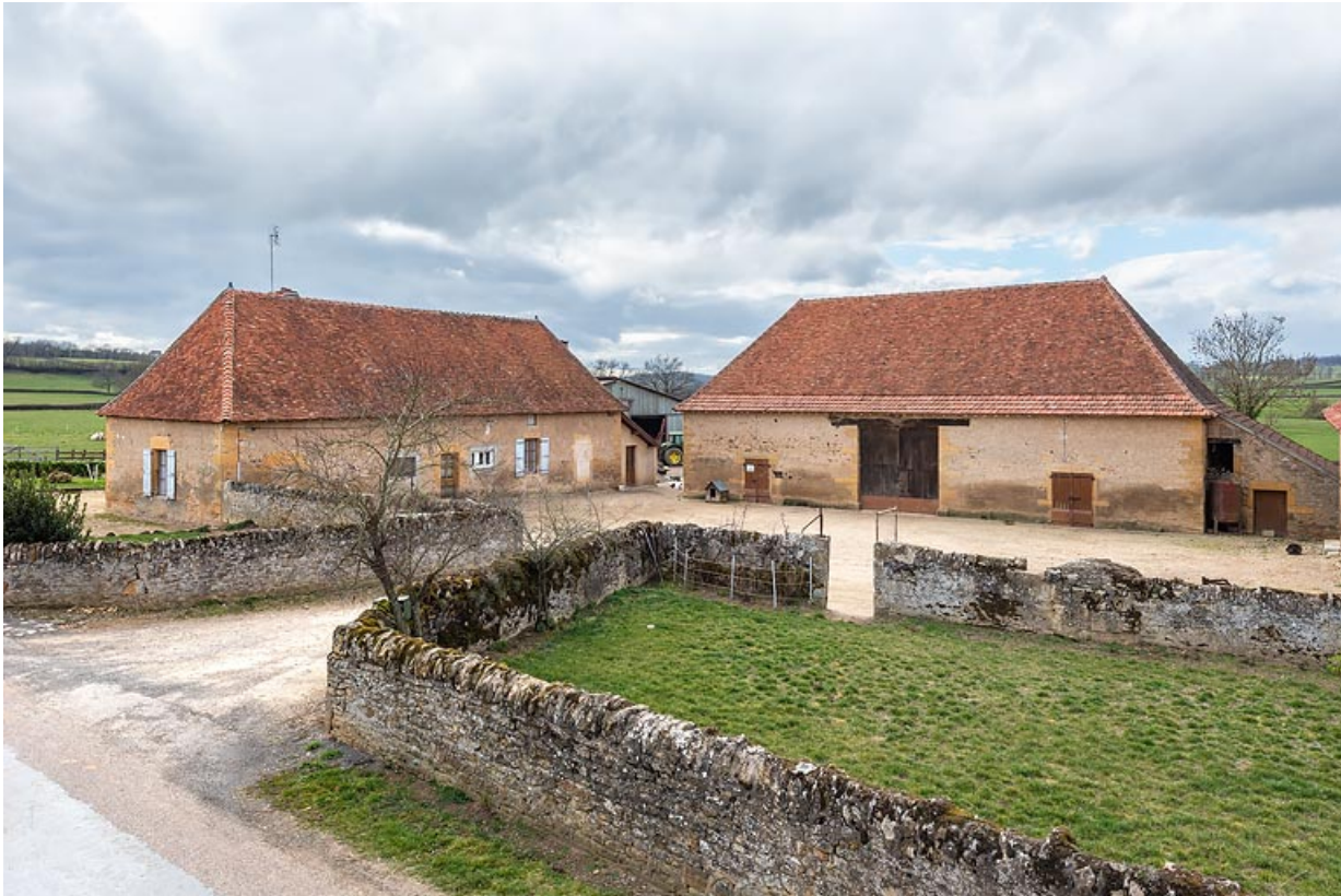
Vue de la maison, au sud, et de la grange, au fond de la cour, à l'ouest.