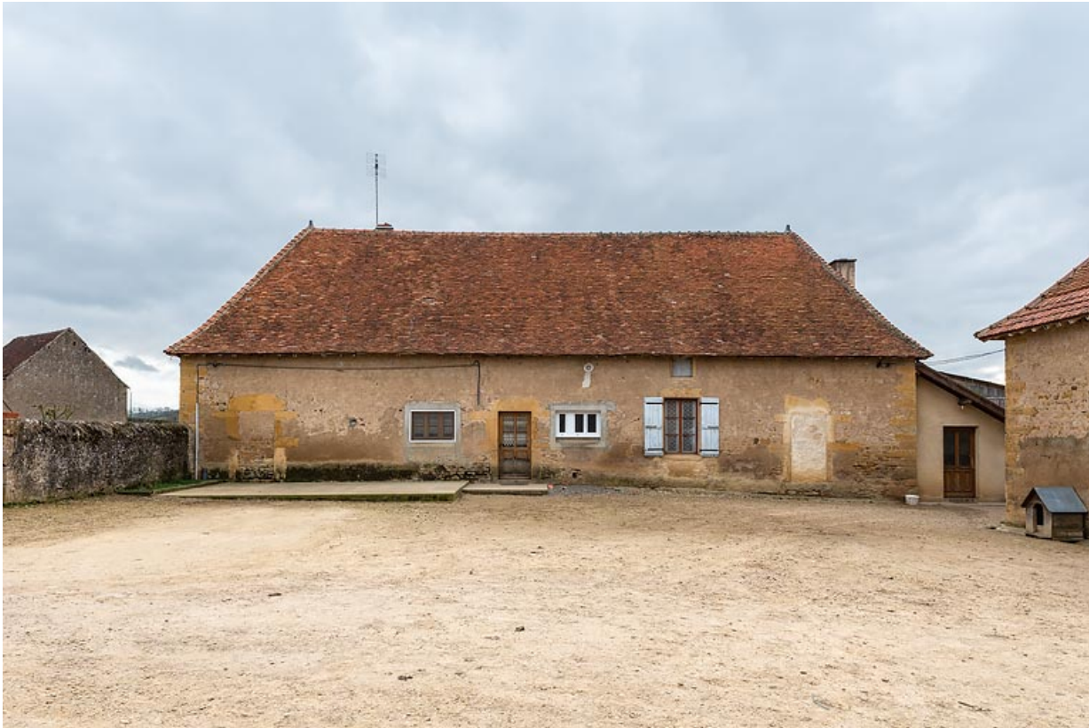
Vue de la façade antérieure de la maison