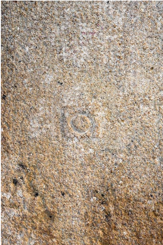
Pierre avec marque de tâcheron dans l'encadrement d'une porte, à l'intérieur de la maison 71, Changy, lieudit : le Vieux Bourg