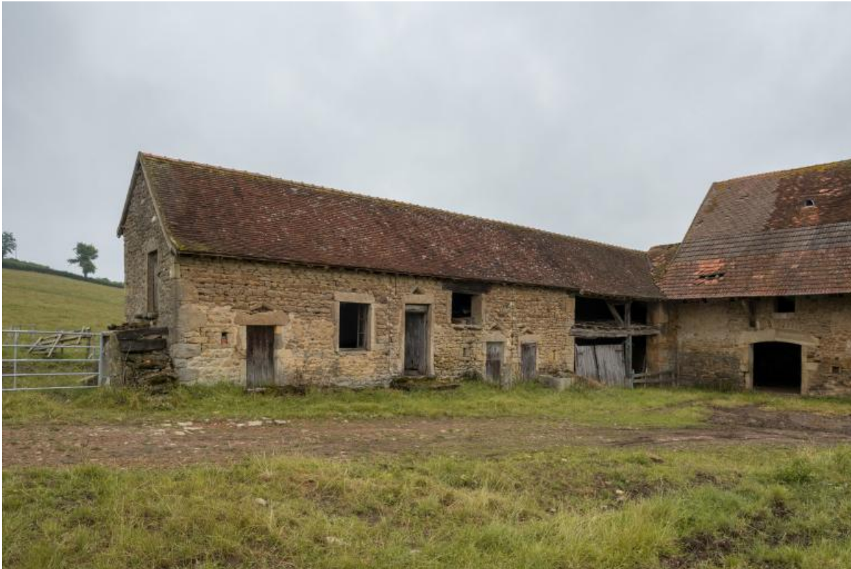
Vue du bâtiment de dépendance secondaire abritant notamment les soues à cochons et le fournil