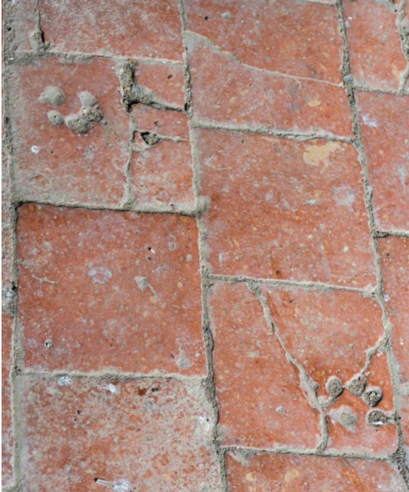
Sol de la cuisine en carreau de terre cuite