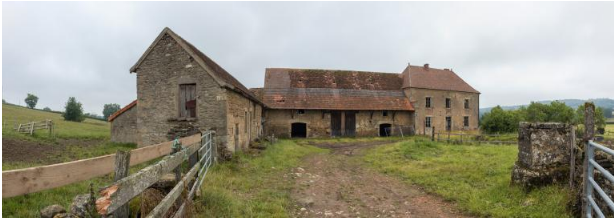
Vue d'ensemble de la ferme

N° de l'illustration : 20187100232NUC2AQ