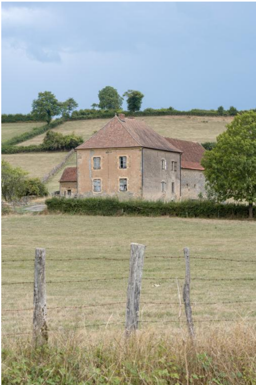
Vue de la ferme au nord-est