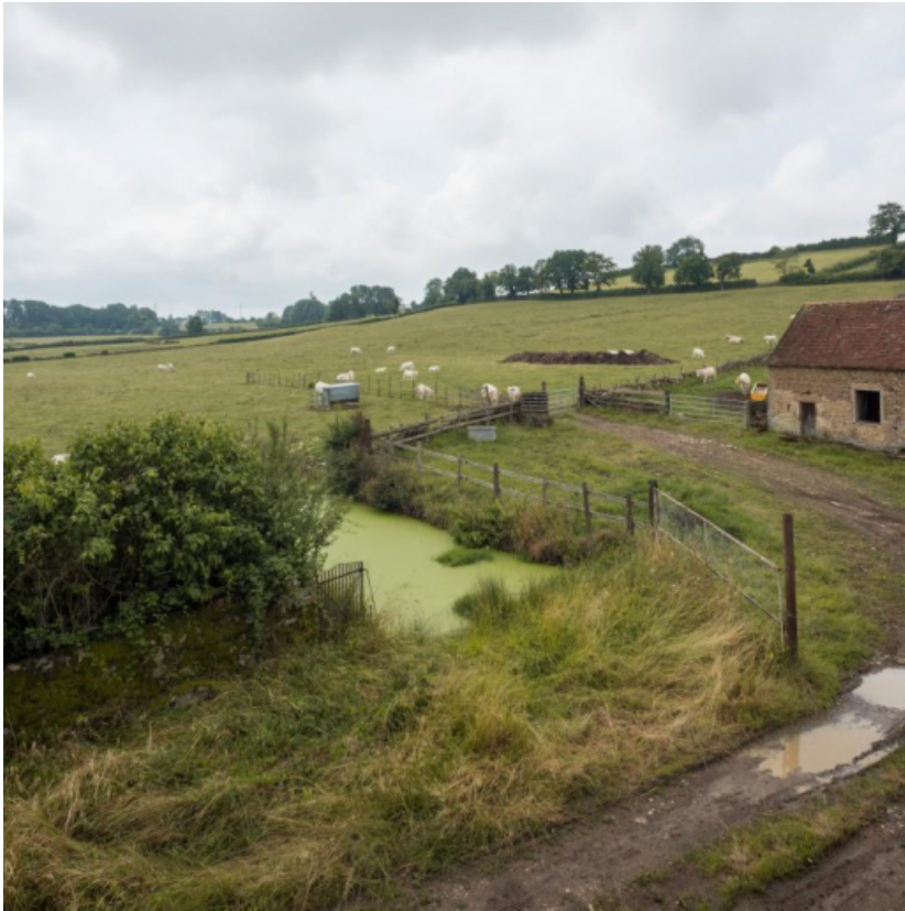
Vue sur la cour de la ferme avec la mare pour abreuver le bétail