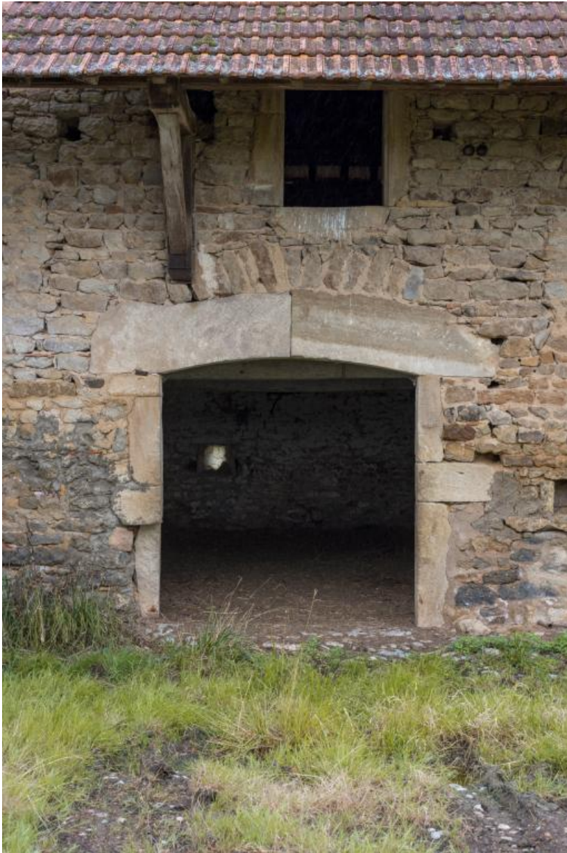
Détail de la grange : ouverture du fenil et porte d'étable