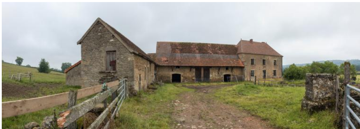
Vue d'ensemble de la ferme

N° de l'illustration : 20187100232NUC2AQ