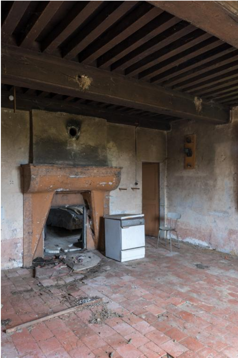
Ancienne cuisine, ornée d'une cheminée avec un double foyer à l'origine divisé par un plaque de fonte, l'un donnant dans la pièce principale, l'autre dans la pièce secondaire voisine.