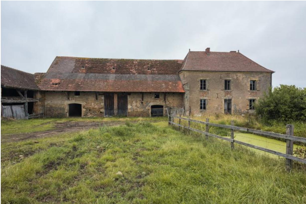
Façade antérieure des bâtiments principaux : grange et maison