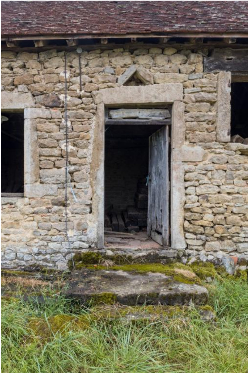
Détail de la dépendance secondaire : porte d'entrée du fournil