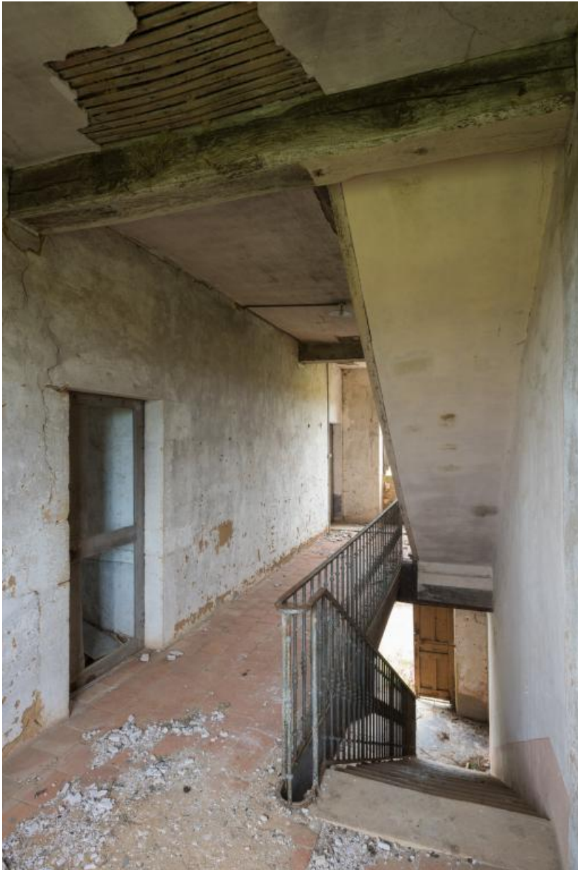
Escalier de la maison, à deux volées droites