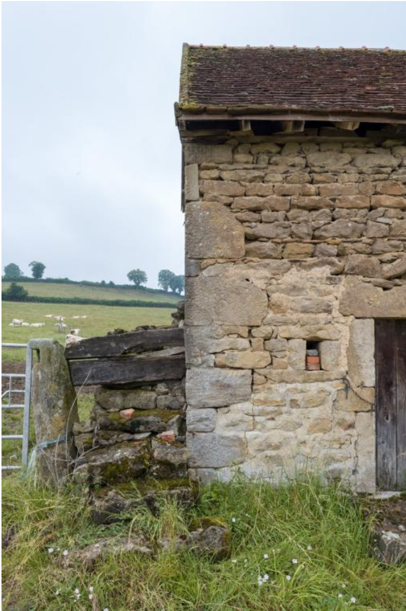
Détail de la dépendance secondaire : escalier permettant l'accès au grenier 71, Amanzé, lieudit : Grange Plassard