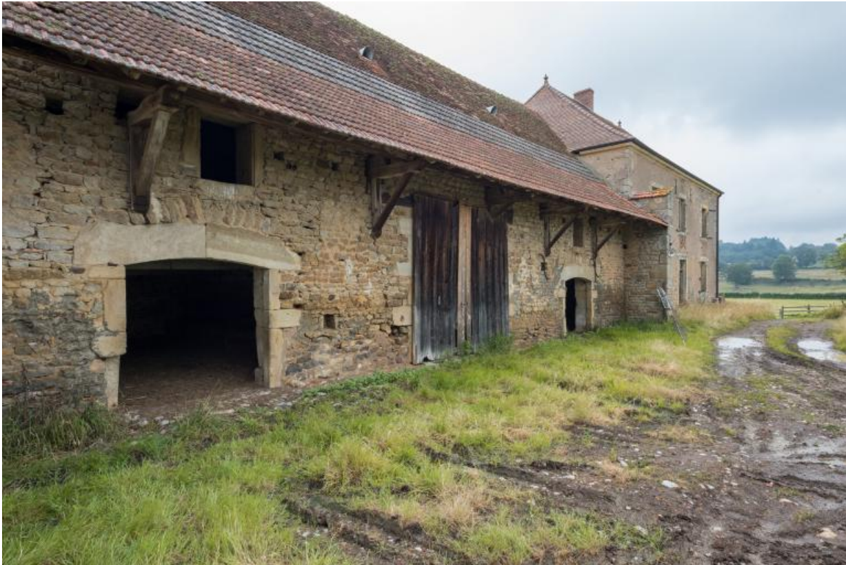
Vue de la grange avec son large débord de toit