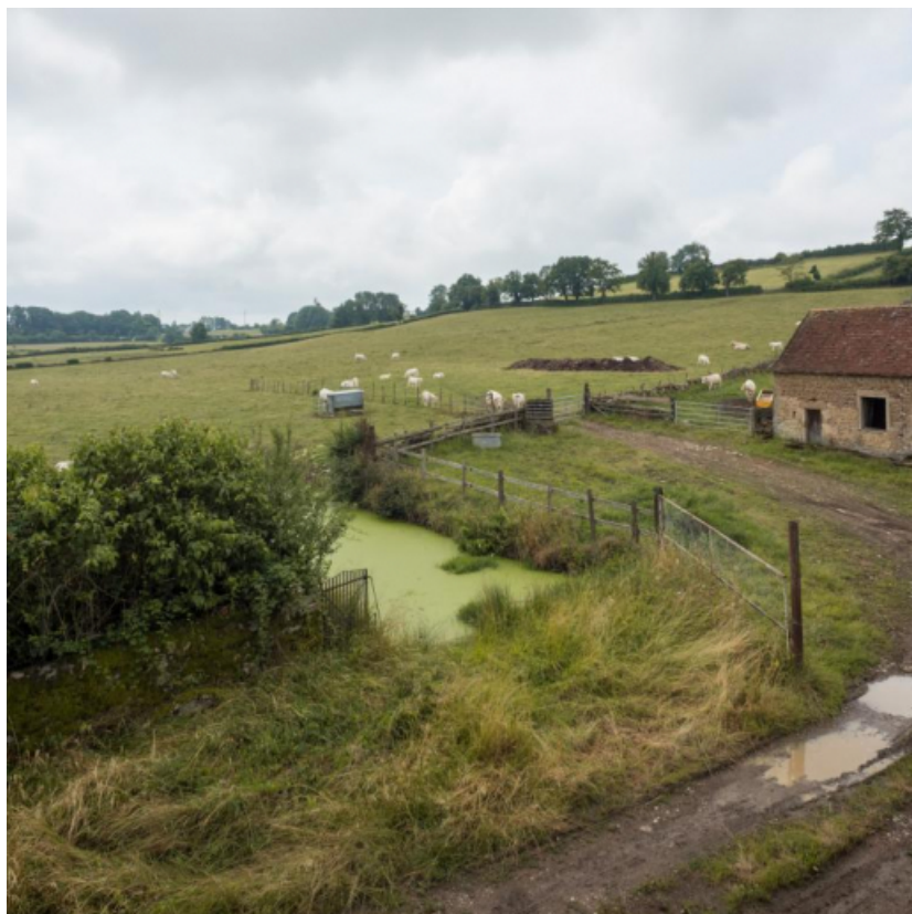
Vue sur la cour de la ferme avec la mare pour abreuver le bétail