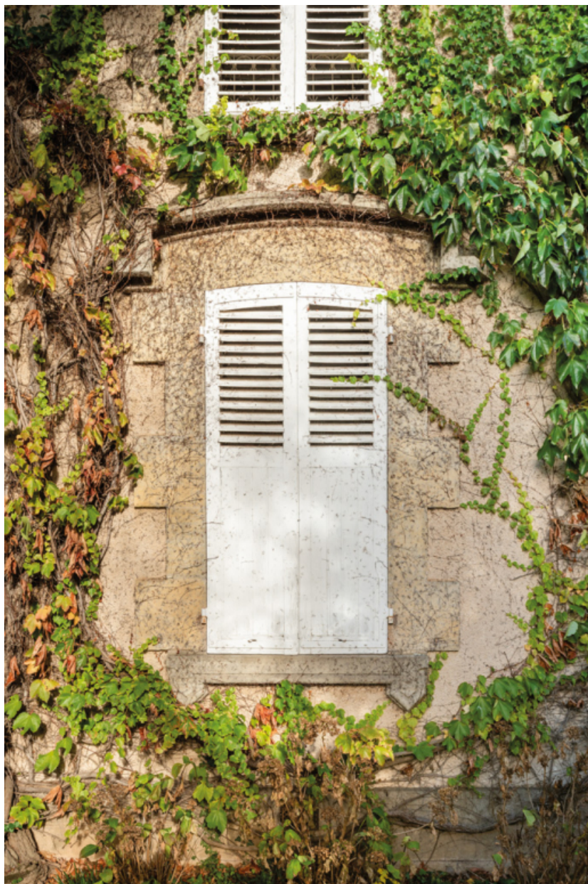
Logis. Fenêtre sur le pignon sud.

71, Saint-Laurent-en-Brionnais, lieudit : Le Bourg