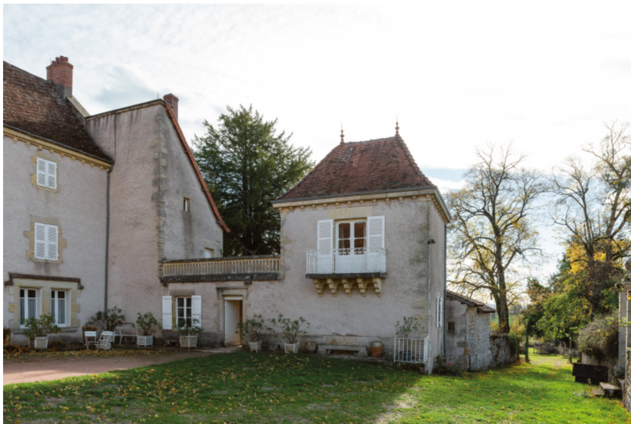
Aile sud du logis et pavillon ouest.

71, Saint-Laurent-en-Brionnais, lieudit : Le Bourg