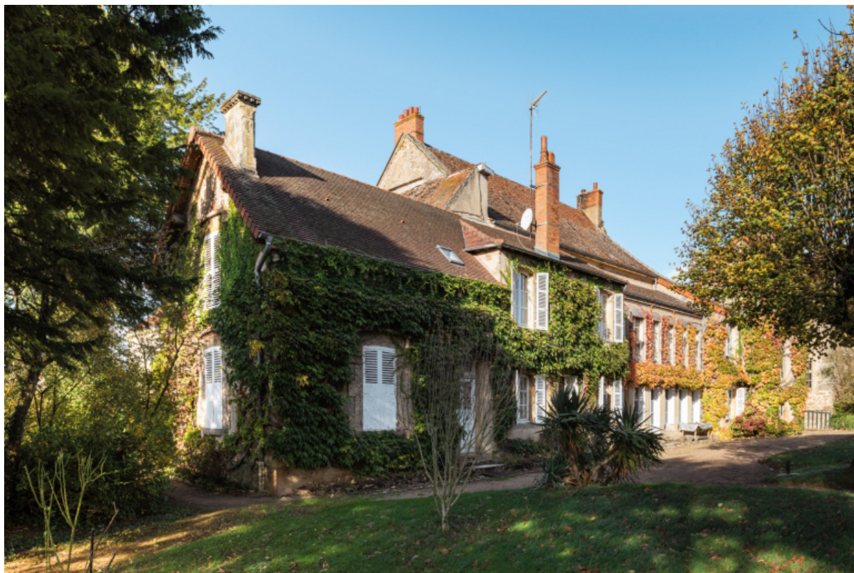
Le logis vu depuis le sud-ouest.

71, Saint-Laurent-en-Brionnais, lieudit : Le Bourg