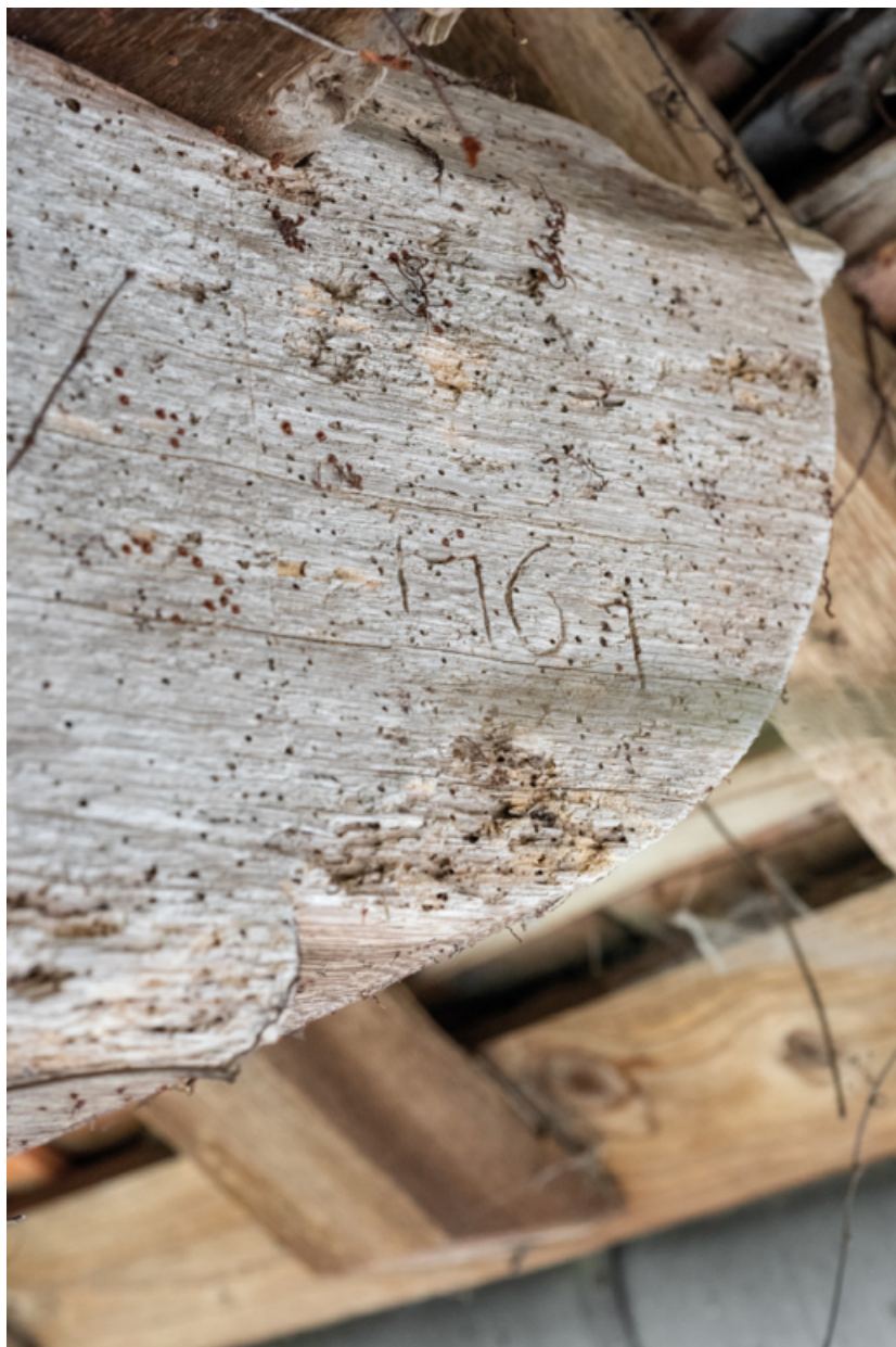
Bâtiment agricole nord. Date gravée sur un entrain de la charpente.

71, Saint-Laurent-en-Brionnais, lieudit : Le Bourg