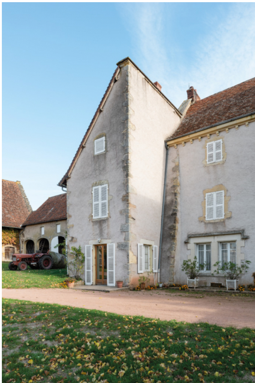
Aile nord et façade du logis.

71, Saint-Laurent-en-Brionnais, lieudit : Le Bourg