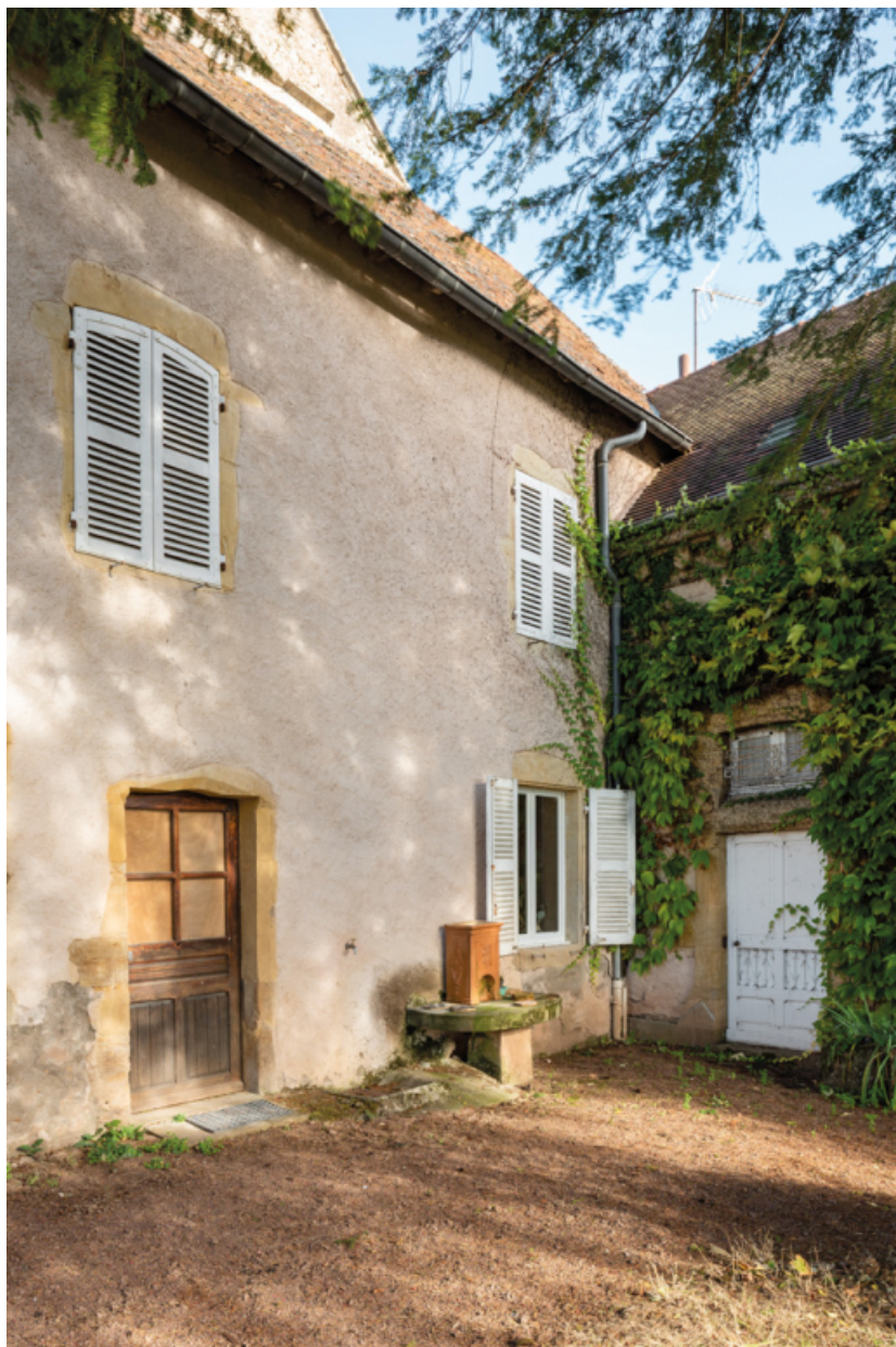
Façade de l'aile sud du logis.

71, Saint-Laurent-en-Brionnais, lieudit : Le Bourg