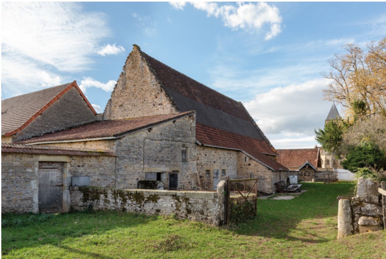
Façades postérieures des bâtiments agricoles.

71, Saint-Laurent-en-Brionnais, lieudit : Le Bourg