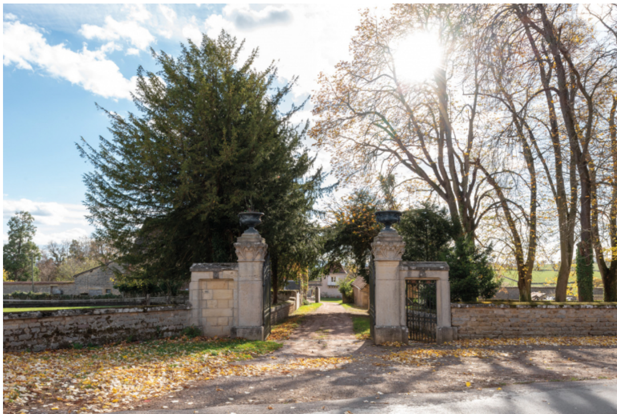
Entrée de l'allée menant à la ferme.

71, Saint-Laurent-en-Brionnais, lieudit : Le Bourg