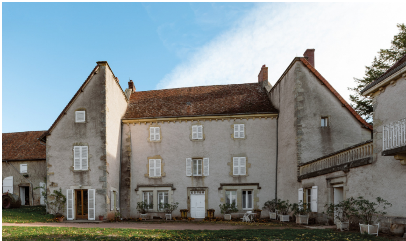
Le logis vu depuis l'ouest.

71, Saint-Laurent-en-Brionnais, lieudit : Le Bourg