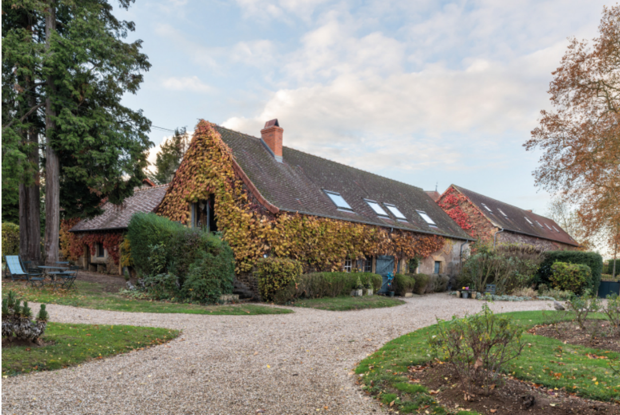
Vue des dépendances dont le bâtiment abritant l'ancien fournil au premier plan