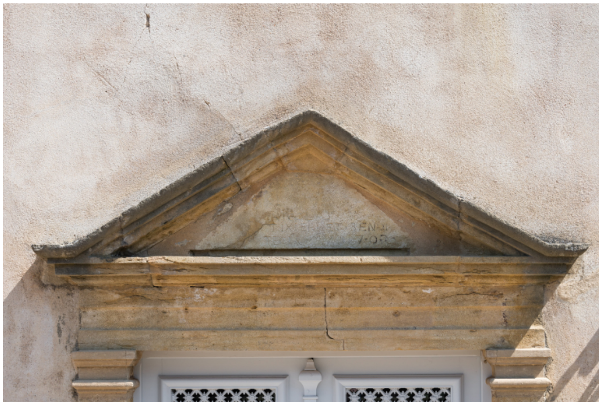
Fronton triangulaire surmontant la porte d'entrée : vue rapprochée.

71, Saint-Didier-en-Brionnais, lieudit : La Grande Terre