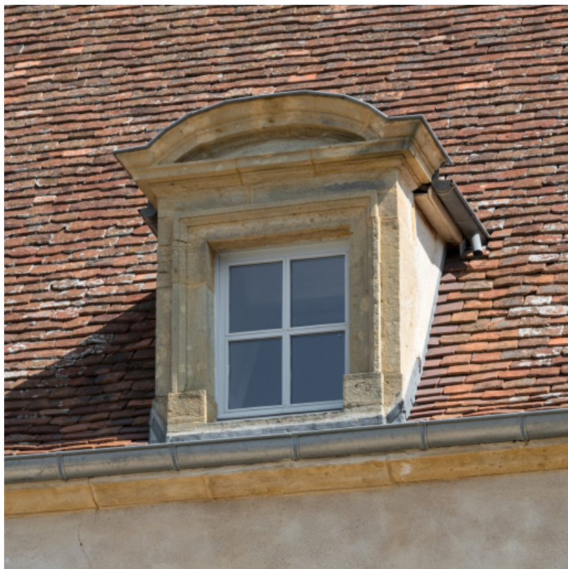
Vue rapprochée de la lucarne centrale sur la façade antérieure.

71, Saint-Didier-en-Brionnais, lieudit : La Grande Terre