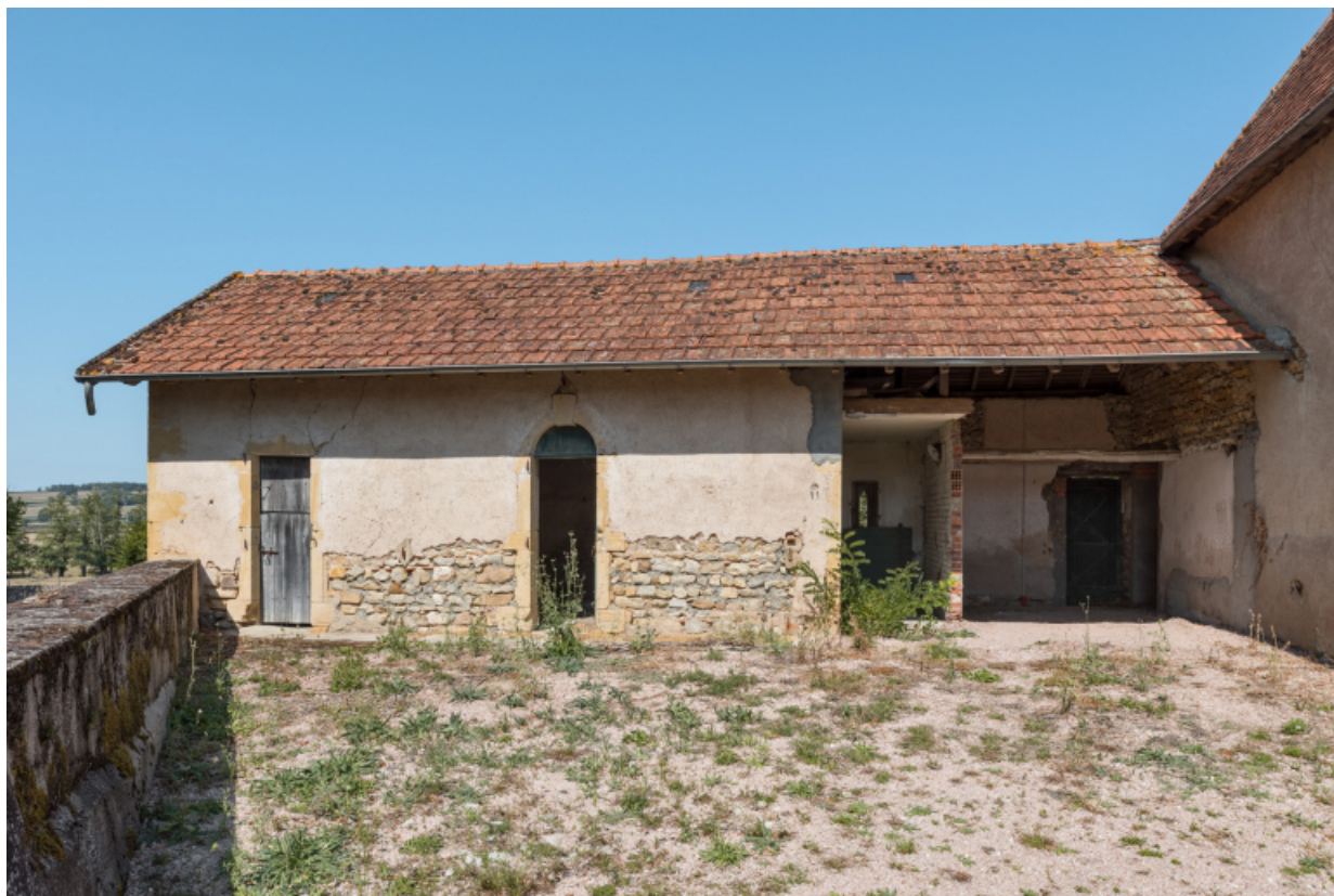
Façade antérieure (sud-est) au sud-ouest de la ferme.

71, Saint-Didier-en-Brionnais, lieudit : La Grande Terre