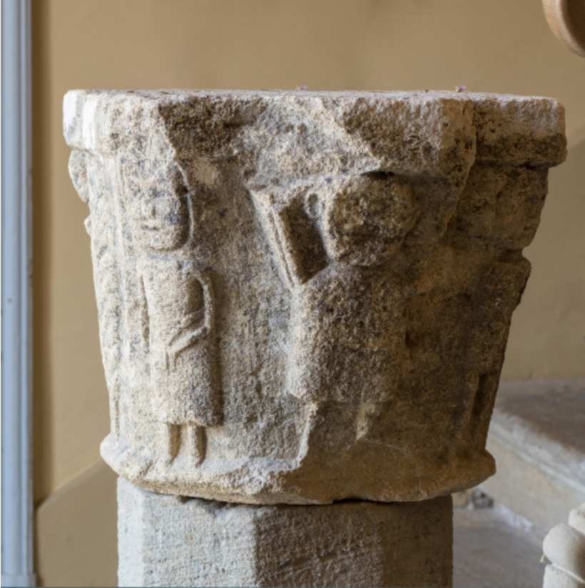
Détail de chapiteau sculpté.

71, Saint-Didier-en-Brionnais, lieudit : La Grande Terre