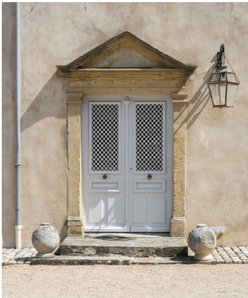
La porte d'entrée sur la façade antérieure : vue rapprochée.

71, Saint-Didier-en-Brionnais, lieudit : La Grande Terre