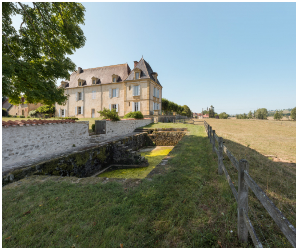
Vue de trois-quart de la façade postérieure du chateau, et des bassins d'irrigation des prés sous-jacents.

71, Saint-Didier-en-Brionnais, lieudit : La Grande Terre