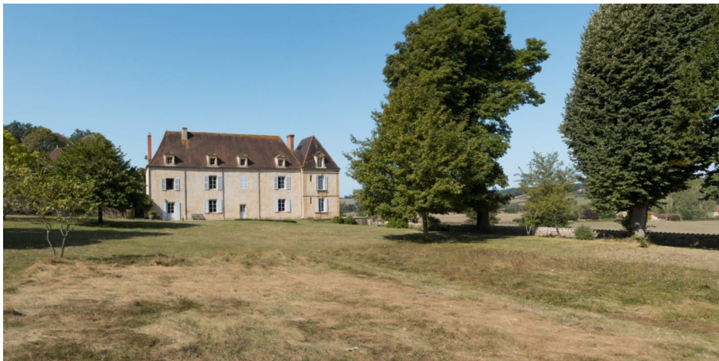
Vue d'ensemble du chateau depuis le parc au nord-est. Façade postérieure.

71, Saint-Didier-en-Brionnais, lieudit : La Grande Terre