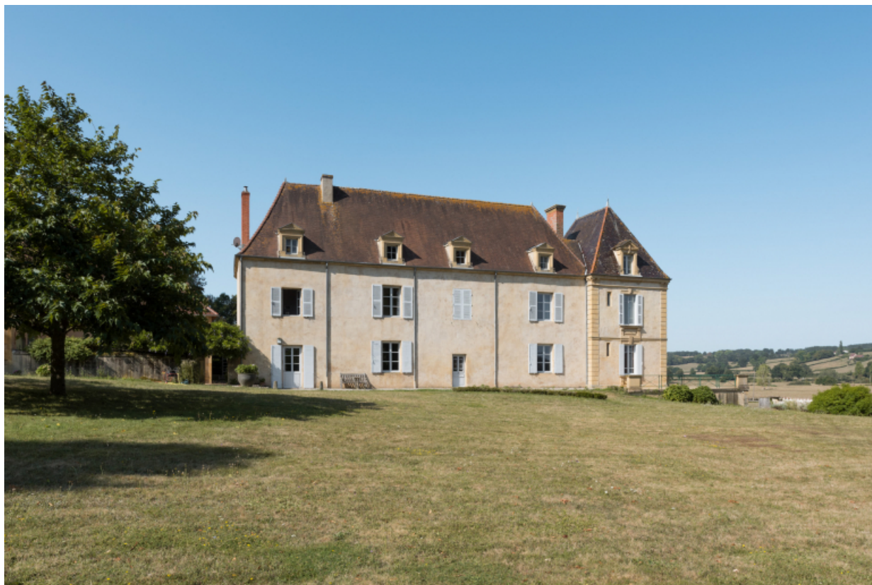
Vue du château depuis le parc au nord-est. Façade postérieure.

71, Saint-Didier-en-Brionnais, lieudit : La Grande Terre