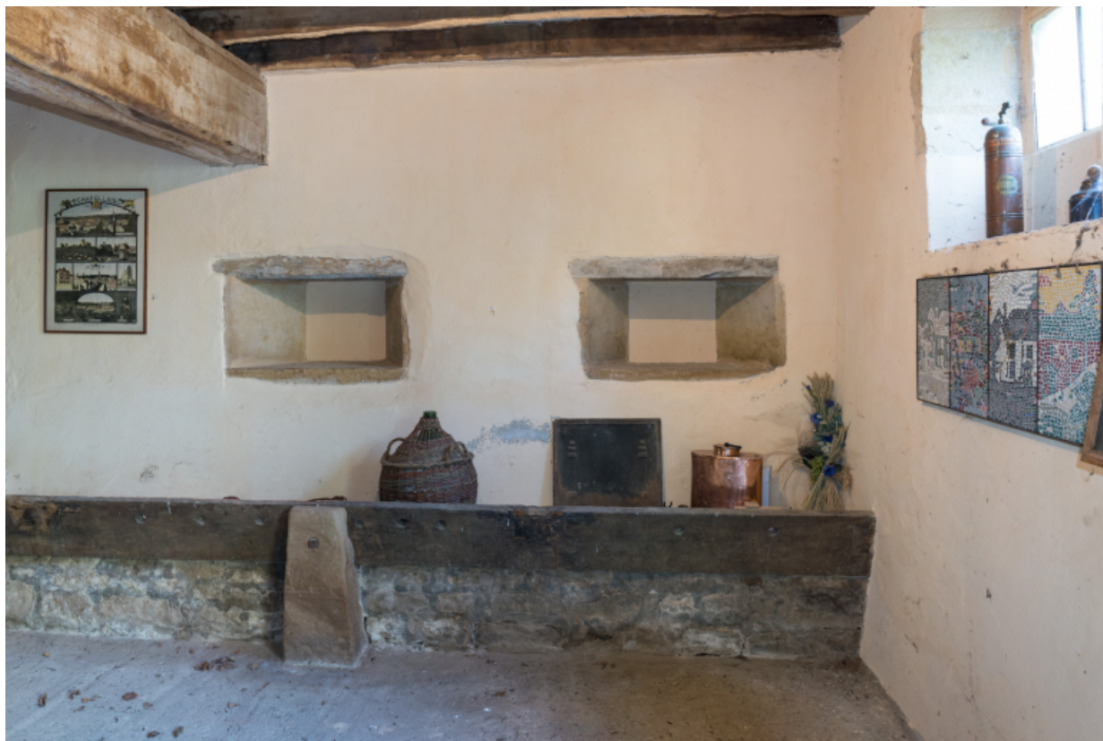
Vue intérieure des anciennes étables.

71, Saint-Didier-en-Brionnais, lieudit : La Grande Terre