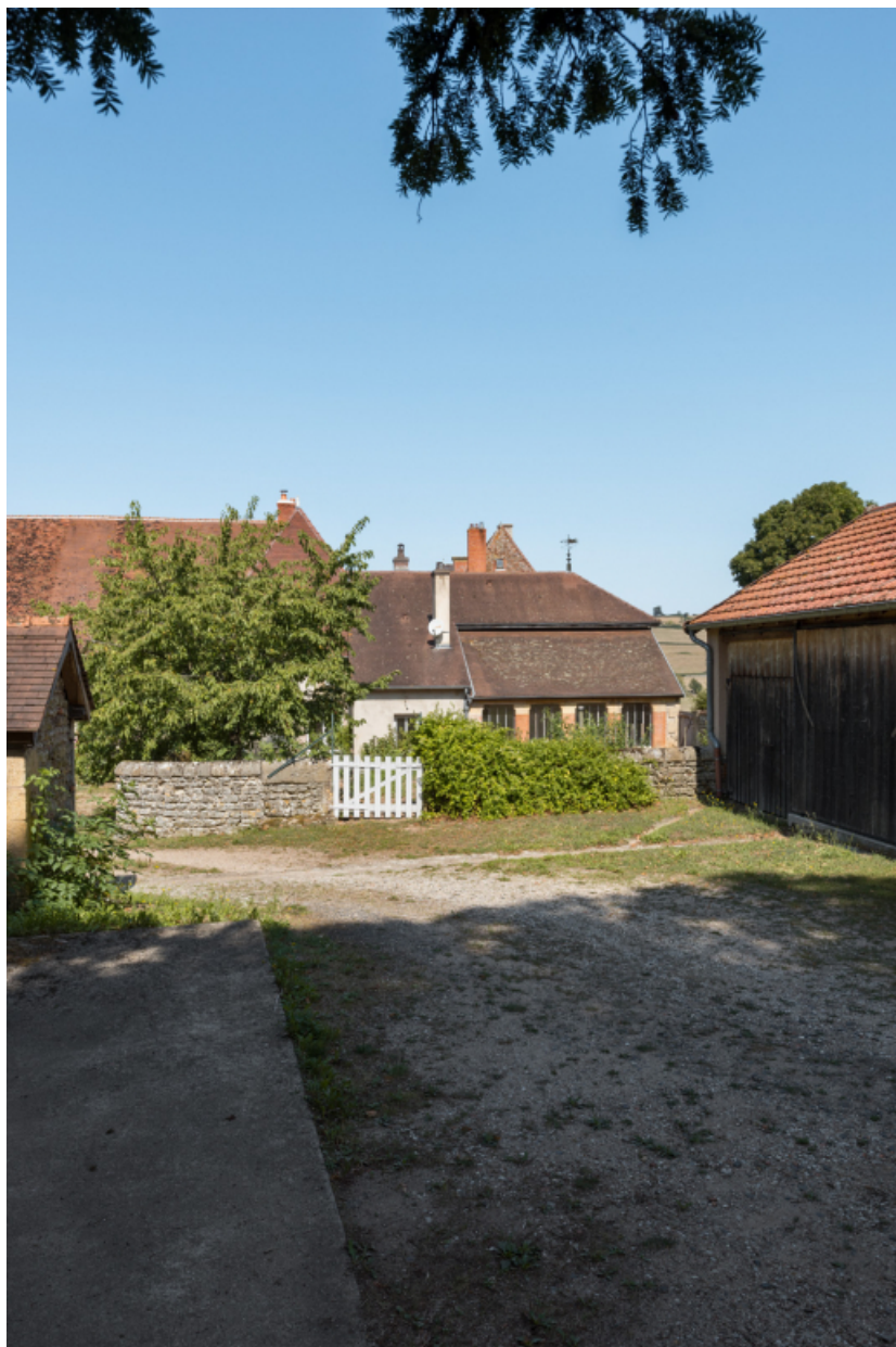
Vue d'ensemble sur les édifices au sud-est du château et le jardin d'hiver.

71, Saint-Didier-en-Brionnais, lieudit : La Grande Terre