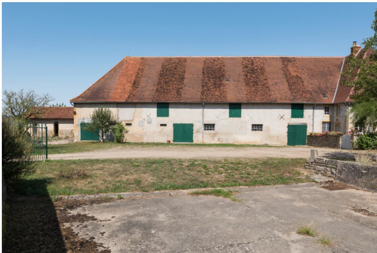
Facade postérieure (sud-est) de la ferme.

71, Saint-Didier-en-Brionnais, lieudit : La Grande Terre