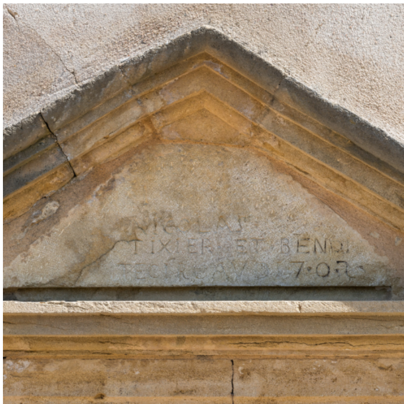
Fronton triangulaire surmontant la porte d'entrée : vue de détail de l'inscription.

71, Saint-Didier-en-Brionnais, lieudit : La Grande Terre