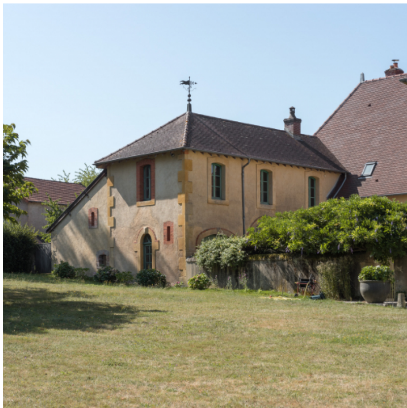
Vue rapprochée de trois-quart de la façade orientale de la dépendance.

71, Saint-Didier-en-Brionnais, lieudit : La Grande Terre