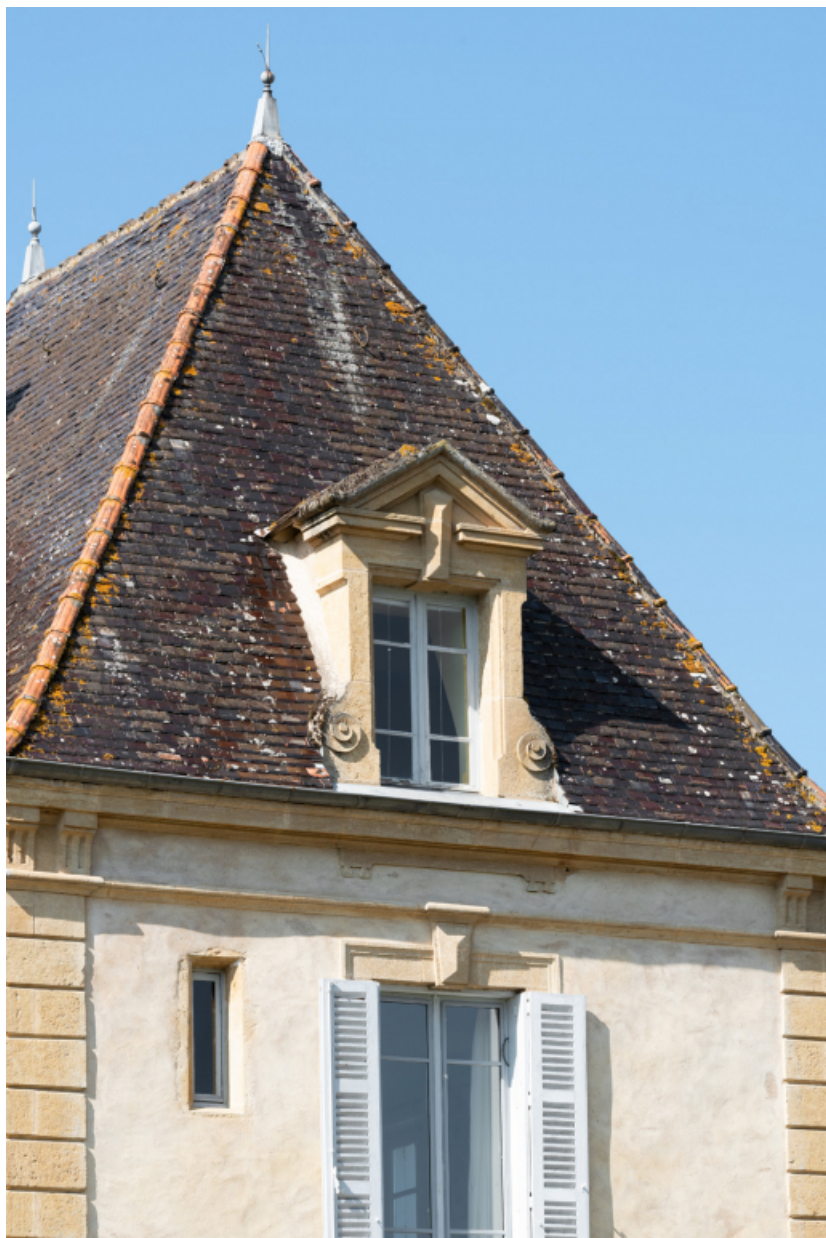
Vue de détail du pavillon nord-ouest vu de l'est.

71, Saint-Didier-en-Brionnais, lieudit : La Grande Terre