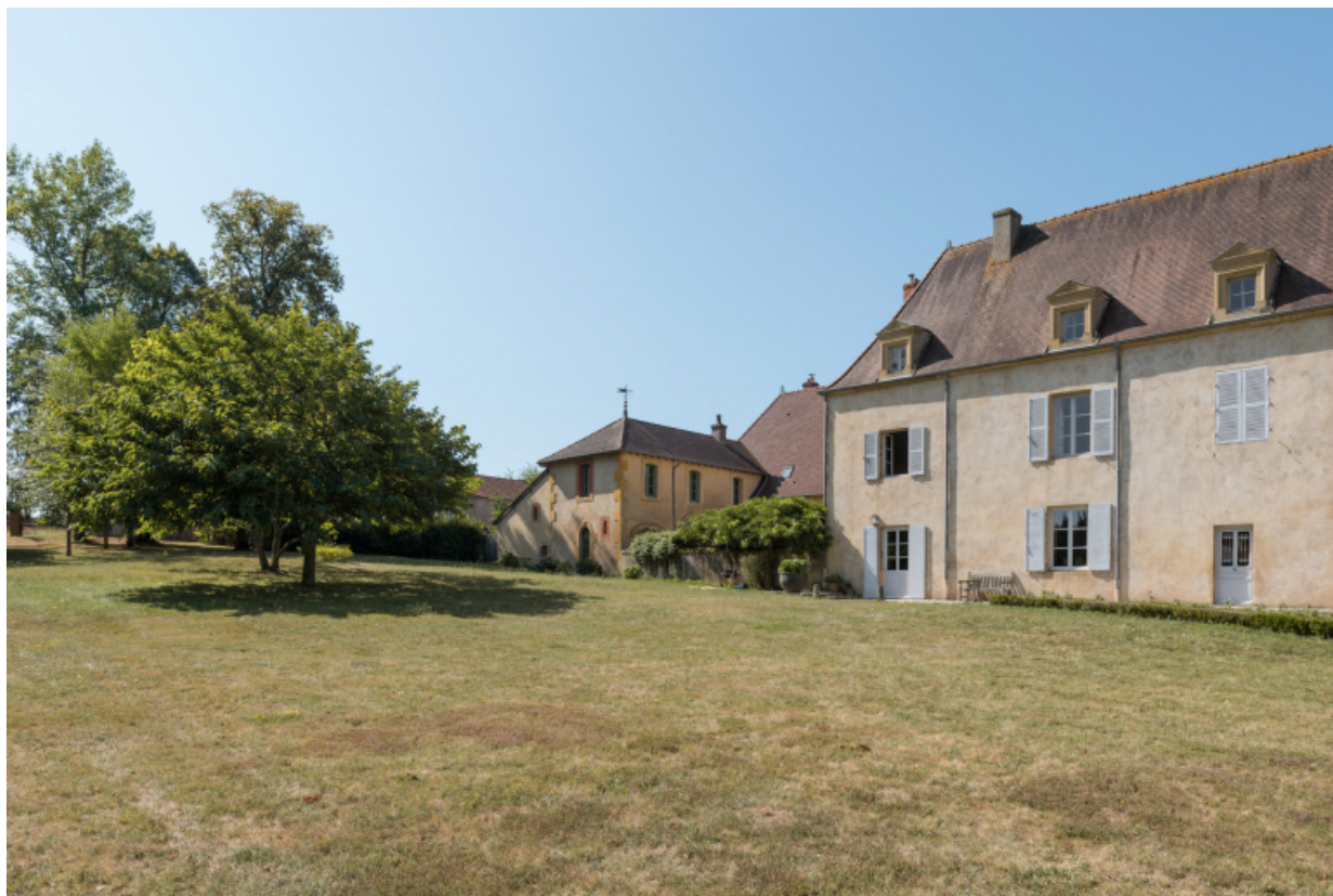
Vue d'ensemble des façades orientales postérieures.

71, Saint-Didier-en-Brionnais, lieudit : La Grande Terre