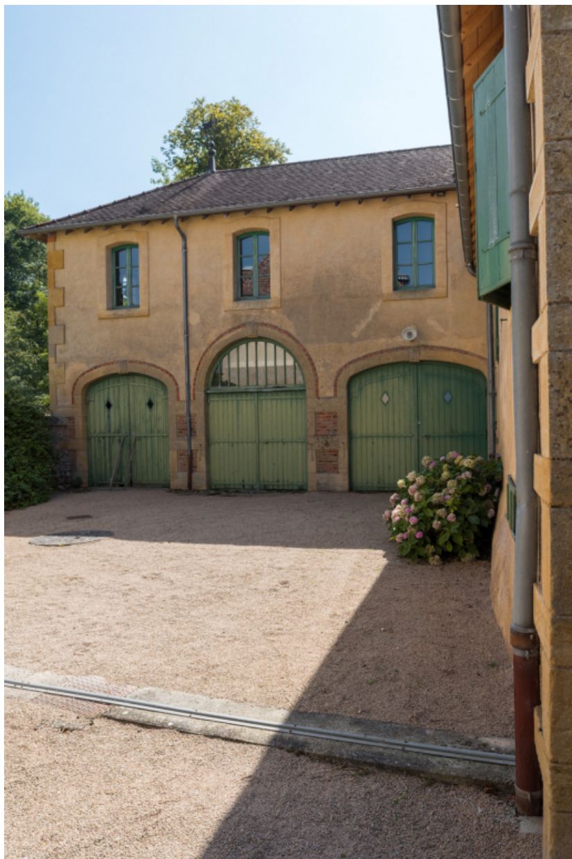
Vue de l'aile nord-est des dépendances agricoles : façade nord-ouest à trois portes.

71, Saint-Didier-en-Brionnais, lieudit : La Grande Terre