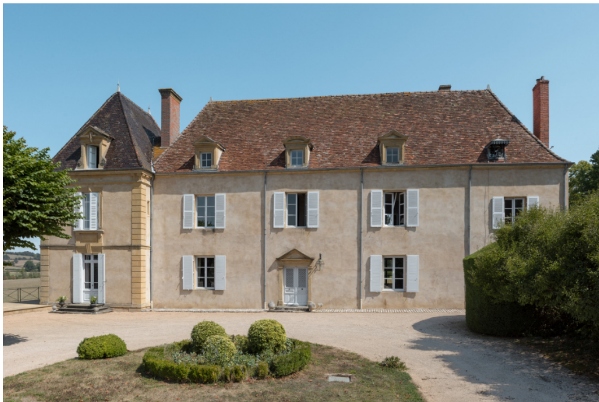
La façade antérieure : vue d'ensemble.

71, Saint-Didier-en-Brionnais, lieudit : La Grande Terre