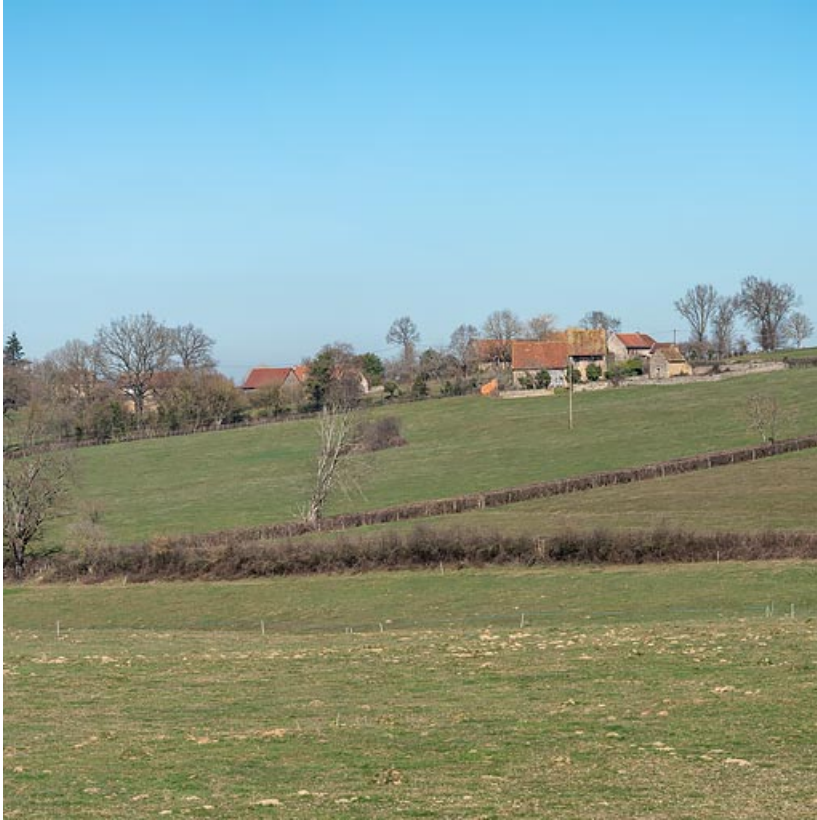
La ferme, au sommet du coteau, et à l'arrière-plan le hameau du Crot de Perche. 71, Varenne-l'Arconce, lieudit : Les Crots de Perche

N° de l'illustration : 20197100766NUC4AQ