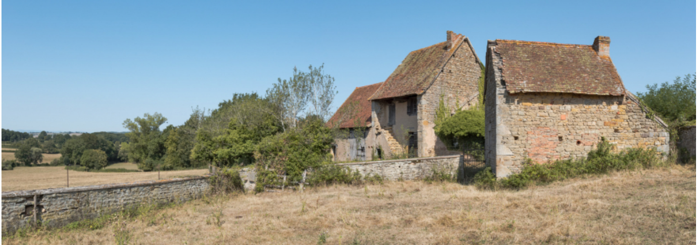
Vue d'ensemble depuis le sud-est des façades antérieures de la maison.

N° de l'illustration : 20187100385NUC4AQ