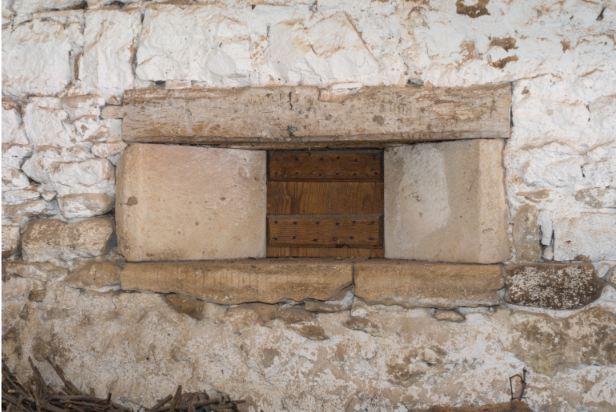
Vue rapprochée d'une baie -dite feuron- ménagée dans la cloison entre la grange et l'étable.

71, Amanzé, lieudit : La Grange Plassard