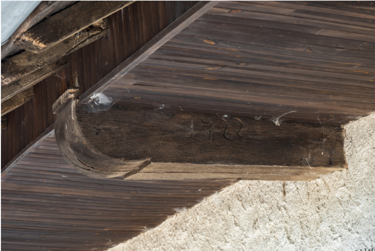
Vue de détail de la date 1722 sur un élément de charpente.

71, Amanzé, lieudit : La Grange Plassard