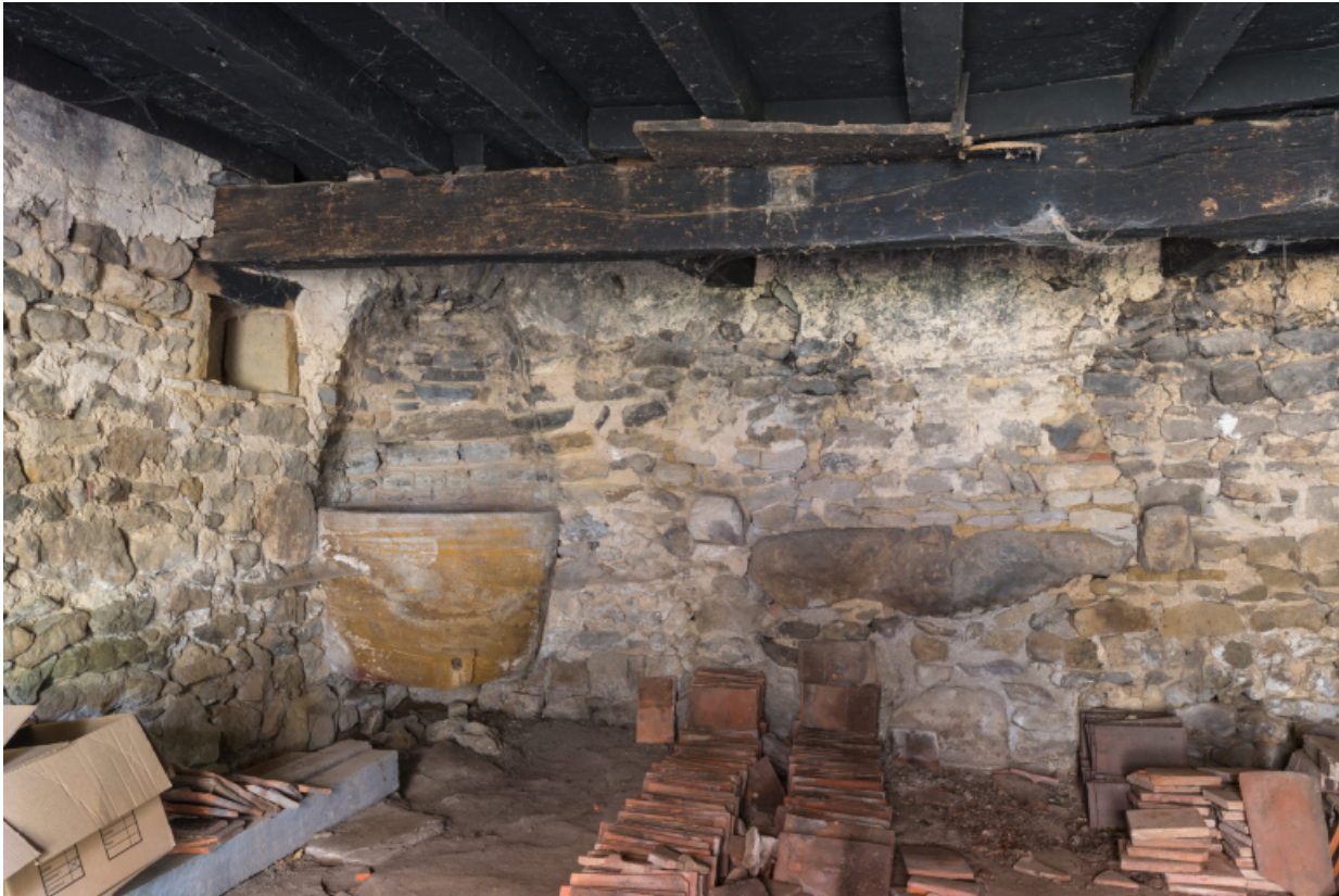
Vue intérieure de la dépendance. Face au mur postérieur sud.

71, Amanzé, lieudit : La Grange Plassard