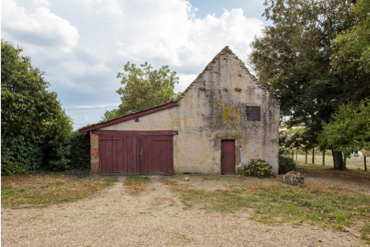
Vue de face de la façade antérieure - nord - des dépendances.

71, Amanzé, lieudit : La Grange Plassard