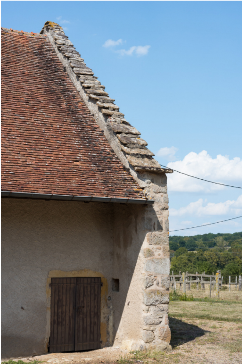
Vue rapprochée du pignon est de la partie agricole.

71, Amanzé, lieudit : La Grange Plassard