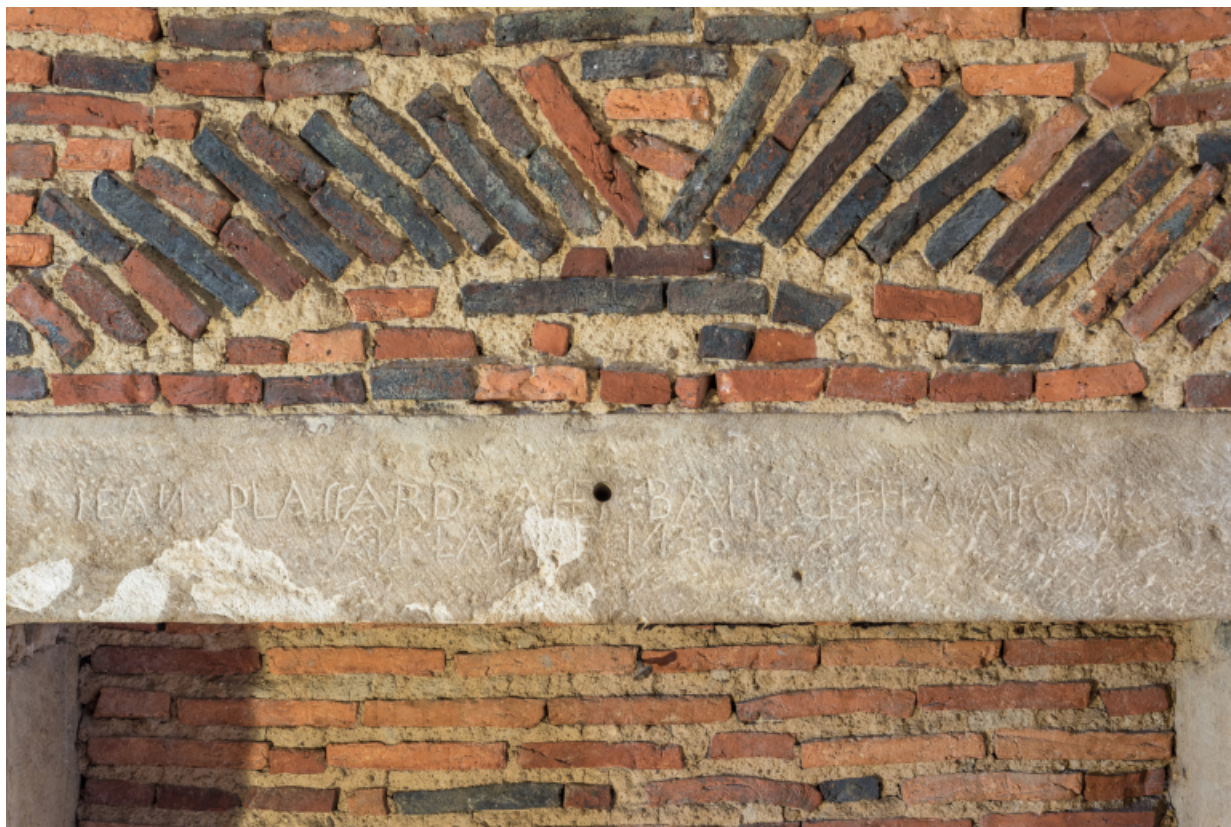
Vue rapprochée : inscription et date portée -1438- sur le couvrement d'une cheminée à l'étage.

71, Amanzé, lieudit : La Grange Plassard