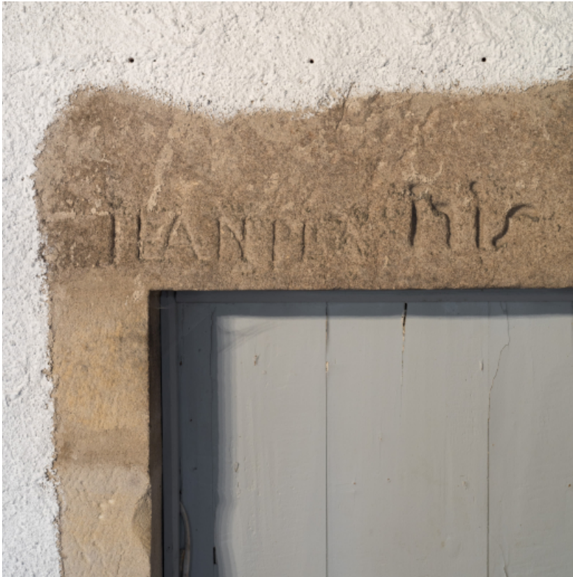
Vue rapprochée d'une inscription et d'une date portée sur un linteau.

71, Amanzé, lieudit : La Grange Plassard