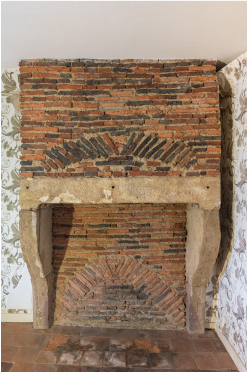
Vue de face de la cheminée de l'étage. inscription et date portée -1438- sur le couvrement. 71, Amanzé, lieudit : La Grange Plassard