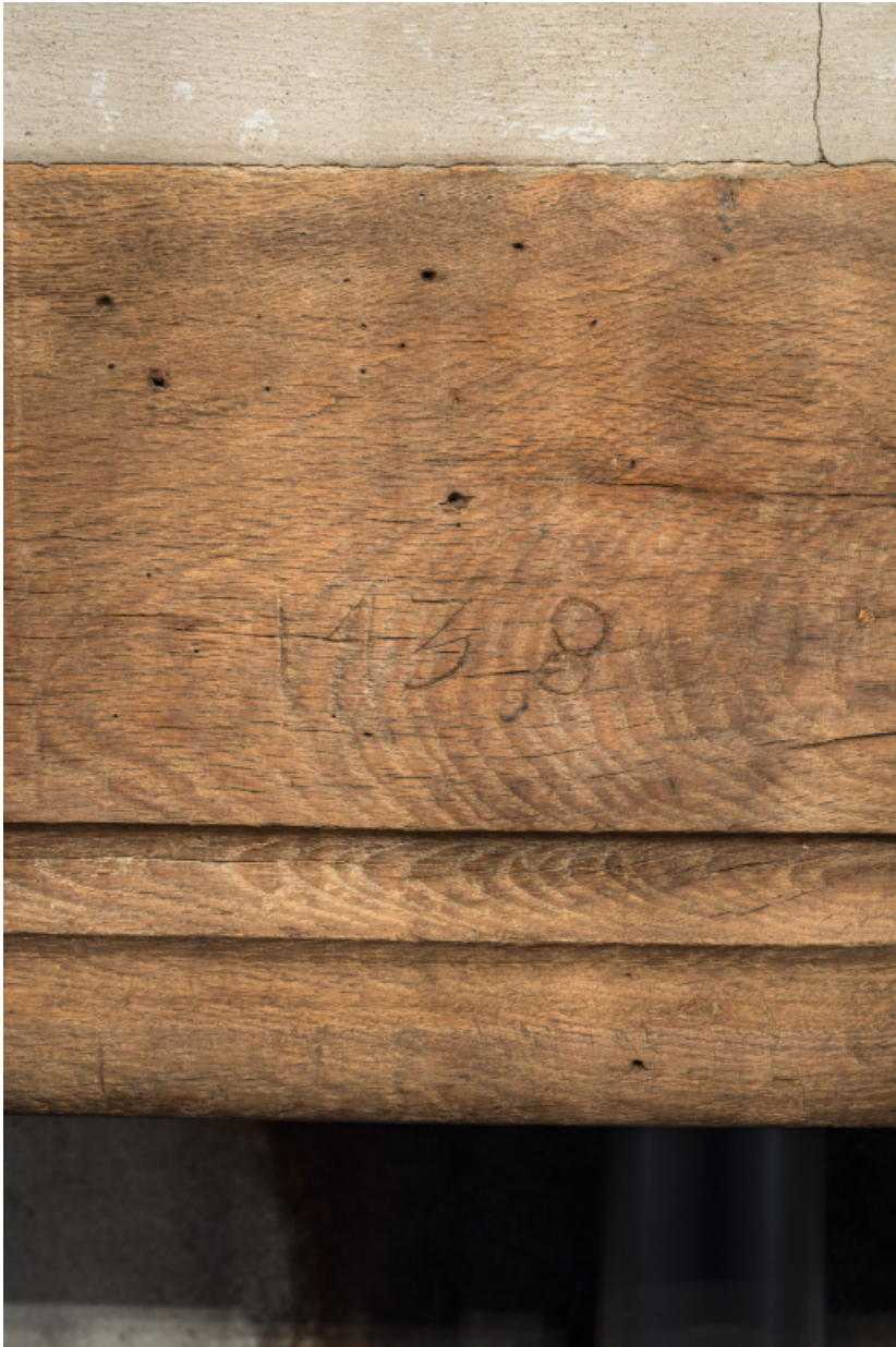
Date portée - 1438 - sur le couverture de la cheminée du rez-de-chaussée.

71, Amanzé, lieudit : La Grange Plassard