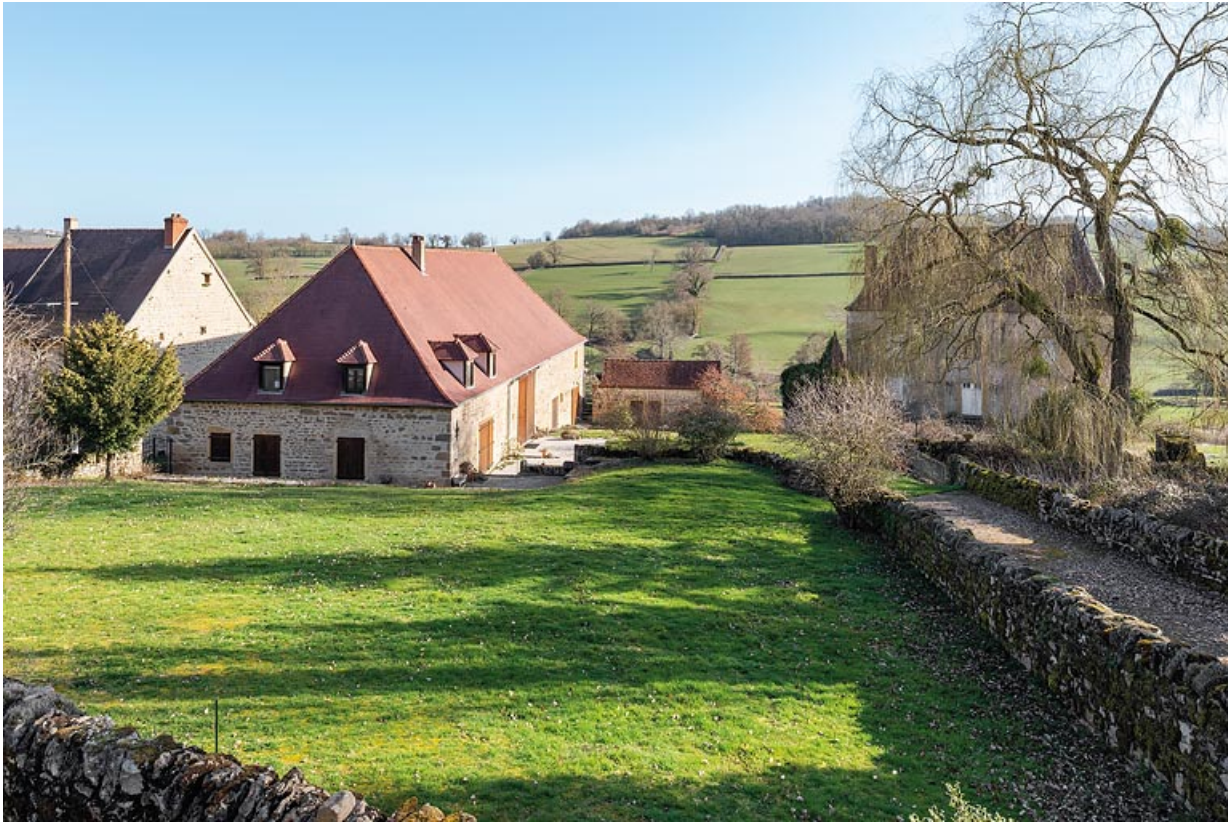
Vue de la ferme avec l'ancienne grange et l'allée menant à la demeure, qui sépare la cour de ferme du jardin potager. 71, Oyé, lieudit : Orval