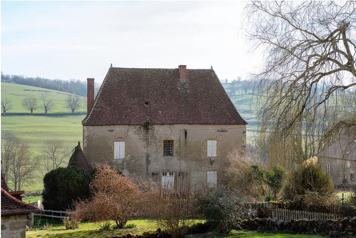
Vue de la façade antérieure de la maison.