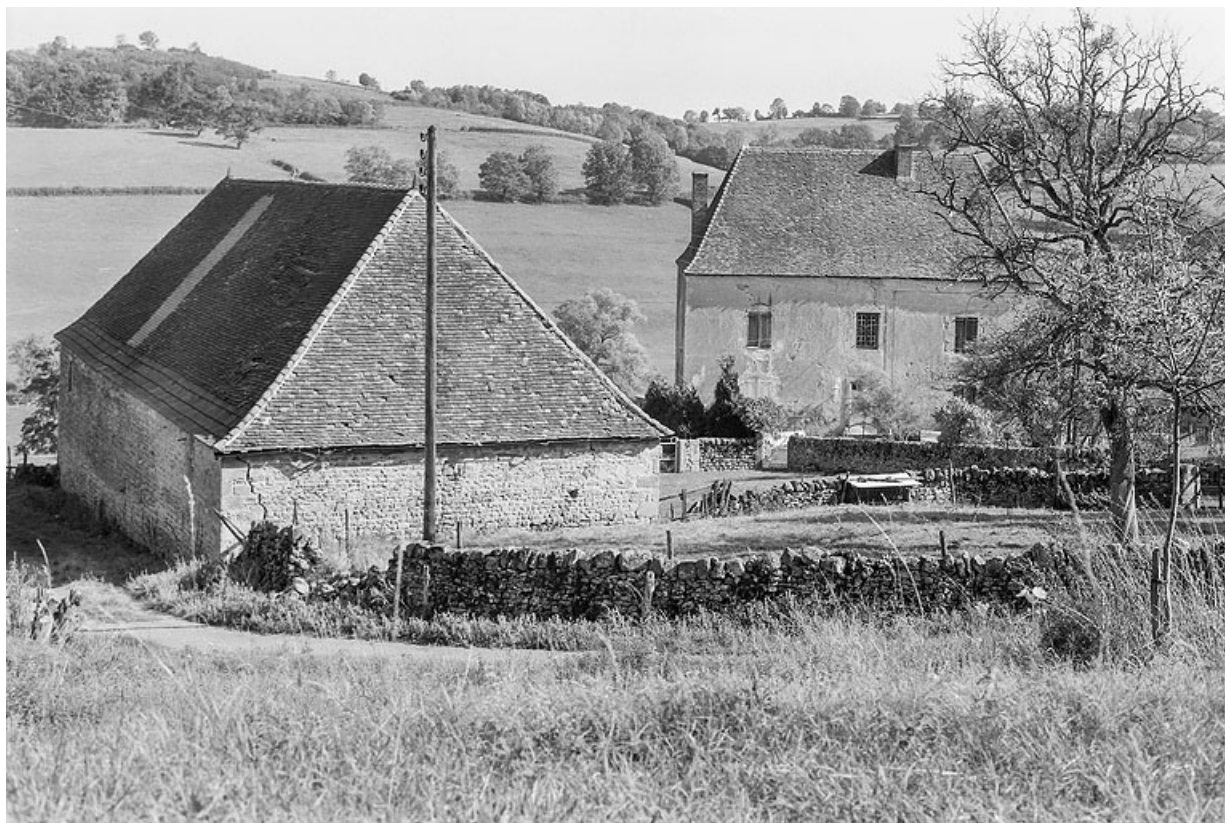
Vue de la ferme vers 1970. La grange, aujourd'hui partiellement transformée en habitation, était encore entièrement dédiée à l'usage agricole.