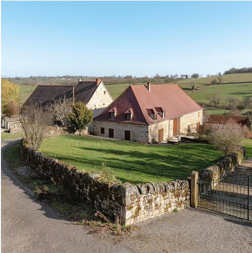
Vue de l'ancienne grange, qui comprenait une remise et deux étables, dont celle de gauche a été transformée en habitation. 71, Oyé, lieudit : Orval