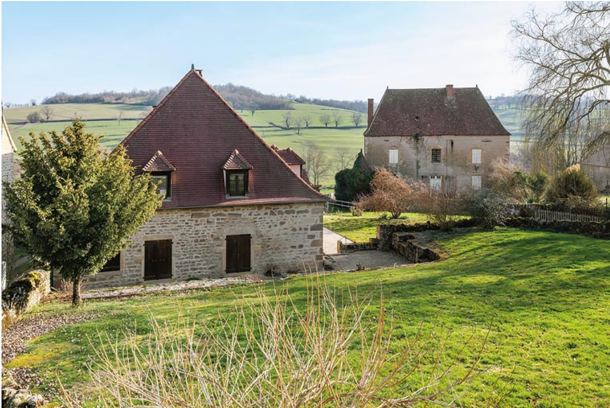
Vue de l'ancienne ferme d'embouche de la famille Mommessin. Au premier plan, l'ancienne grange. Au second plan, la maison construite en 1782.