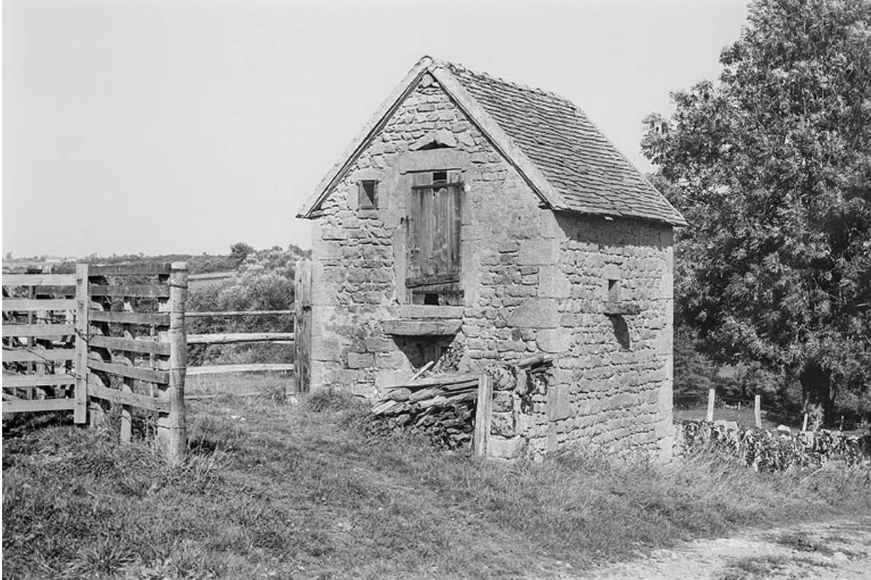
Vue d'un édicule à l'entrée d'un pré de la propriété, mentionné dans certaines sources comme bergerie, mais qui a pu aussi servir d'abri aux gardes de pré.