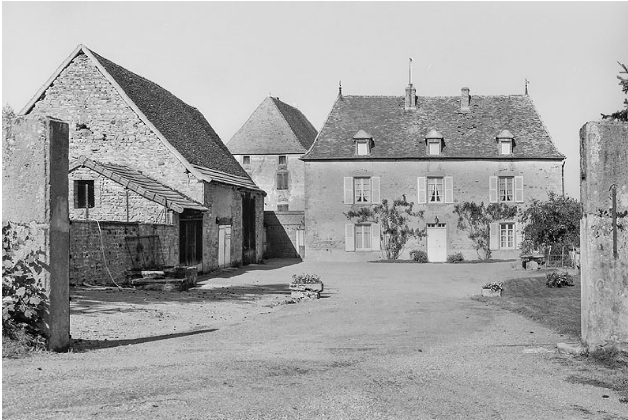
Vue de la ferme vers 1970