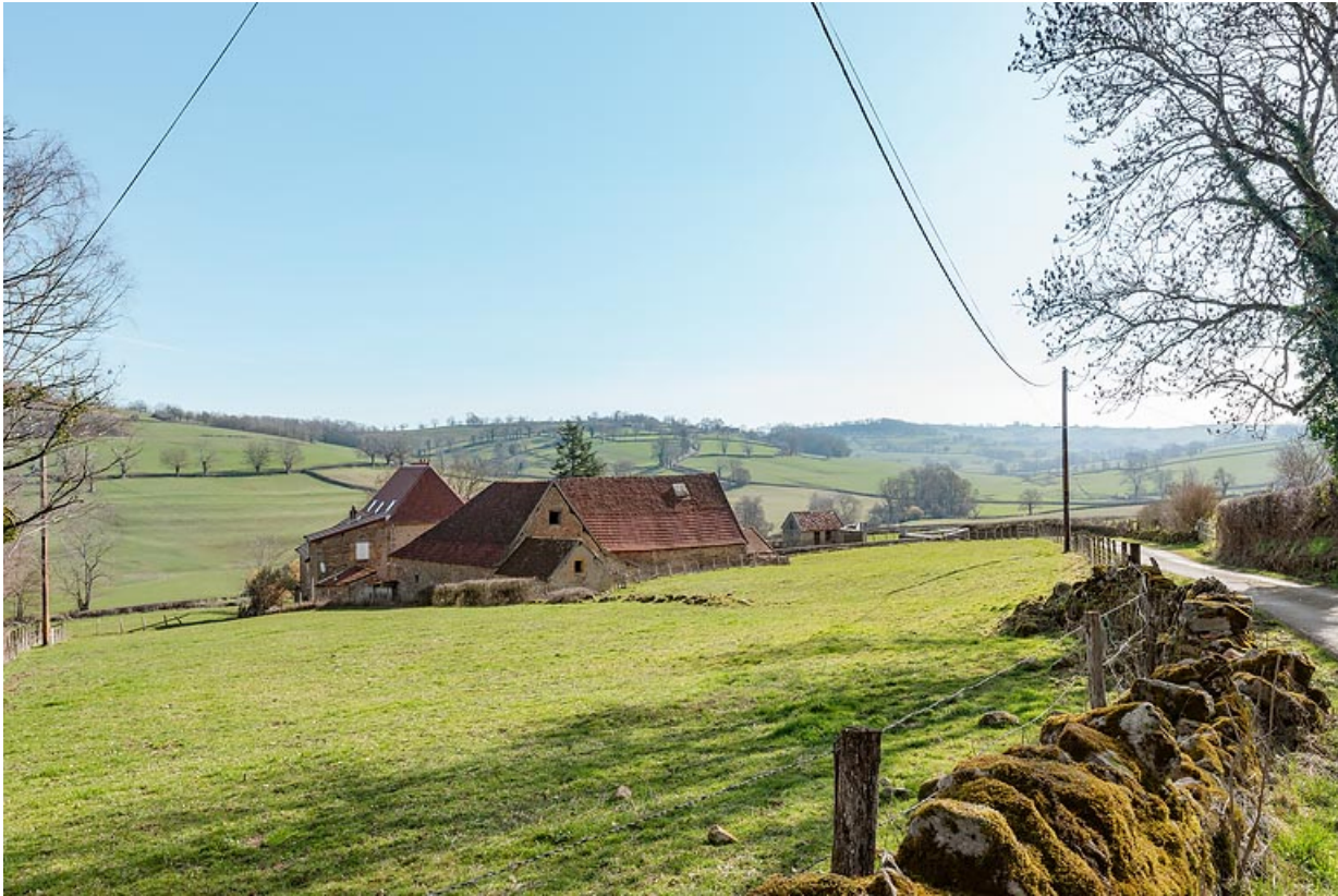
Vue de la ferme depuis la route, en venant de Chaumont. Plusieurs volumes (principalement en appentis) se développent à l'arrière des bâtiments principaux.