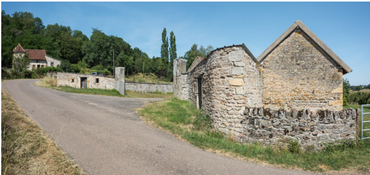
Vue sur l'entrée de la ferme. Le bâtiment agricole, au fond à gauche, a notamment servi de bergerie et a été rattaché à cette ferme au milieu du XIXe siècle. Il est aujourd'hui transformé en habitation.