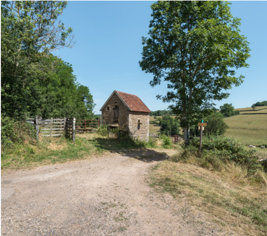
Petit bâtiment, à proximité de la ferme, qui servait peut-être d'abri aux gardes de pré 71, Oyé, lieudit : Orval

N° de l'illustration : 20197100152NUC4AQ