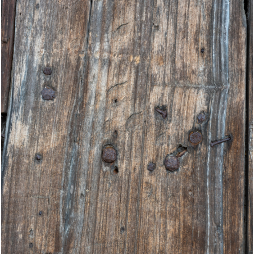
Détail du vantaill de la porte de remise.