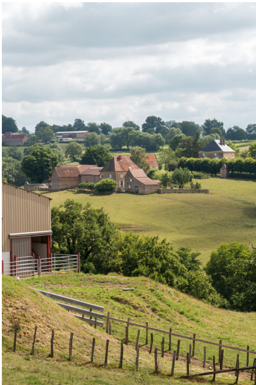
Vue d'ensemble depuis le sud-ouest.

71, Saint-Laurent-en-Brionnais, lieudit : les Chevennes