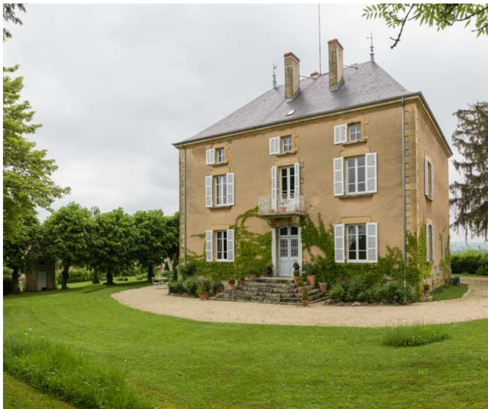
Façade postérieure, vue de trois quarts droite.

71, Saint-Laurent-en-Brionnais, lieudit : les Chevennes