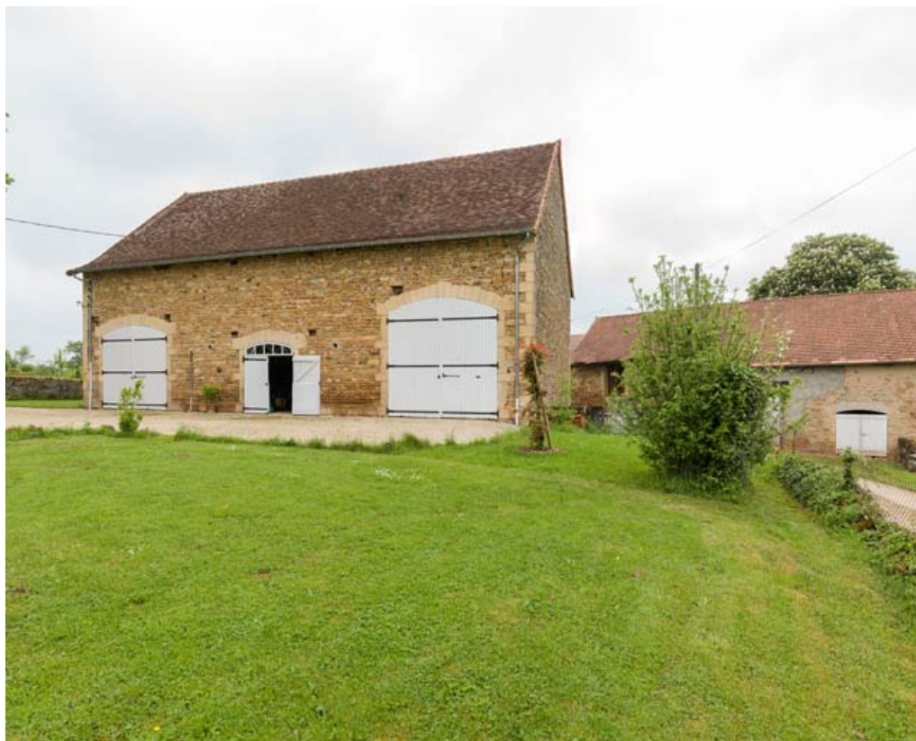
L'étable, vue de trois quart droite.

71, Saint-Laurent-en-Brionnais, lieudit : les Chevennes