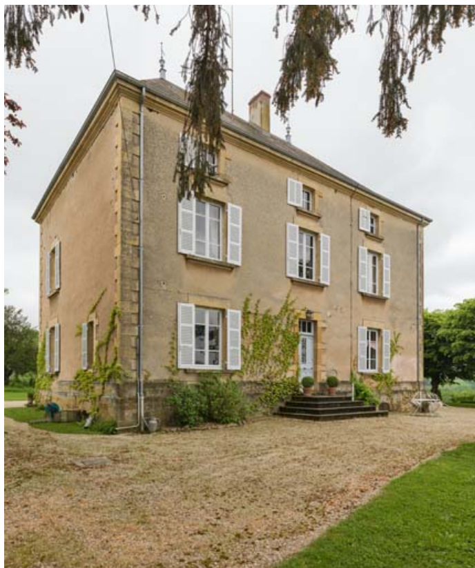
Façade nord de la maison, vue de trois quarts gauche.

71, Saint-Laurent-en-Brionnais, lieudit : les Chevennes