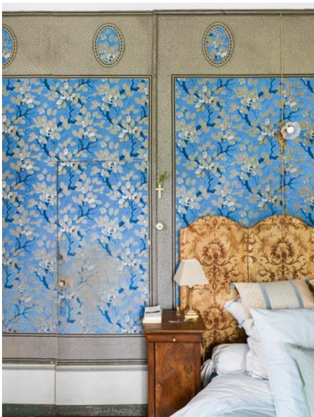
Chambre à coucher. Détail du papier peint.

71, Saint-Laurent-en-Brionnais, lieudit : les Chevennes