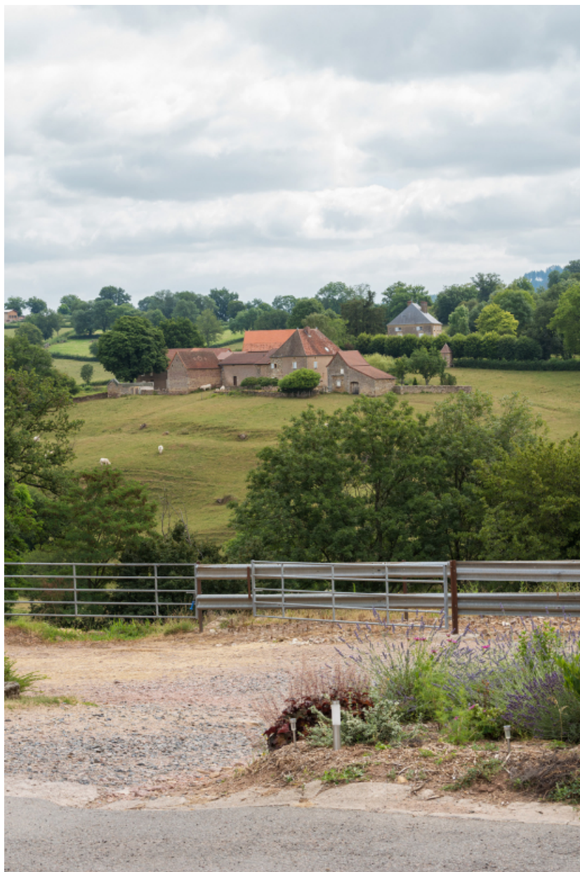
Vue d'ensemble depuis l'ouest.

71, Saint-Laurent-en-Brionnais, lieudit : les Chevennes