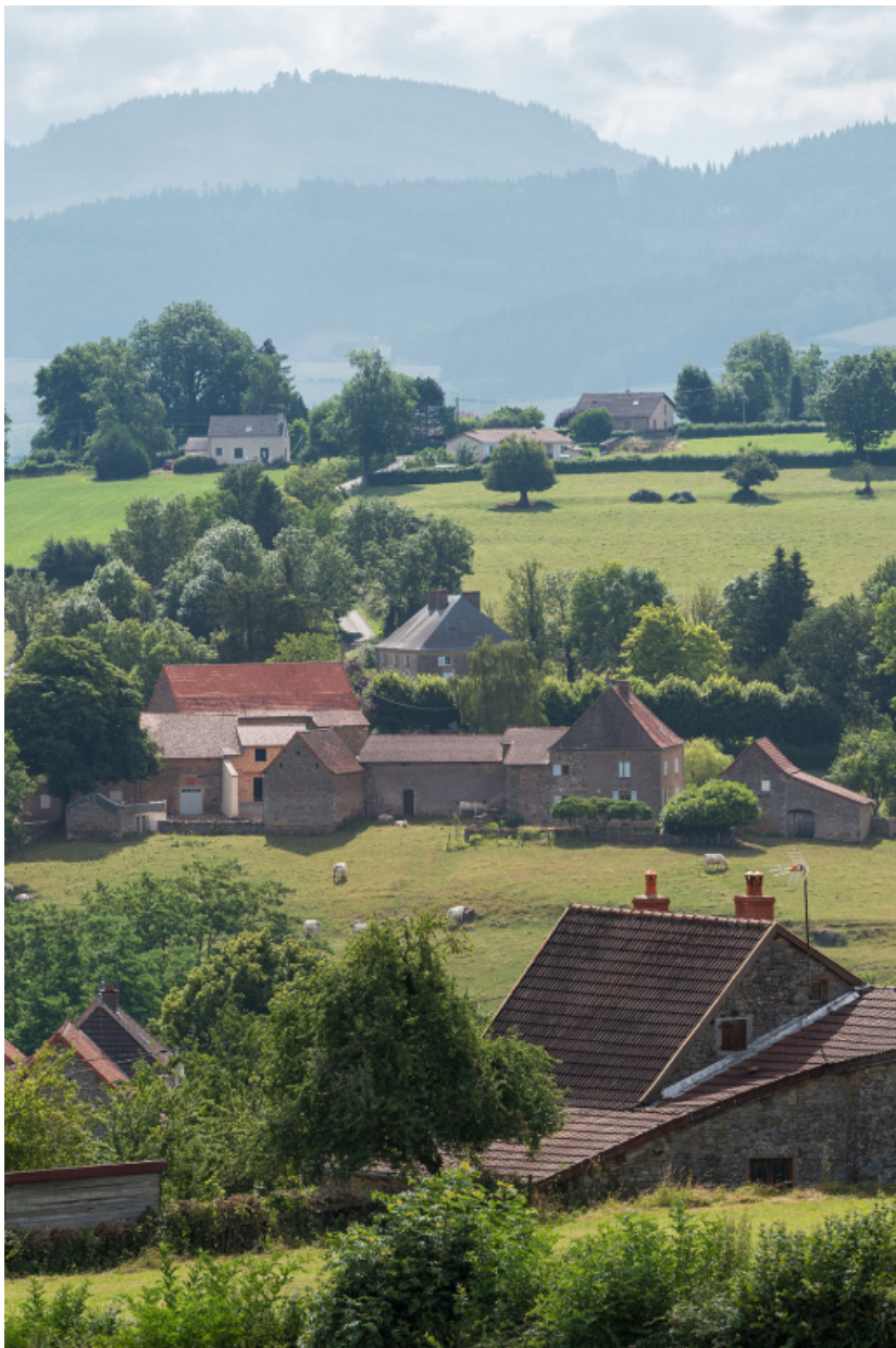
Le hameau des Chevennes (cadrage vertical).

71, Saint-Laurent-en-Brionnais, lieudit : les Chevennes