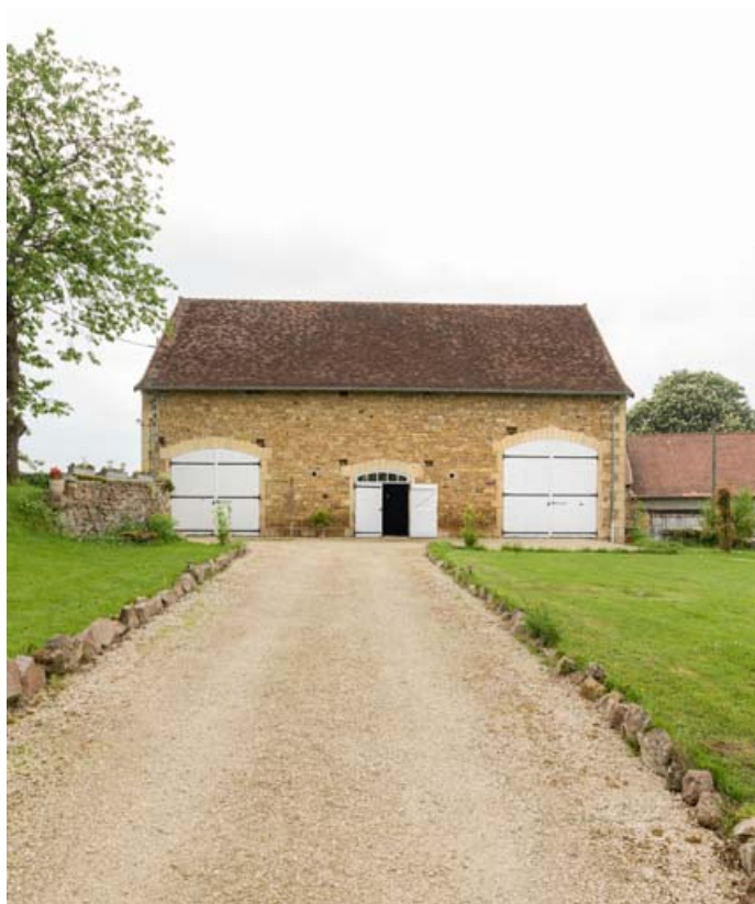
L'étable vue de face.

71, Saint-Laurent-en-Brionnais, lieudit : les Chevennes