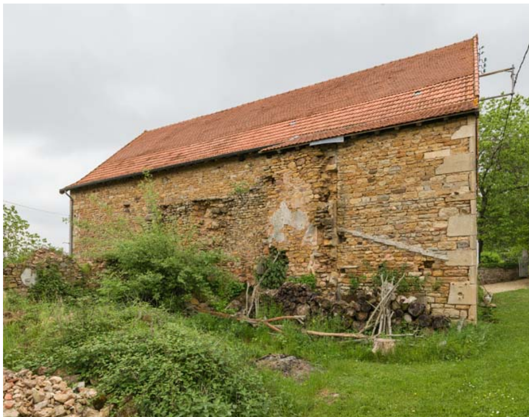
Façade postérieure de l'étable.

71, Saint-Laurent-en-Brionnais, lieudit : les Chevennes