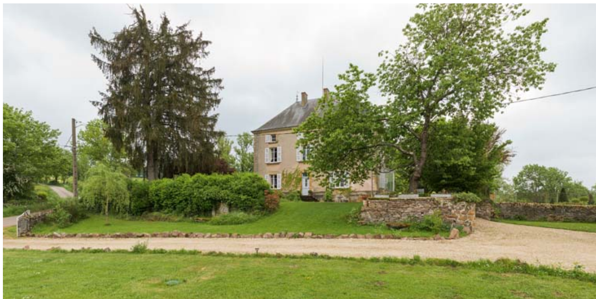
Maison d'habitation. Vue d'ensemble depuis le nord.

71, Saint-Laurent-en-Brionnais, lieudit : les Chevennes