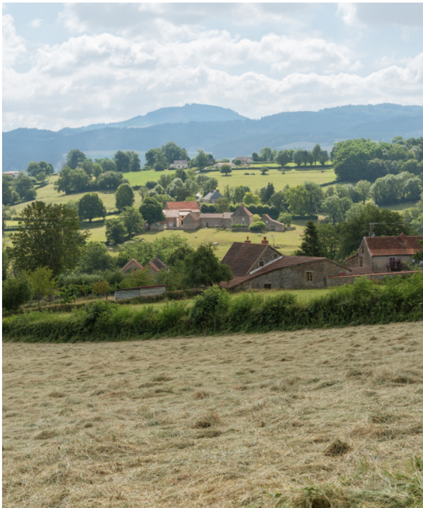
Le hameau des Chevennes dans la campagne brionnaise.

71, Saint-Laurent-en-Brionnais, lieudit : les Chevennes