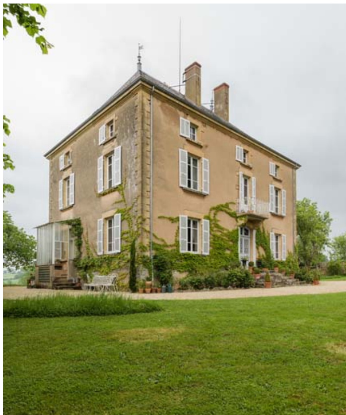
La maison, vue de trois quart gauche.

71, Saint-Laurent-en-Brionnais, lieudit : les Chevennes