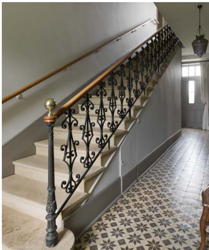
Escalier d'accès au premier étage.

71, Saint-Laurent-en-Brionnais, lieudit : les Chevennes