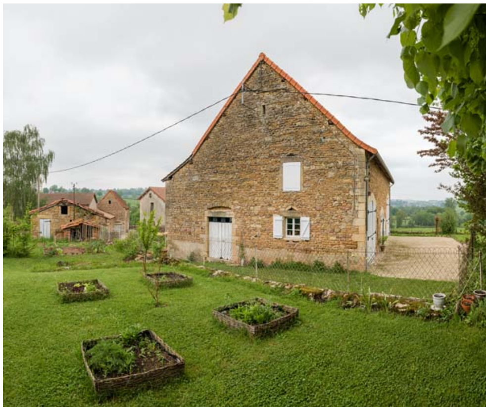
Pignon sud de l'étable.

71, Saint-Laurent-en-Brionnais, lieudit : les Chevennes