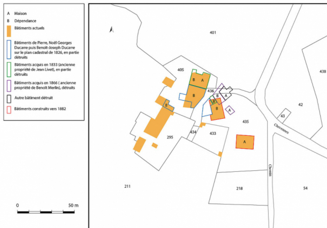
Plan de masse et de situation, présentant l'évolution des bâtiments du hameau. Extrait du plan cadastral, 2020, section C, échelle 1/5000.

71, Saint-Laurent-en-Brionnais, lieudit : les Chevennes