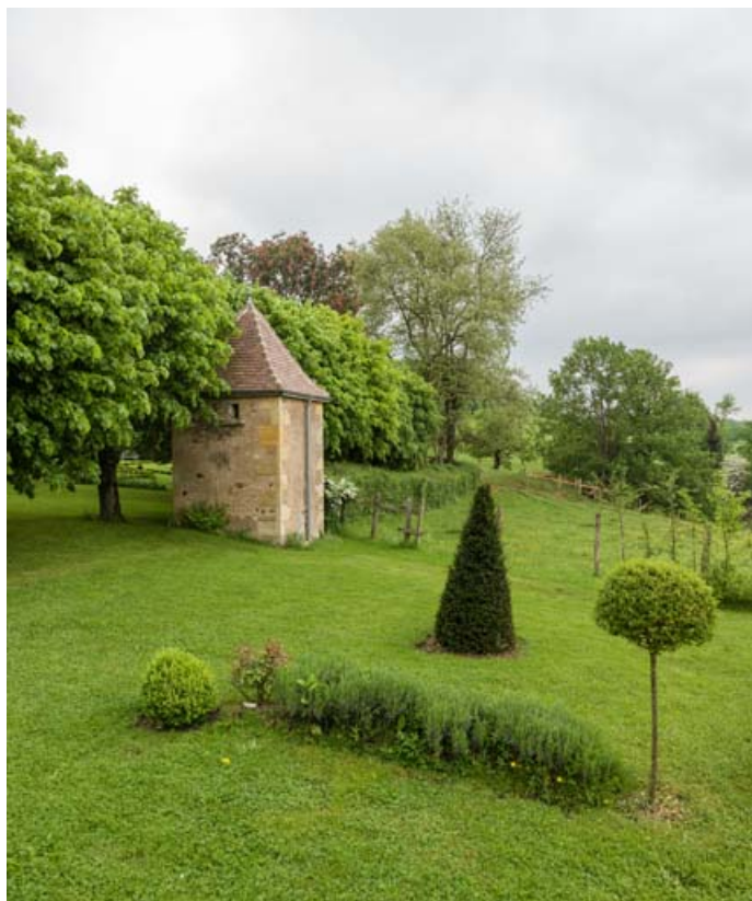
Le colombier, vu depuis le parc.

71, Saint-Laurent-en-Brionnais, lieudit : les Chevennes