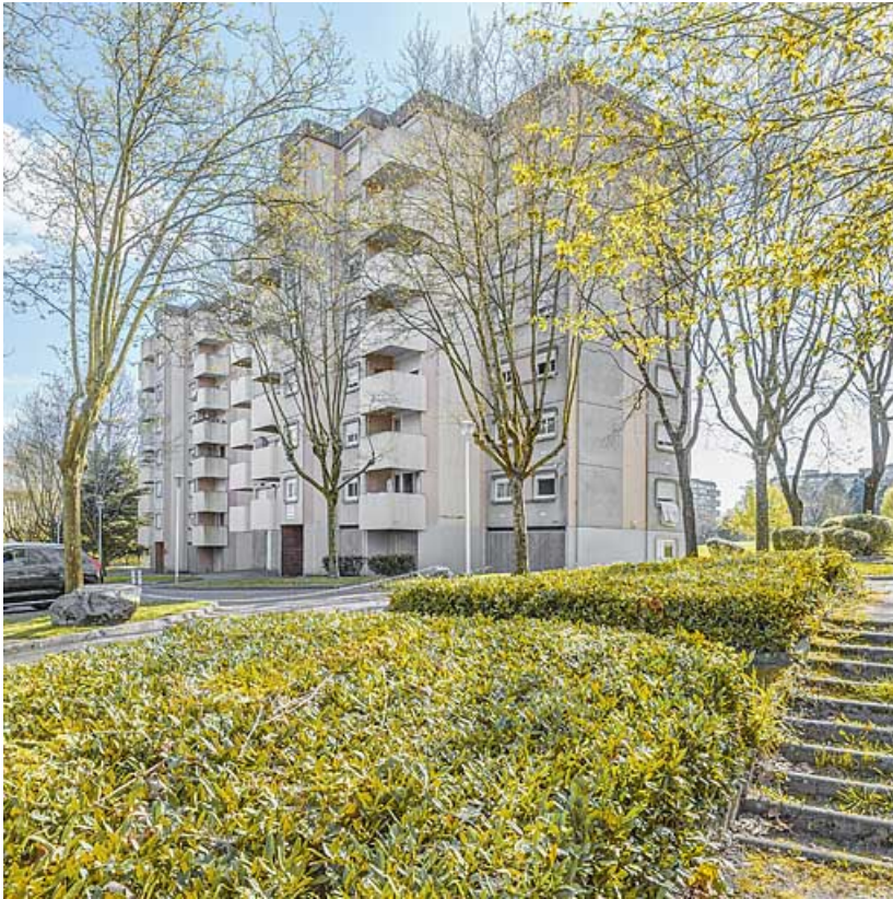
Immeuble modèle régional Redan de la cité Harfleur : façade antérieure et pignon. 71, Le Creusot avenue de Montvaltin