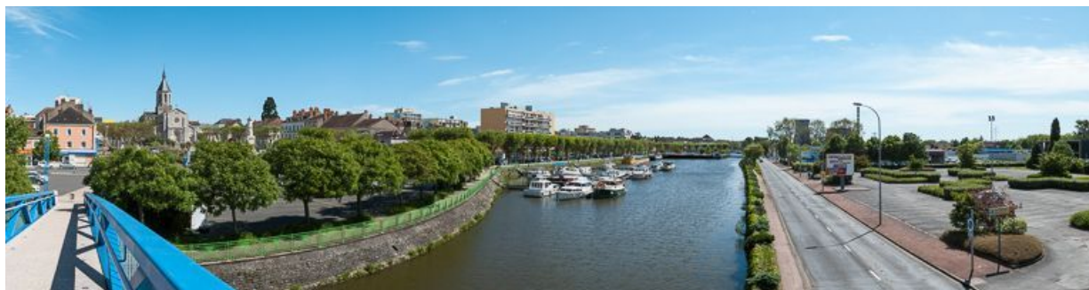
Panorama de la ville de Montceau, de gauche à droite : l'église, le pont mobile et au fond la centrale électrique de Lucy. 71, Montceau-les-Mines, lieudit : bief 10 du versant Loire-Océan

N° de l'illustration : 20137100424NUC4AQ