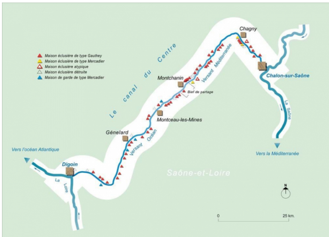
Carte schématique du canal du Centre avec la localisation des différentes maisons éclusières et de garde.