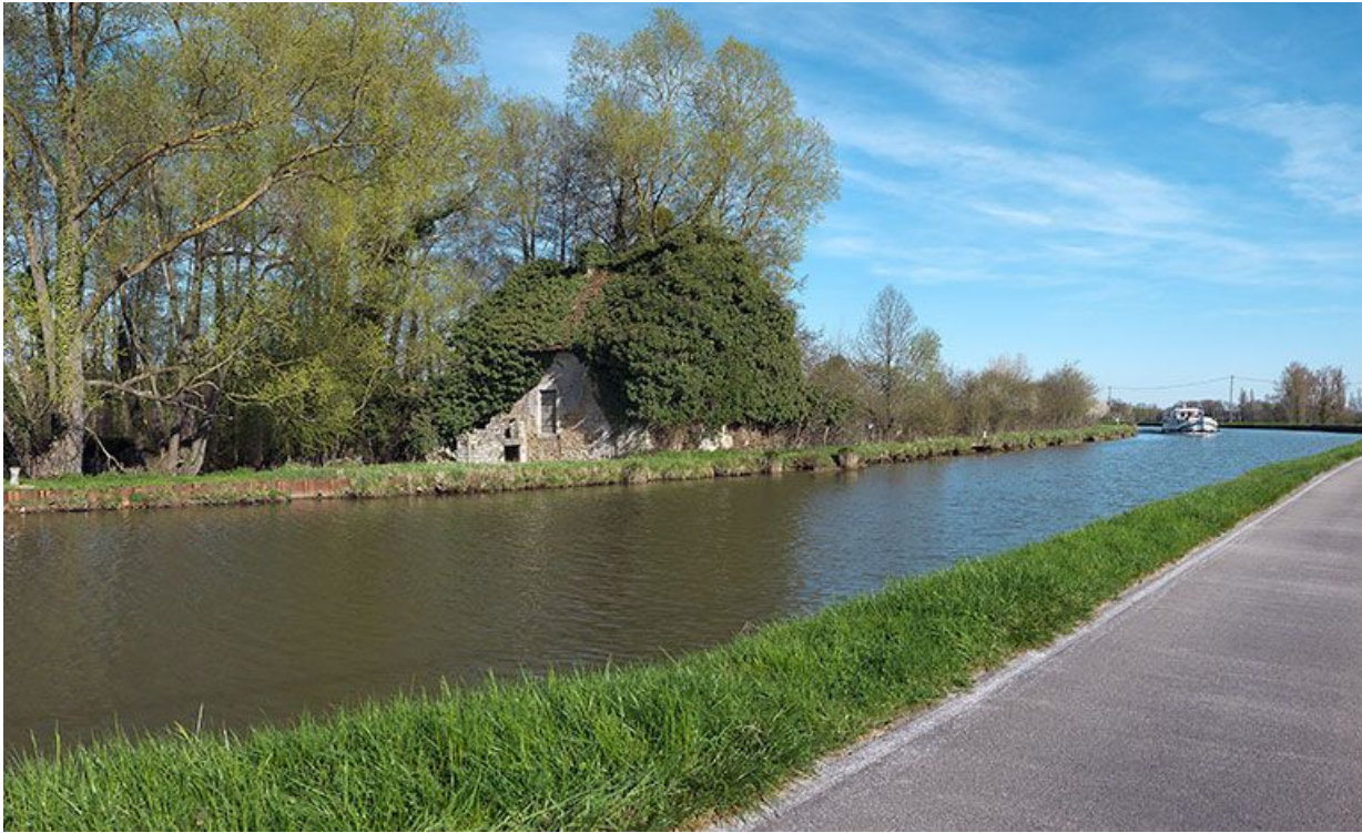
La maison éclusière XXXVII depuis la rive droite.

71, Rully, lieudit : bief 28 du versant Saône-Méditerranée