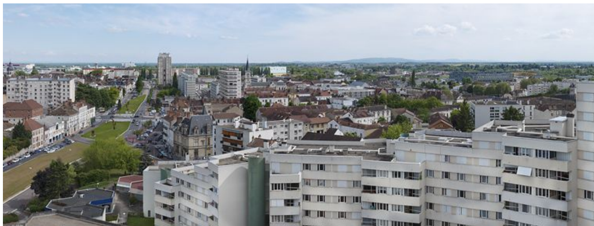
Panorama de la ville de Chalon-sur-Saône : à gauche, l'ancien tracé du canal, aujourd'hui avenue Nicéphore Niépce, au centre, l'église Saint-Cosme et à droite, l'hôpital William Morey.